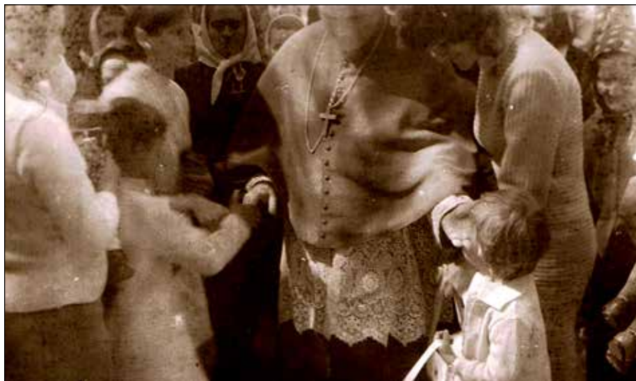
Karol Wojtyła w 1974 roku przewodniczy uroczystości Roku Świętego w Lipnicy Wielkiej