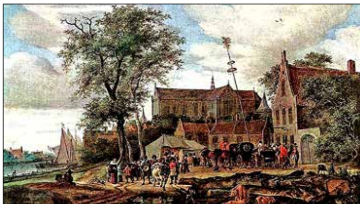
Oberża z mojem – obraz holenderskiego malarza Salomona van Ruisdaela z 1664 r.

Stawianie mojów jest starą orawską tradycją polegającą na tym, że kawaler chcący przypodobać się wybrance serca, wznosił przed jej domem odpowiednio przygotowany i ozdobiony moj , czyli wysoką jodłę z obraną skorupą drzewa i jego koroną przybraną wstążkami. Moj pod domem dziewczyny oznaczał jej powodzenie u chłopców. Była to też po prostu okazja do spotkania się, czy pokazania fantazji i zaradności kawalera, który mu-