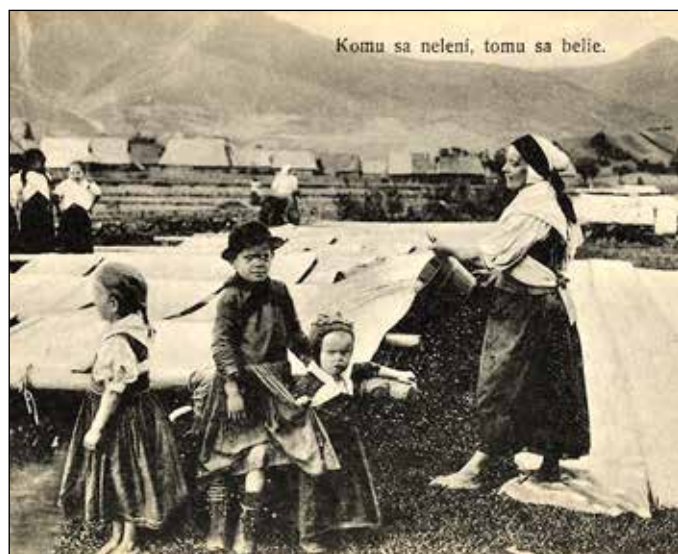
Komu sa neleni, tomu sa bejie.