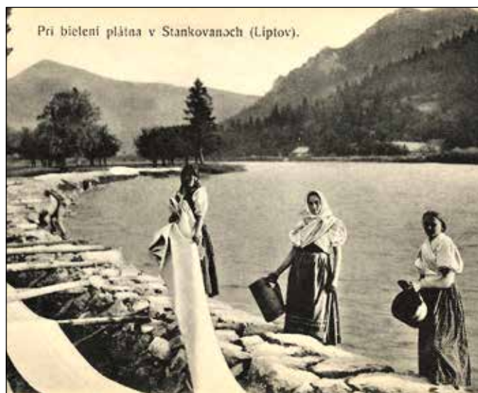
Pri bieleni plátna v Stankovanoch (Liptov).