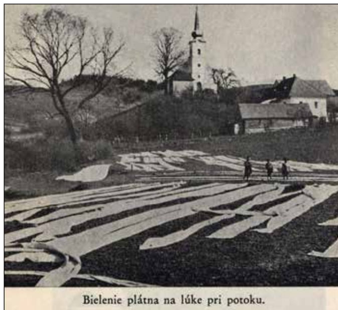
Bielenie płótna na łúce pri potoku.

siemię od plew. Wiało się to ręczną wiejnią, ale lepiej było, jak był wiaterek nie bardzo porywisty. Rozciągało się na ziemi łoktuse i wiało na wietrze. Siemię spadało prosto, bo było cięższe, a plewy zabierał wiatr. Część siemienia zostawiało się na przyszły rok do siewu a resztę brał mój śp. tata do olejarni tłoczyć olej. Olejarnia była za wodą u państwa Szklarczyków. Pamiętam, jak tata przyniósł ten olej do domu w takim dużym dzbanku. Mama nam wlała do miseczki oleju i maczaliśmy w nim chleb i jedli.