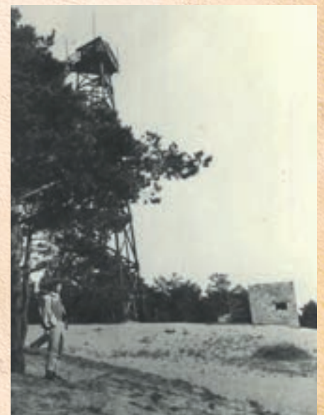
1957r, bunkier i wieża na Dąbrówce.