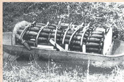
Bomby w pojemniku zrzutowym – tzw. kasecie