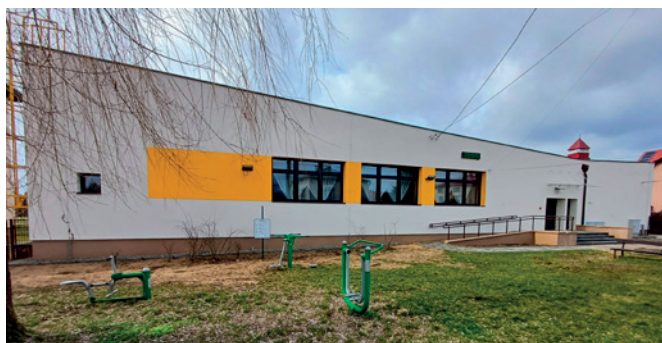
Świetlica w Ryczówku