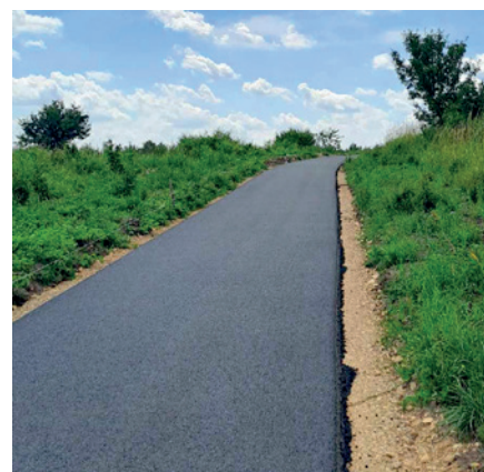
Ścieżka pieszo-rowerowa w Bydlinie