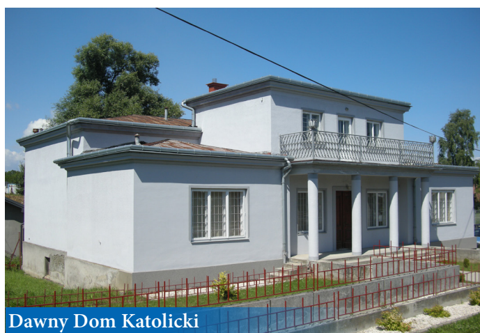
Dawny Dom Katolicki

Do zmiany granic w drugiej połowie XX wieku cały zamek położony był na terenie Tarnowca. Wieś wymienia Jan Długosz w Księdze uposażeń diecezji krakowskiej z ok. 1470 roku jako własność Jana Amora z Tarnowa. Kmieci wtedy nie było, tylko zagrodnicy, którzy płacili dziesięcinę wartości 16 grzywien kustodii tarnowskiej. Była tu też karczma i folwark zamkowy. W 1536 roku w Tarnowcu płacono podatek od ośmiu zagród; wieś miała dobry folwark, obfite łąki i sadzawki. W roku 1570 wieś wraz zamkiem ucierpiała podczas tzw. wojny o hrabstwo tarnowskie. Według autora hasła „Tarnowiec” w Słowniku geograficznym Królestwa Polskiego, w 1892 roku w skład Tarnowca wchodziły osady: „Budy (2 domy, 6 mieszkańców), Stawy (3 domy, 20 mieszkańców), Tarnowiec (54 domy, 314 mieszkańców) i Tarnowiecka Wólka (12 domów, 80 mieszkańców), razem 71 domy, 420 mieszkańców, a na obszarze większej posiadło-