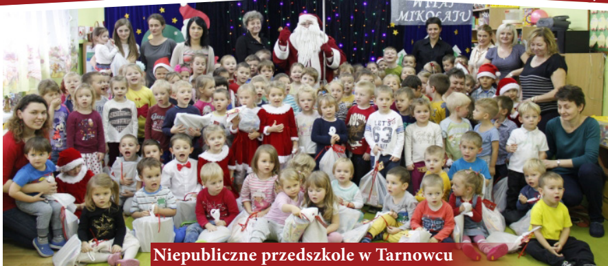
Niepubliczne przedszkole w Tarnowcu

W pierwszych tygodniach grudnia do przedszkoli i oddziałów przedszkolnych na terenie gminy Tarnów zawiązał z prezentami Święty Mikołaj. Czekwały na niego piękne dekoracje, piosenki, wierszyki i świąteczne stroje. Oczekiwano cały rok świętego do przedszkoli przyprawdzili przedstawiciele samorządu. Wszystkie dzieci potwierdziły, że przez cały rok były grzeczne zarówno w domach, jak i w przedszkolu, otrzymały piękne prezenty, w których znalazły się przybory szkolne, jak m.in. różnie wykonane piórniki, czy zdrowe przysmaki w postaci jabłkowych chipsów oraz zbożowych ciasteczek. Święty Mikołaj zapewnił również, że jeszcze raz przyjdzie do wszystkich dzieci, tym razem w ich domach. To już kolejny rok, kiedy gmina Tarnów zorganizowała „akcję Mikołaj”. Paczki wykonali pomocnicy Świętego Mikołaja, czyli pracownicy Centrum Kultury Gminy Tarnów.