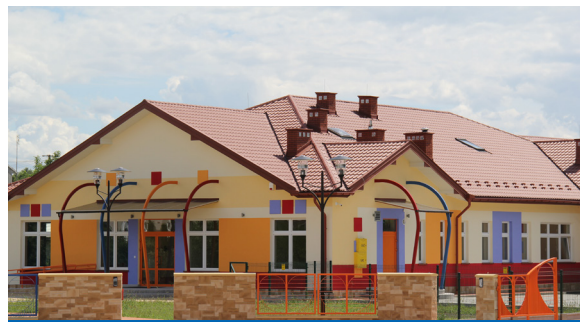
Nowy budynek przedszkola - Wola Rzędzińska

dla potrzeb administracyjnych oraz tablicy multimedialnej dla klasy pierwszej. W sumie na te działania przeznaczone zostało ponad 18 tysięcy złotych.