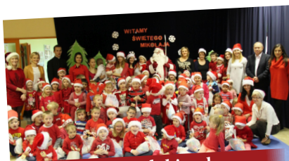
Przedszkole w Zgłobicach