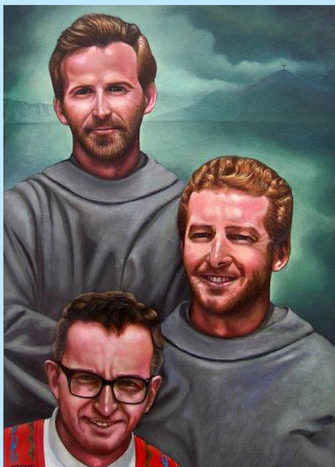
Blógostawiony Ojciec Strzatkowski - s. 7

Nr 4 (131) · Grudzień 2015 · ISSN 1897-2446