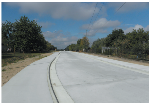
Ulica Mościcka - Zbylitowska Góra