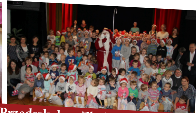
Przedszkole w Zbylitowskiej Górze