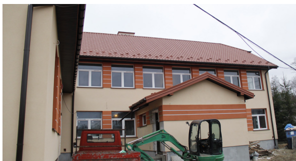
Nowe skrzydło szkoły - Jodłówka Wałki

dowa kompleksu sportowego z salą gimnastyczną przy szkole w Koszycach Małych . W najbliższym czasie zostanie też podpisana umowa na wykonanie projektu modernizacji budynku tzw. „starej kaplicy” w Tarnowcu , która w czerwcu została zakupiona przez gminę, by ponownie służyć mieszkańcom tej miejscowości.