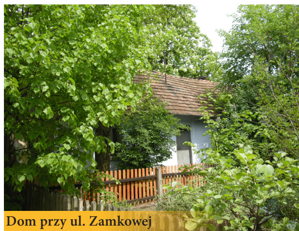
Dom przy ul. Zamkowej