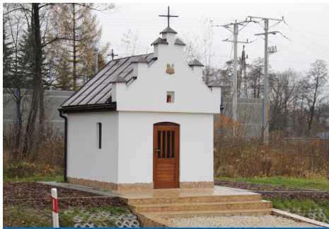
Odnowiona kapliczka - Wola Rzędzińska

Zupełnie inną grupę nieplanowanych wcześniejszej inwestycji stanowią te, które można by nazwać rozwiązywaniem problemów mieszkańców. Ich często nagłe pojawienie się bywa na ogół warunkowane pilną potrzebą. Do takich można zaliczyć na przykład prace remontowe oraz doposażenie szkoły podstawowej w Zbylitowskiej Górze , gdzie przeznaczono dodatkowe środki na remont kominów, zakup komputera