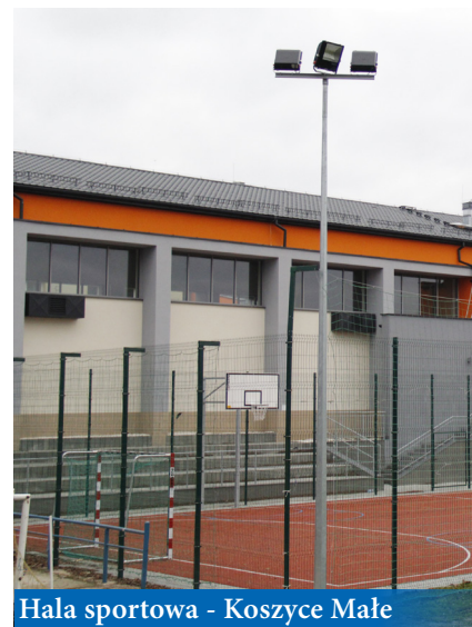
Hala sportowa - Koszyce Małe

Kilka nieplanowanych wcześniej zadań dotyczy poprawy estetyki otoczenia. Przy wybudowanym w ostatnich latach boisku wielofunkcyjnym w Błoniu położone zostało około 70 m 2 . betonowej kostki obejmującej chodnik oraz schody. Podobne schodki jak przy boisku w Błoniu zostały wykonane także na boisku KS Biała . Z kolei w Woli Rzędzińskiej przy ekranach akustycznych powstałych w wyniku modernizacji