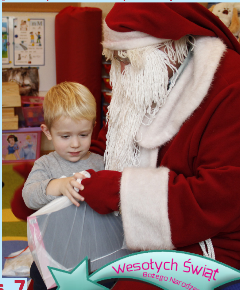
Mikołaj odwiedził najmłodszych - s. 12