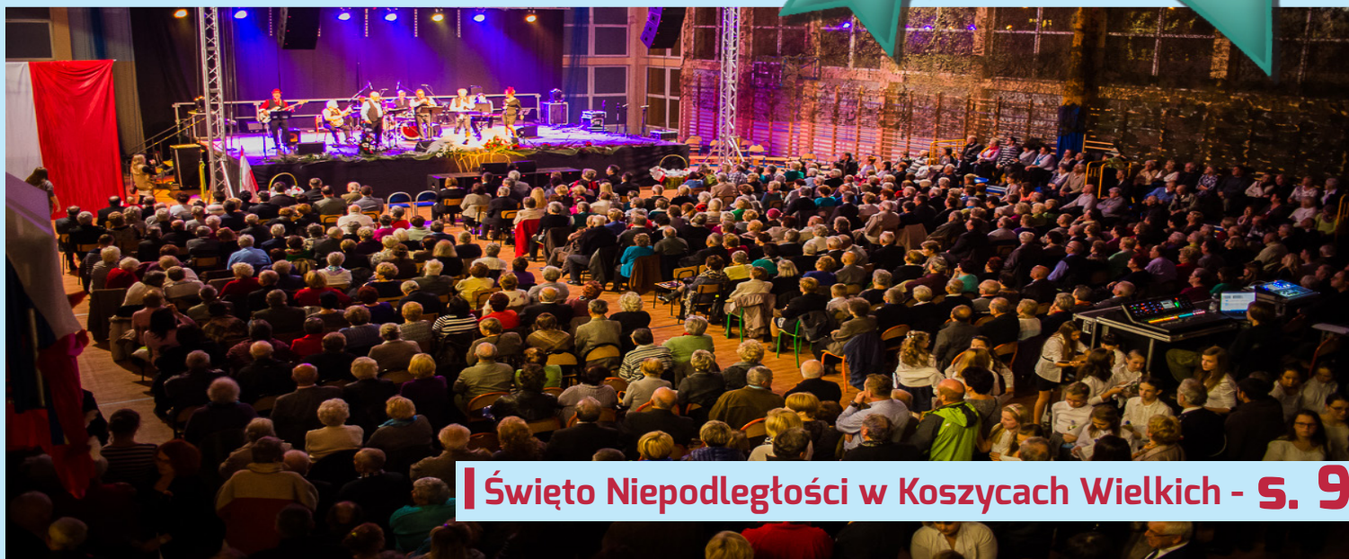
Święto Niepodległości w Koszycach Wielkich - s. 9