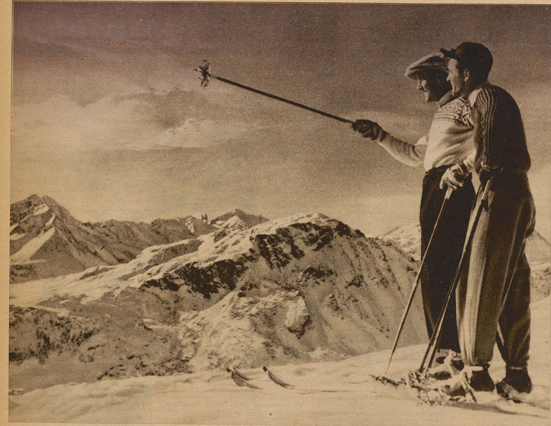
Powyżej: nagrodą za trudny wspinaczki jest wspaniały widok ośnieżonych gór.

Poniżej: narciarska wędrowka przez lasy, drzemiące w przepięknej oksi.