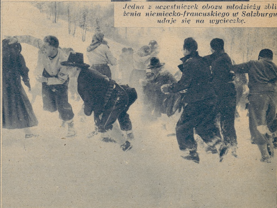
Zacięty bój na... kule śnieżne stanowi urozmaicenie pobytu w górach.