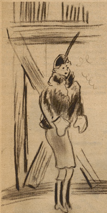
...biedaczka zmarła na kość słoniową...

Staruszka uśmiechnęła się dobrotliwie. Była tego samego zdania.