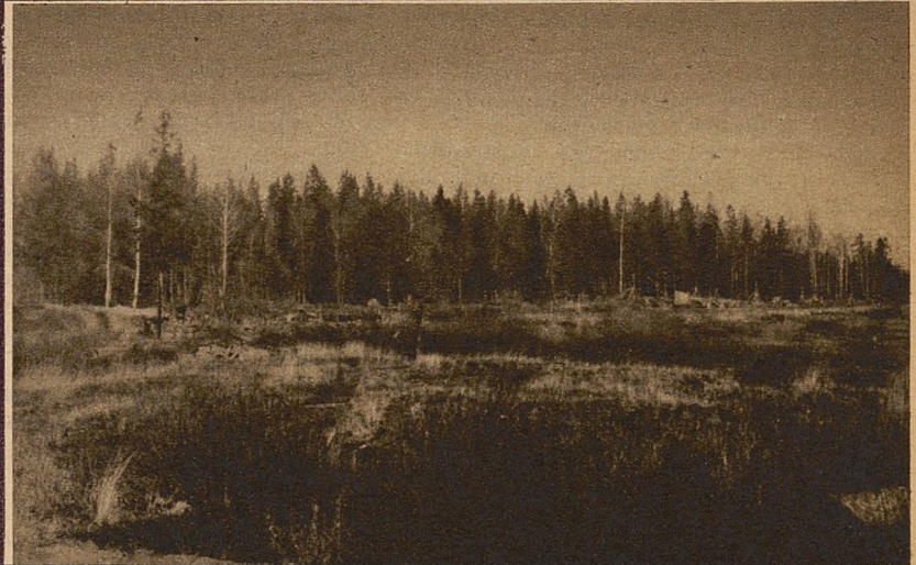
Wioska olimpijska powstaje wśród lasów, otaczających miasto Helsinki.