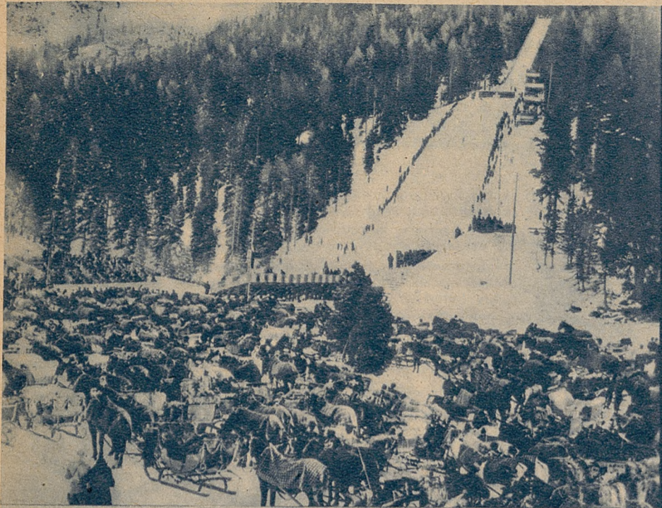
Powyżej: widok na skocznię olimpijską w St. Moritz.

Kiedy Japonja zrzekła się organizacji Igrzysk Olimpijskich roku 1940, rozpoczęła się kampanja kilku państw o „olimpijski spadek”. Podczas gdy igrzyska główne zdobyła Finlandja — zimowe igrzyska przyznano Szwajcarii. Wiadomość o tem cała Europa przyjęła z dużym zadowoleniem, gdyż Szwajcarija posiada idealne wprost warunki do organizowania zawodów narciarskich, hokejowych i łyżwiarskich, dysponując takimi terenami, jakimi nie może się poszczycić wiele innych państw.