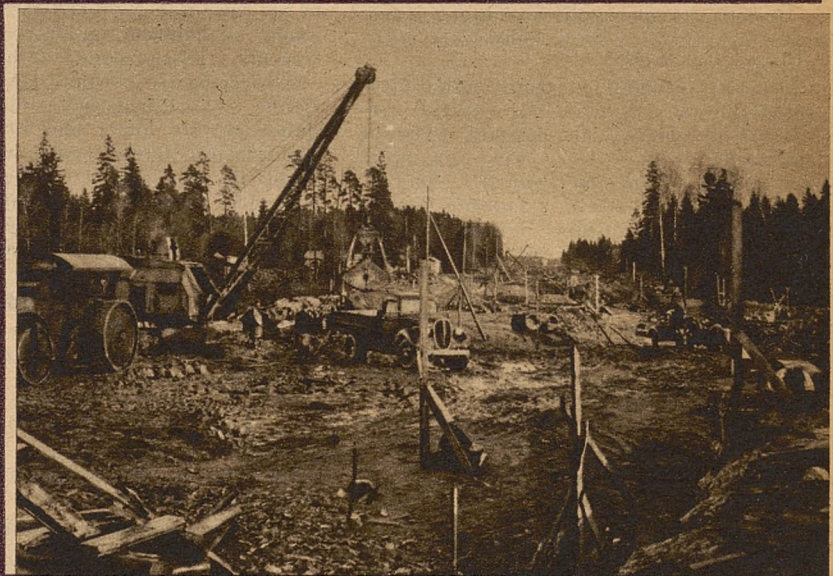
Fragment budowy głównej drogi w wiosce olimpijskiej w Helsinkach