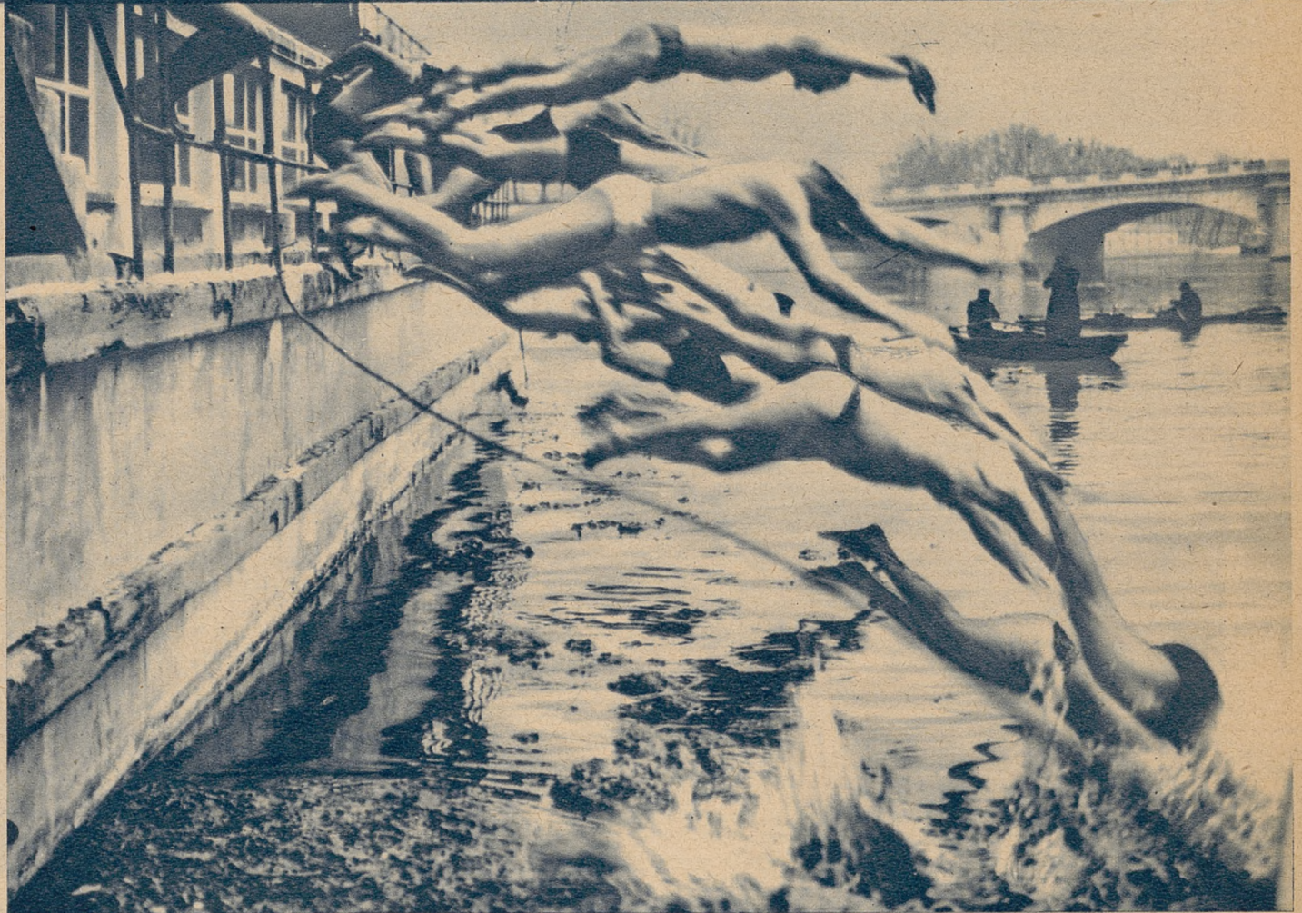
Powyżej: start do 30 wyścigu wplaw przez Sekwanę, rozegranego w pierwszy dzień świąt Bożego Narodzenia w Paryżu.

W dniu zawodów tłumy ustawiły się w pobliżu mostu Aleksandra, gdzie wyznaczono miejsce startu. Gawiedź paryska lubi wszelkie nadzwyczajności, a wyścig wplaw przez lodowatą rzekę stanowił przecież niemalą atrakcję, zwłaszcza, że z uwagi na dzień świąteczny brak było