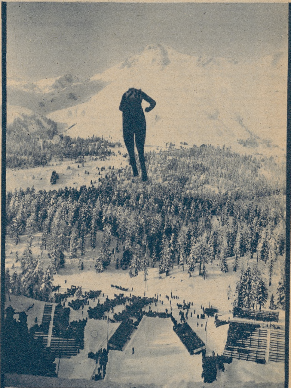
Powyżej: fragment konkursu skoków na skoczni olimpijskiej w St. Moritz.

organizowała głównych zawodów olimpijskich, posiada jednak