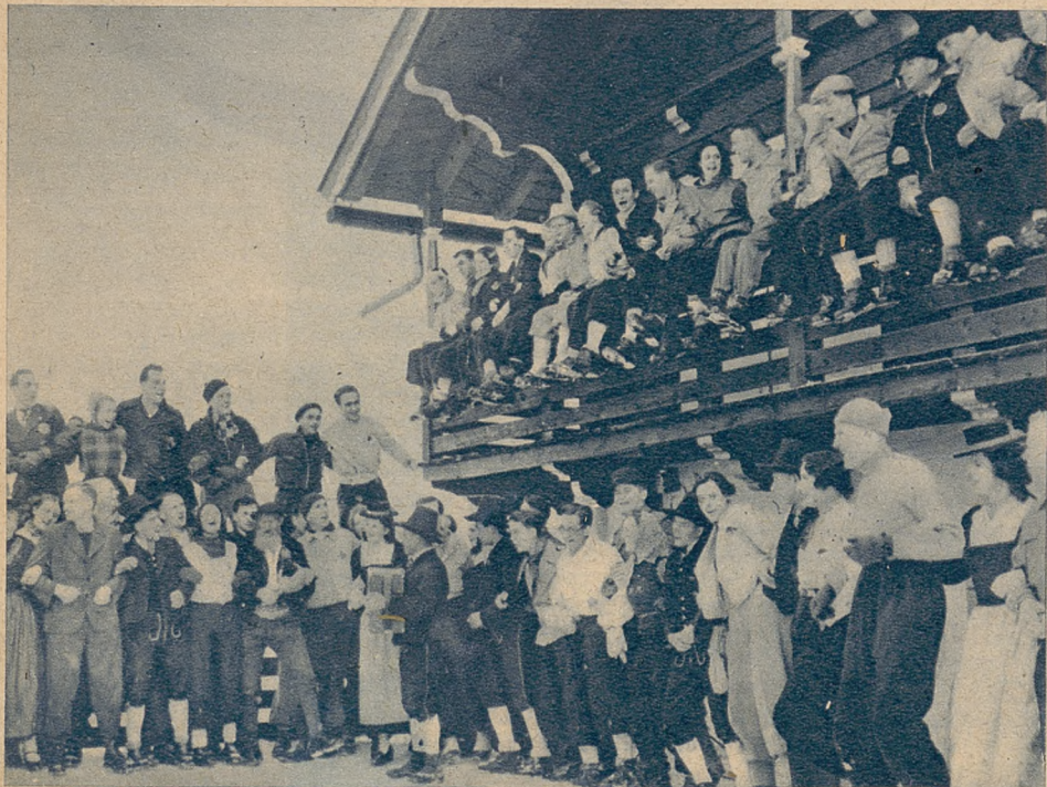
Wesoły Sylwester w obozie narciarskim w Salzburgu.

Jedna z uczestniczek obozu młodzieży zbliżenia niemiecko-francuskiego w Salzburgu udaje się na wycieczkę.