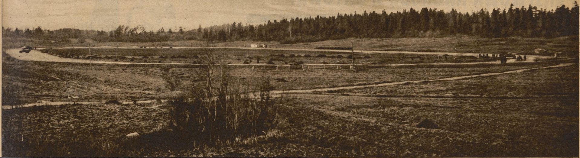
Widok na plac treningowy w wiosce olimpijskiej w Helsinkach z bieżnią długości 1000 m.

B udowa specjalnej „wioski” olimpijskiej, aczkolwiek znalazła zastosowanie dopiero dwukrotnie w dziejach Igrzysk Olimpijskich, a to w r. 1932 w Los Angeles i w r. 1936 w Berlinie, stała się jednak nieodłączną akcesorią organizacji Igrzysk.