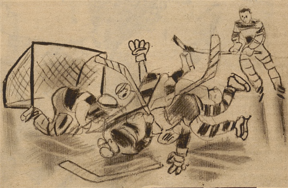
Powyżej: ...kłębowisko ciał ludzkich...

chroniły jej ani cienka spodniczka z dyweiny, ani skromne bolerko z karakutów, ani ubogi kołpaczek z krecich skórek i z piórkiem bazanciem na środku. Maleńkie jej rączęta tkwiły w zakopiańskich, dwupaluchowych rękawicach i, gdyby nie te ostatnie, byłyby napewno sine już w tej chwili od zimna.