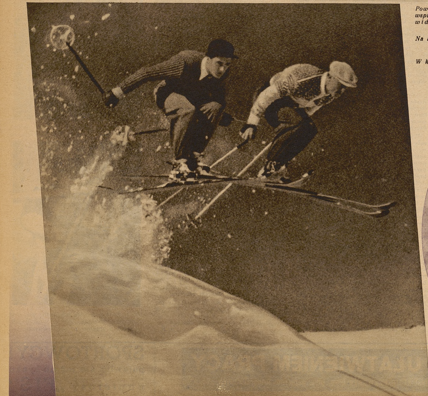
W kole: na trasie treningowego slalomu.