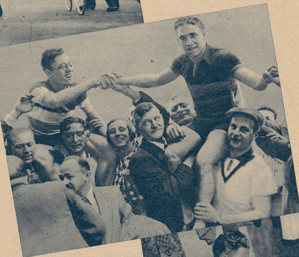
Powyżej: Scherens (na prawo) gratuluje zdobycia mistrzostwa świata Van Vlietowi w Amsterdamie w sierpniu r. 1938.

Najgroźniejsi ich do chwili obecnej rywale: Falck Hansen (Danja) i Lucien Michard (Francja) przechodzą powoli na „emeryturę”. Michard po raz ostatni zablęsnął w Kopenhadze w 1931 r., kiedy to przyszedł w finale o parę centymetrów za Falck Hansenem. Ogłoszono wtedy Falck Hansena mistrzem świata, lecz zdania na ten temat były podzielone i nawet później Michard wytoczył Międz. Federacji Kolarskiej proces, twierdząc, iż nastąpiła pomyłka, gdyż rower, którego koło o ułamek sekundy przekroczyło najprzód białą linię mety, należał do niego, a nie do Hansena. Sędzia znalazł się w bardzo trudnej