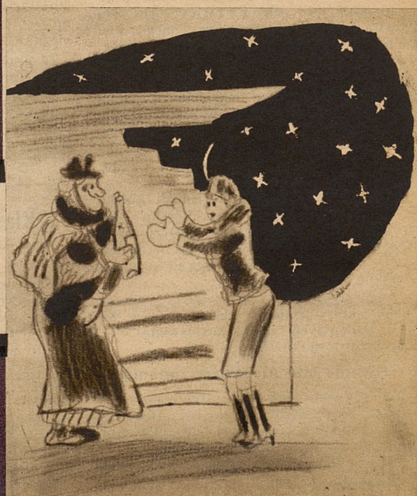
Na prawo: ...babciu najdroższa, weź mnie do siebie.

— W takim razie ten nasz bramkarz powinien już sobie pójść do nieba. Gwiazdka jego