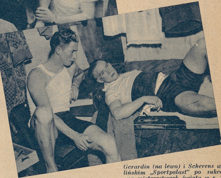
Gerardin (na lewo) i Scherens w berlińskim „Sportpalast” po sukcesach na mistrzostwach świata w r. 1932.