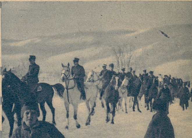
Poniżej: widok pięknie udekorowanego toru hipicznego w Zakopanem.