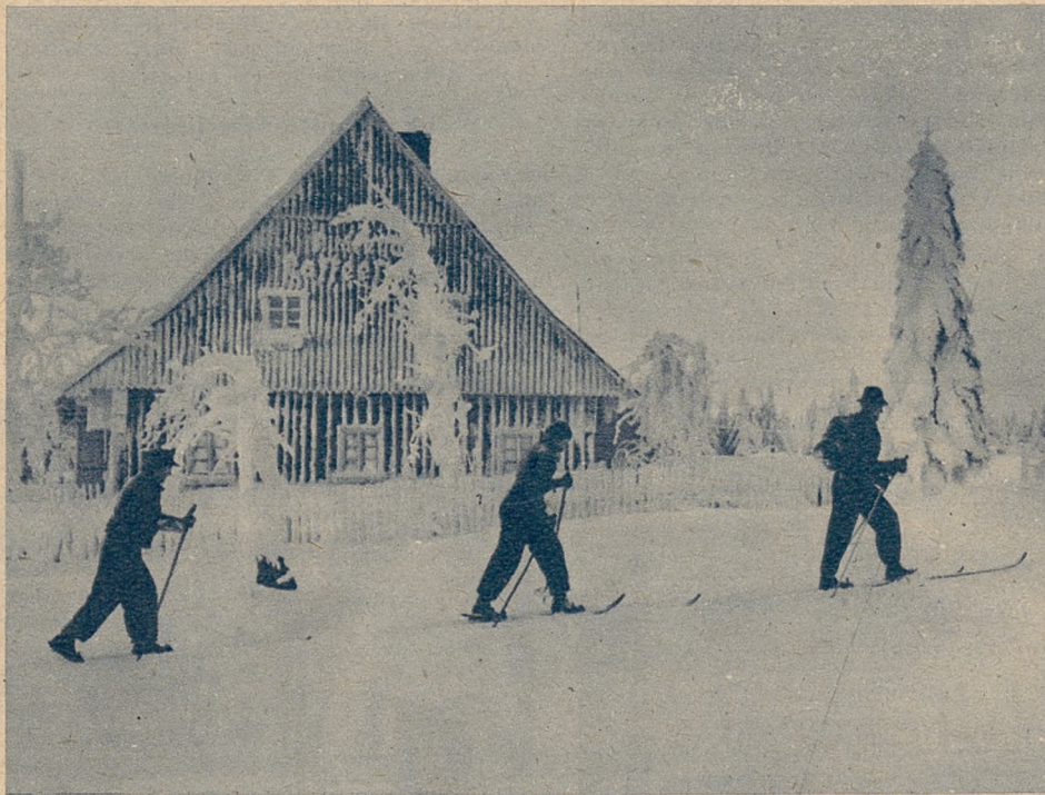
Z narciarskiej wędrowki po nizinach.