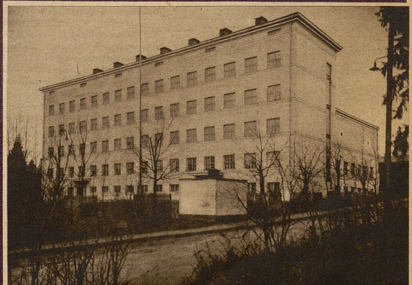
Budynek zarządu wioski olimpijskiej w Helsinkach, w którego skrzydłach mieszczą się dwie sale gimnastyczne.