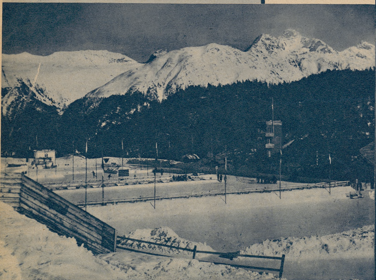
Poniżej: lodowisko w St. Moritz, na którym zostaną rozegrane olimpijskie zawody hokejowe i jazdy figurowej na lodzie.