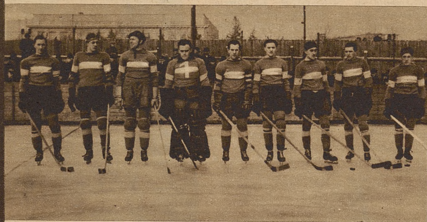
Drużyna Pogoni katowickiej na torze krakowskim.