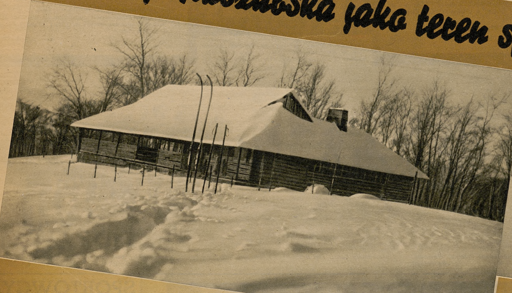
Zima w Szwajcarii Kaszubskiej.