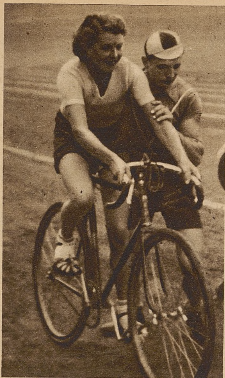
Żukowiczówna (KPW. Bydgoszcz) jedna z najlepszych zawodniczek, uprawiających kolarstwo wyścigowe.