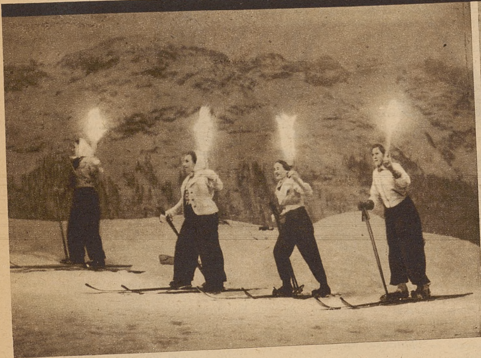
Poniżej: tradycyjny bieg narciarski z pochodniami, organizowany w wigilję Bożego Narodzenia w St. Moritz.