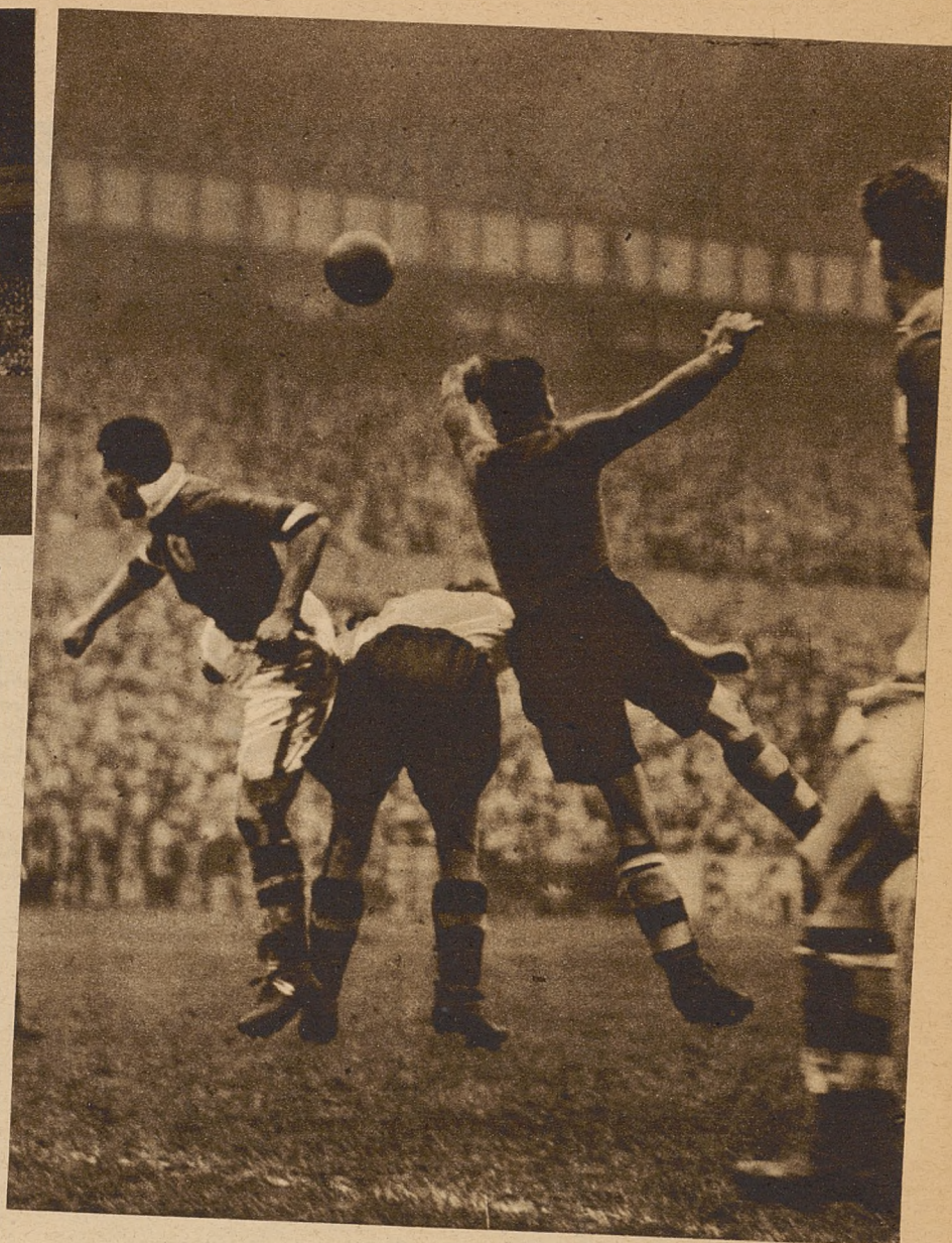
Fragment spotkania najlepszych drużyn londyńskich II Ligi Tottenham Hotspurs (białe koszulki) z Millwallem, które zgromadziło na boisku Tottenham w Londynie 50.000 osób.

Obydwa kluby znajdują się u czoła tabeli i przedzielone stosunkowo znaczną różnicą punktów od pozostałych klubów, (z wyjątkiem „Wolverhampton'u”) groźne są tylko dla siebie. Derby County utrzymało już swoją przewagę nad swym groźnym rywalem różniącą tylko punktu.