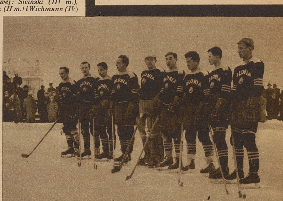
Drużyna hokejowa Polonii warszawskiej, pokonała reprezentację Łodzi 6:1.