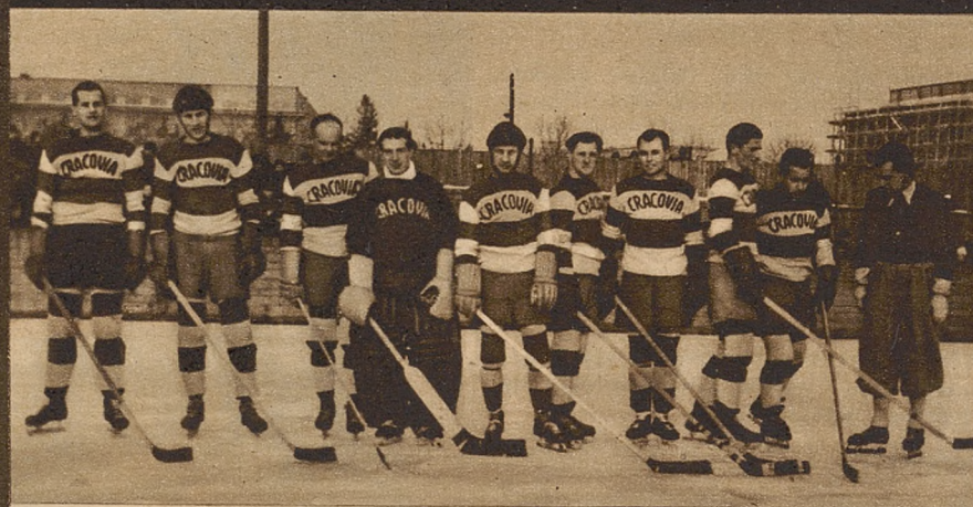
Drużyna Cracovii, która pokonała Pogoń katowicką w Krakowie 4:0.