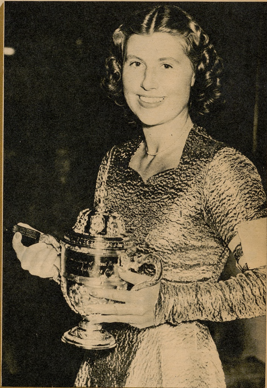
Powyżej: Cecylja Colledge po zdobyciu mistrzostwa Anglii.