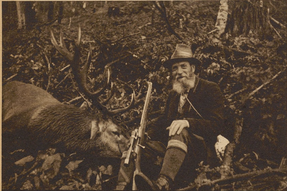
Przy wspaniałem trofeum myśliwskim.