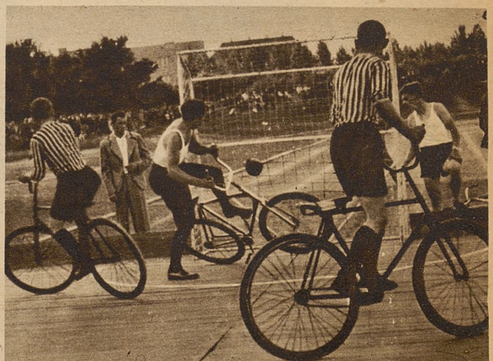
Fragment meczu piłki rowerowej między K. C. Siemianowice (mistrz Polski) S.C. Grudziądz (mistrz Pomorza)