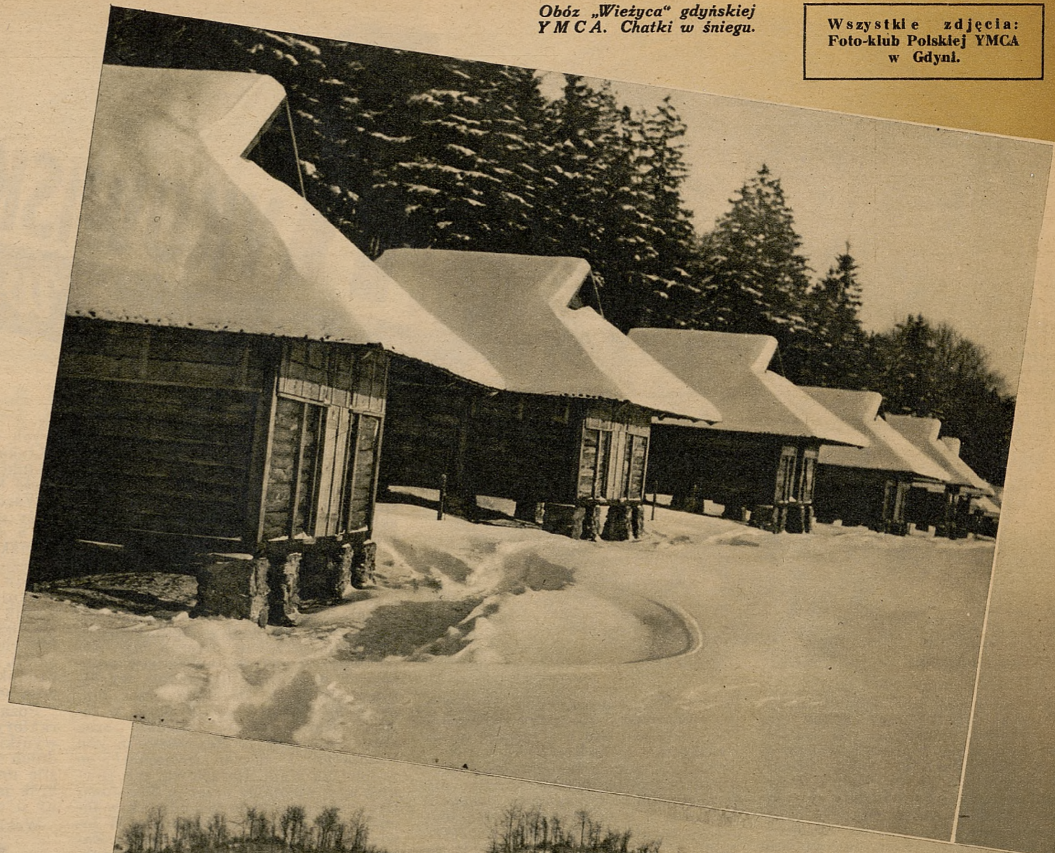
Obóz „ Wieżyca ” gdyńskiej YMCA. Chatki w śniegu.