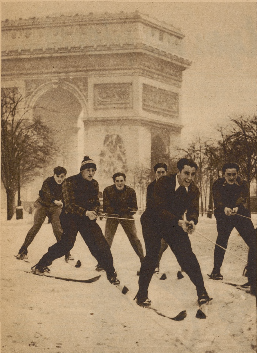
Powyżej: świeży śnieg, umożliwia ski-joering nawet na alei Focha w Paryżu.