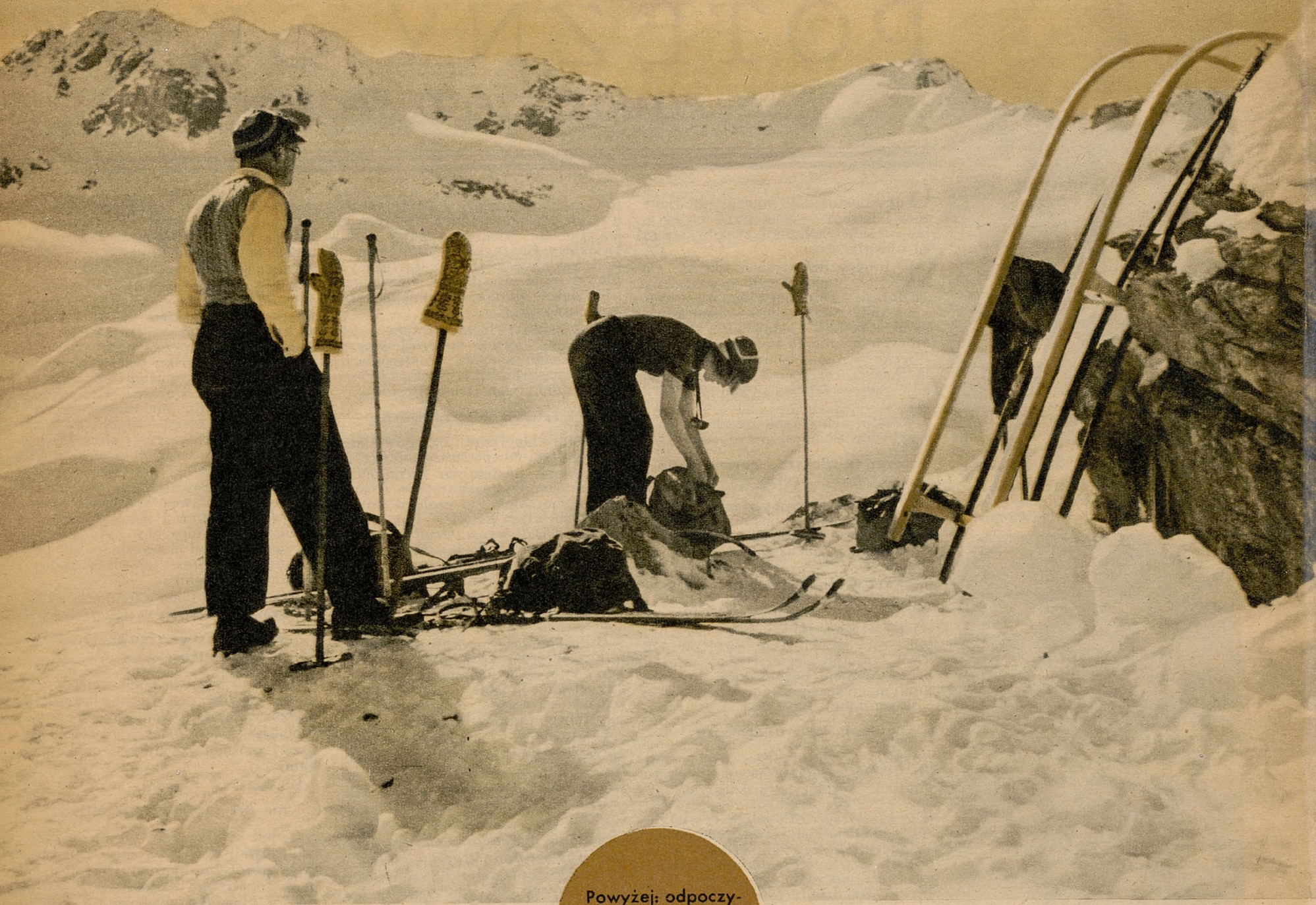
Powyżej: odpoczynek na Weissfluhjoch w Alpach w pobliżu Davos.