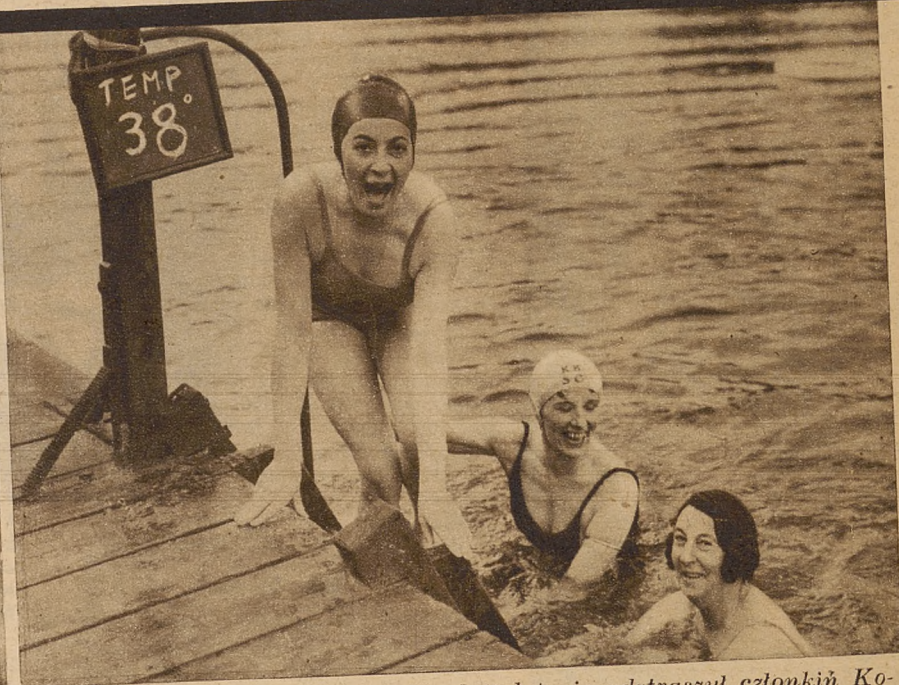
Najzimniejszy dzień w Londynie od 10 lat nie odstraszył członkiń Kobiecego Klubu Pływackiego od kąpieli, mimo, że temperatura wody wynosiła zaledwie 3 stopnie Celsjusza (38 st. Fahrenheita).

Inaczej urozmaicili sobie święta członkinie Kobiecego Klubu Pływackiego w Londynie. Termometr wskazywał 38 stopni Fahrenheita, które odpowiadają „naszym” 3 stopniom Celsjusza, ciepła wody, wiał ostry północno-wschodni wicher, który zawsze przynosi falę chłodu, a jednak pań nie odstraszyło to wszystko, aby wejść do wody i popływać. Przyznać trzeba, że sam widok dzielnych pływaczek w tej lodowatej kąpieli robi już zimne wrażenie. Cóż dopiero, gdyby tak samemu przyszło zanurzyć się w wodzie! Ale Angielki są zahartowane i, jak wskazuje na to zdjęcie, są zadowolone. Tak więc święta tegoroczne minęły naprawdę pod znakiem sportu, jak rzadko po inne lata.