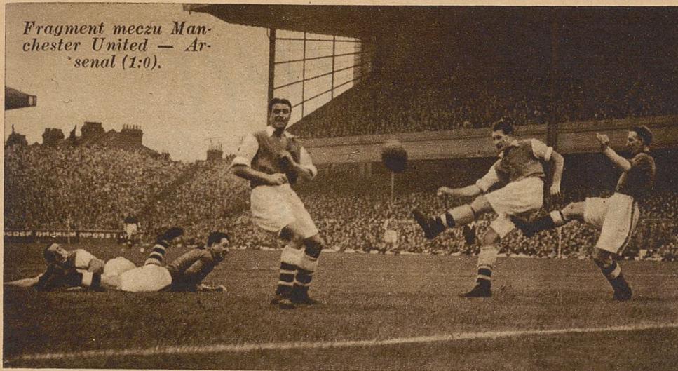
Fragment meczu Manchester United — Arsenal (1:0).