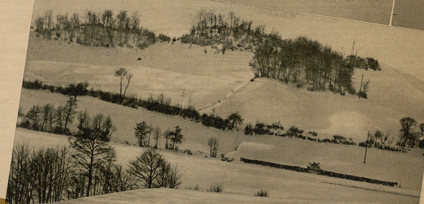
Wzgórza nad jeziorami Szwajcarii Kaszubskiej. Jastrzębia Góra (233 m n. p. m.)