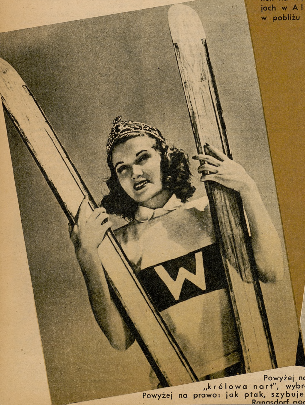
Powyżej na lewo: „królowa nart”, wybrana w Waszyngtonie. Powyżej na prawo: jak ptak, szybuje „użaglony” łyżwiarz na jeziorze Ransdorf pod Berlinem.