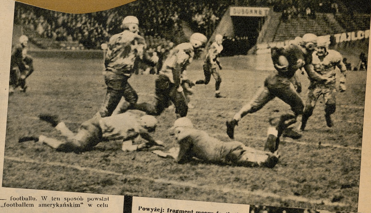
Powyżej: fragment meczu footballu amerykańskiego, rozegranego przez dwie drużyny amerykańskie w Paryżu, celem zademonstrowania tego sportu w stolicy Francji.

Football amerykański dopiero wówczas jest ciekawy, gdy widz zna doskonale przepisy tej gry. Miejscami bowiem publiczność francuska nie orjentowała się, kto ma piłkę? (Dokończenie na str. 14)