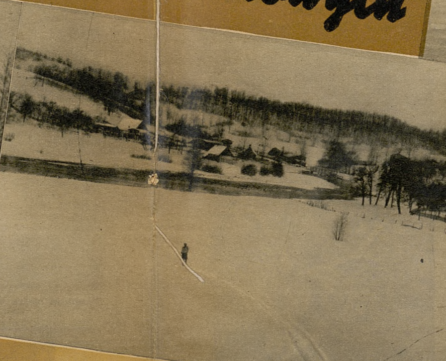
Wieś Brodnica Dolna nad jeziorami źródłami Raduni.