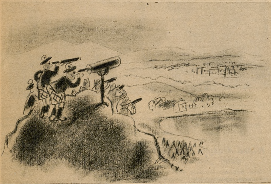
Powyżej: obserwowali zawody piłkarskie...