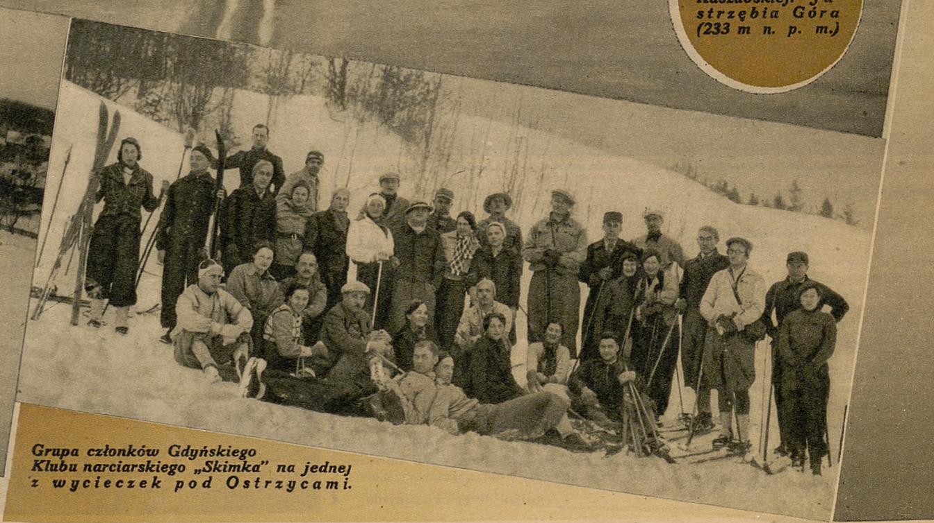
Grupa członków Gdyńskiego Klubu narciarskiego „ Skimka ” na jednej z wycieczek pod Ostrzycami .