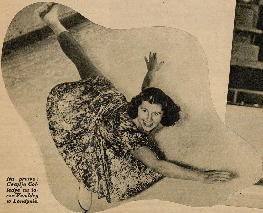
Na prawo: Cecylja Colledge na torze Wembley w Londynie.