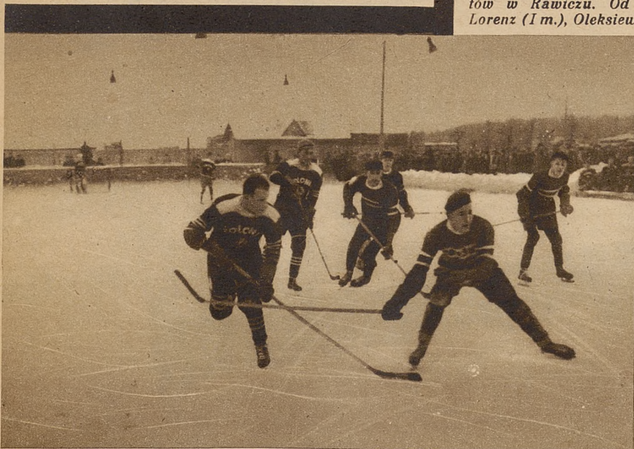
Fragment meczu hokejowego Polonia (Warszawa) — Reprezentacja Łodzi. Pod bramką Polonii.