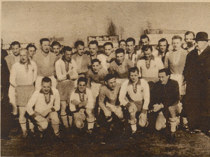
Reprezentacje piłkarskie Poznania i Pomorza przed spotkaniem, zakończonym zwycięstwem Pomorza 4:3.