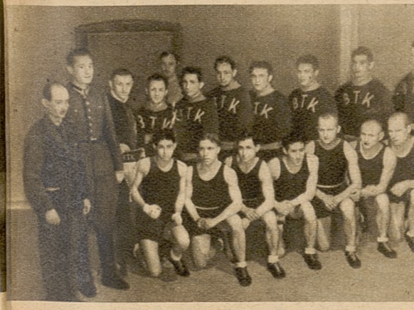
Drużyny bokserskie B. T. K. Budapeszt i W. K. S., Równe przed meczem rozegranym w Równem, a zakończonym zwycięstwem Węgrów 11:3.