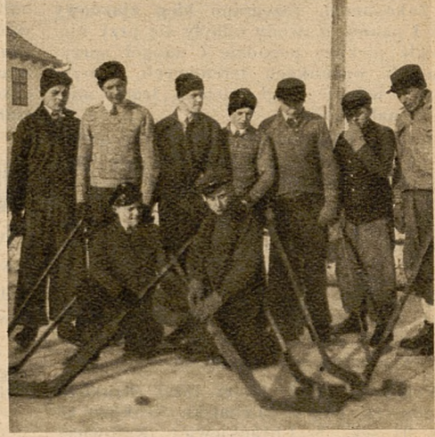
Drużyna hokejowa Szkolnego Klubu Sportowego „Przyszłość” w Hajnowce, która usilnie propaguje hokej na lodzie na Kresach wschodnich.