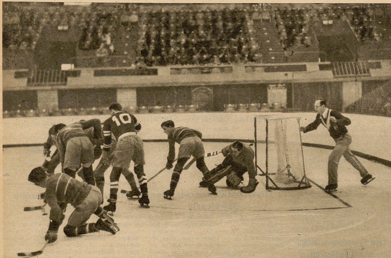
Tłok pod bramką francuską na meczu z Polską. Tego rodzaju momentów było wiele wobec przewagi naszych hokeistów.