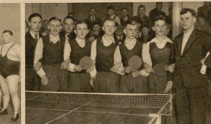
Drużyna ping-pongowa szkoły zawodowej z Rybnika, która na zawodach o mistrzostwo Chorzowa zajęła pierwsze miejsce, zdobywając tytuł mistrza.