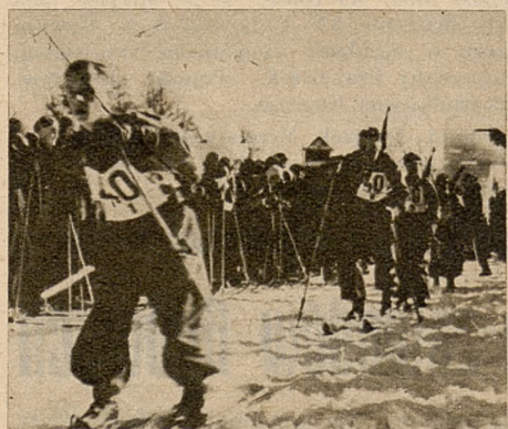
Patrol Szkoły Podchorążych Piechoty opuszcza start marszu narciarskiego Zułów—Wilno.

Organizatorzy przewidywali, że pierwsze patrole wpadną na metę ok. godz. 11. Nie stało się to ze względu na złe warunki atmosferyczne, gdyż w niedzielę nadeszła silna fala odwilży. Z soboty na niedzielę zmieniły się więc do niepoznania, warunki śnieżne i zamiast suchego śniegu mieliśmy mokry podkład, po którym mu-