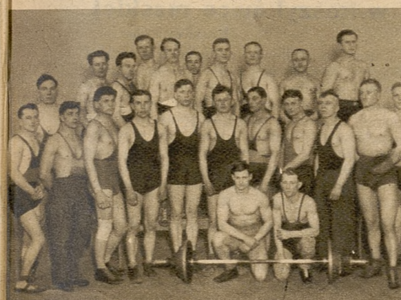
Grupa uczestników zawodów zapasniczych i w podnoszeniu ciężarów, rozegranych w ubiegłym tygodniu o mistrzostwo Śląska w Katowicach.