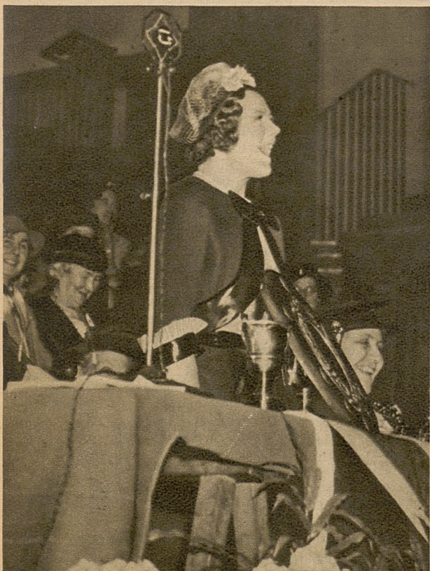
Sonja Henje wygłasza w Hollywood odczyt, transmitowany przez kilka stacji amerykańskich. Tematem odczytu były przeżycia Sonji Henje związane z objęciem roli gwiazdy filmowej.