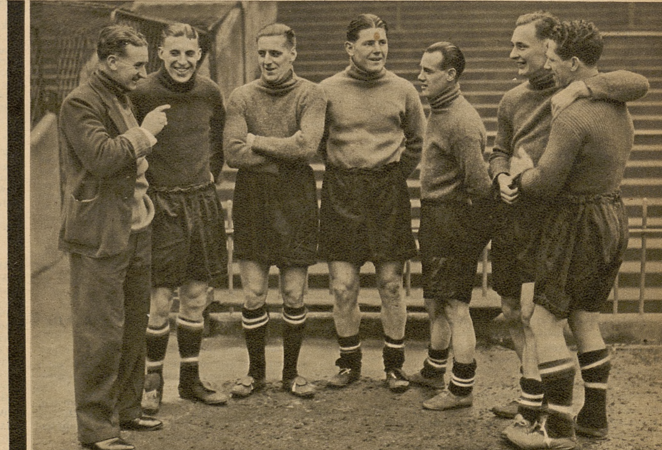
Trener „benjaminka” i Ligi angielskiej Charlton Athletic, która to drużyna potrafiła w ciągu dwóch lat przejść z III Ligi do pierwszej i zająć w niej czołowe miejsce, udziela graczom swego klubu wskazówek przed meczem.