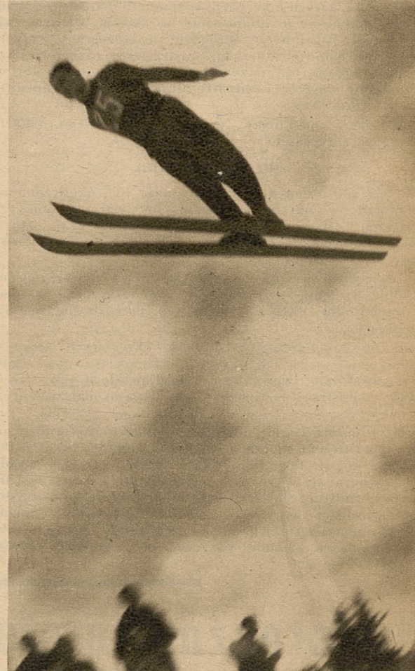
Na prawo: Znany skoczek zakopiański Wisły, Bochenek w skoku podczas pierwszego konkursu świątecznego w Zakopanem