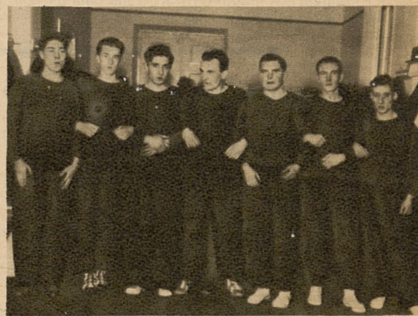
Na prawo: Reprezentacja siatkówki Przemysła.