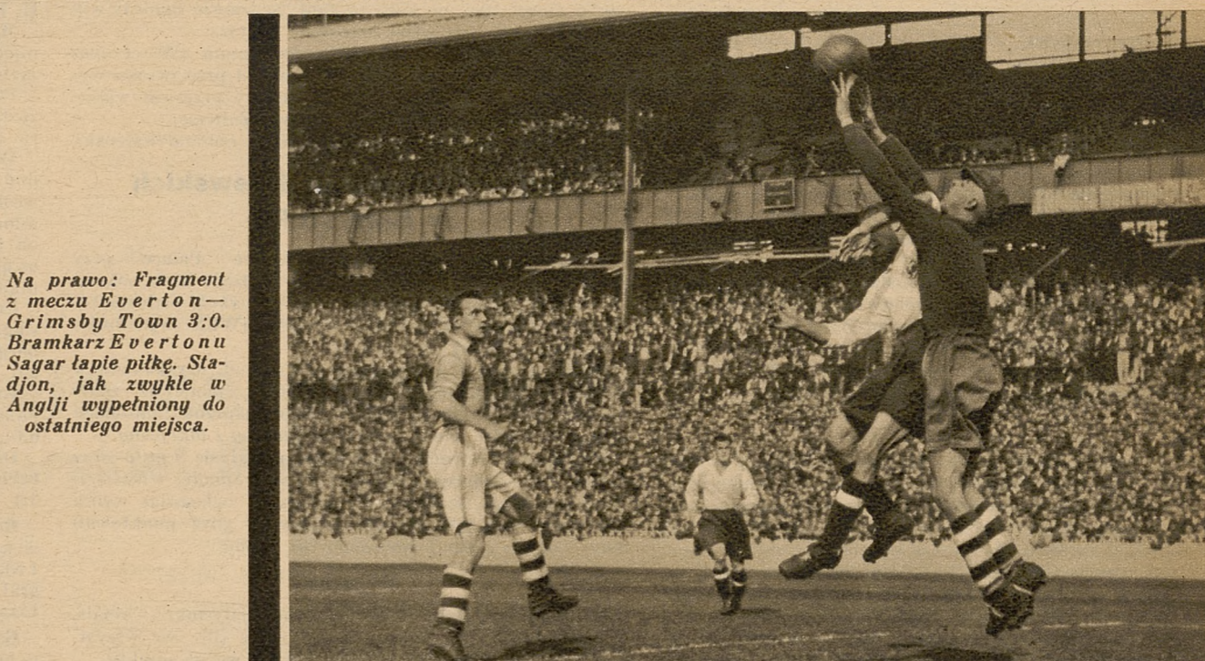
Na prawo: Fragment z meczu Everton—Grimsby Town 3:0. Bramkarz Evertonu Sagar łapie piłkę. Stadjon, jak zwykłe w Anglii wypełniony do ostatniego miejsca.