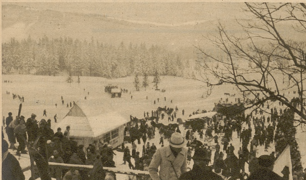
Na lewo: Widok ogólny ruchu publiczności podczas konkursu świątecznego skoków w Zakopanem.