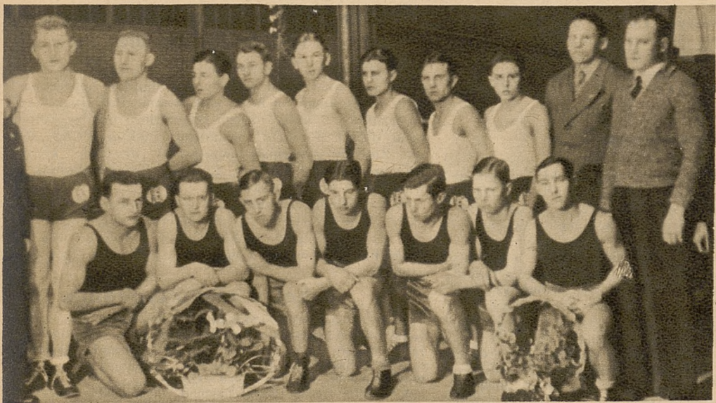
Na lewo: Drużyny bokerskie K. S. Kruščender (Łódź)-Bałtyk (Gdynia) przed meczem rozegranym w Gdyni, a zakończonym zwycięstwem Łodzian 10:6.