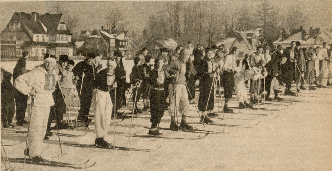
Pierwsza zmiana drużyn uczestniczących w zawodach sztafetowych o mistrzostwo Polski w Zakopanem na starcie.