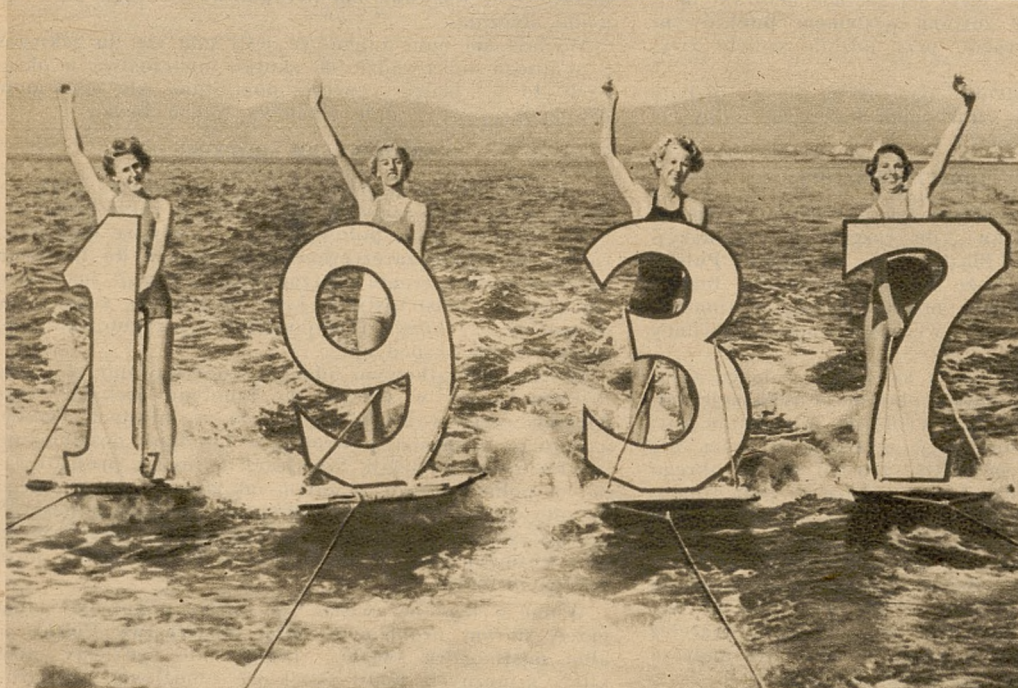
Na lewo: Wesole powitanie Nowego Roku na wodach zatoki Kalifornijskiej.