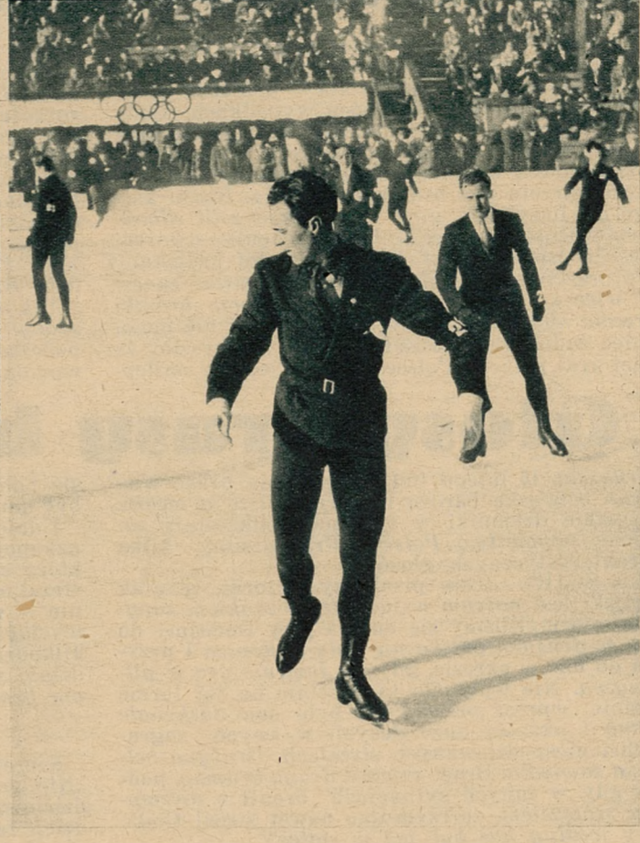
Karol Schäfer, wielokrotny mistrz świata w jeździe figurowej, nie miał i tym razem poważniejszych konkurentów.