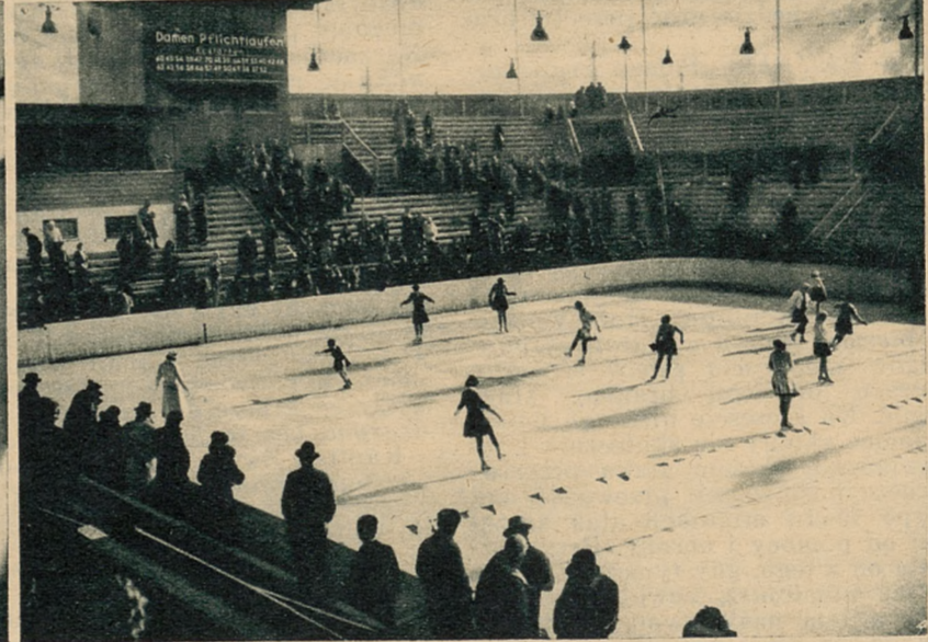
Uczestniczki zawodów w jeździe figurowej na łyżwach odbywają ćwiczenia obowiązkowe.