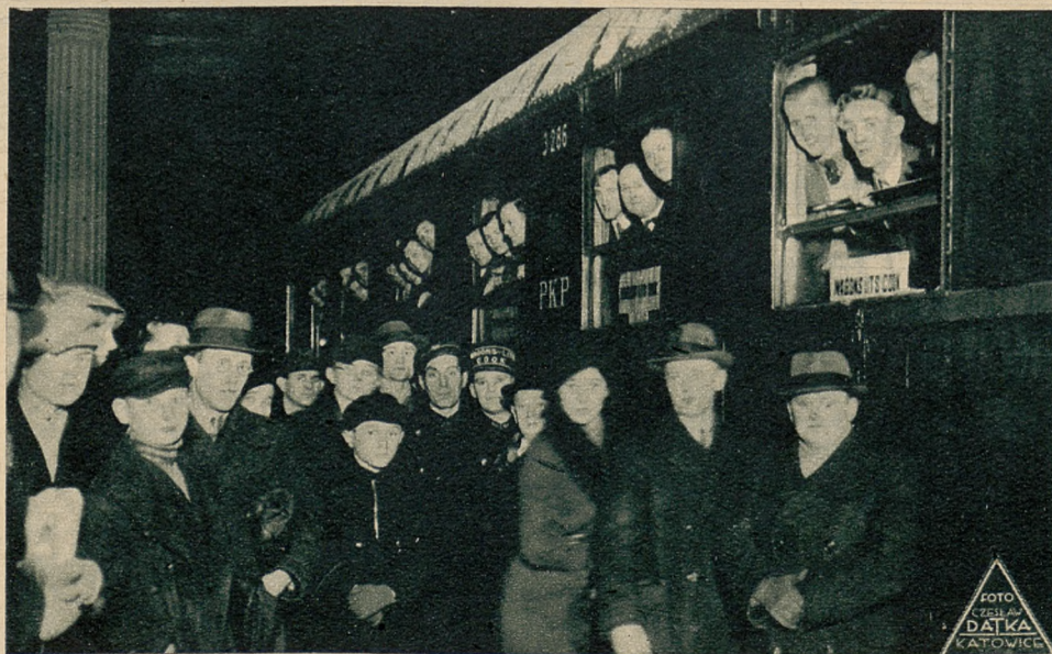
Reprezentacyjna drużyna polskiej piłki nożnej na dworcu w Katowicach przed odjazdem do Brukseli na mecz z Belgią.