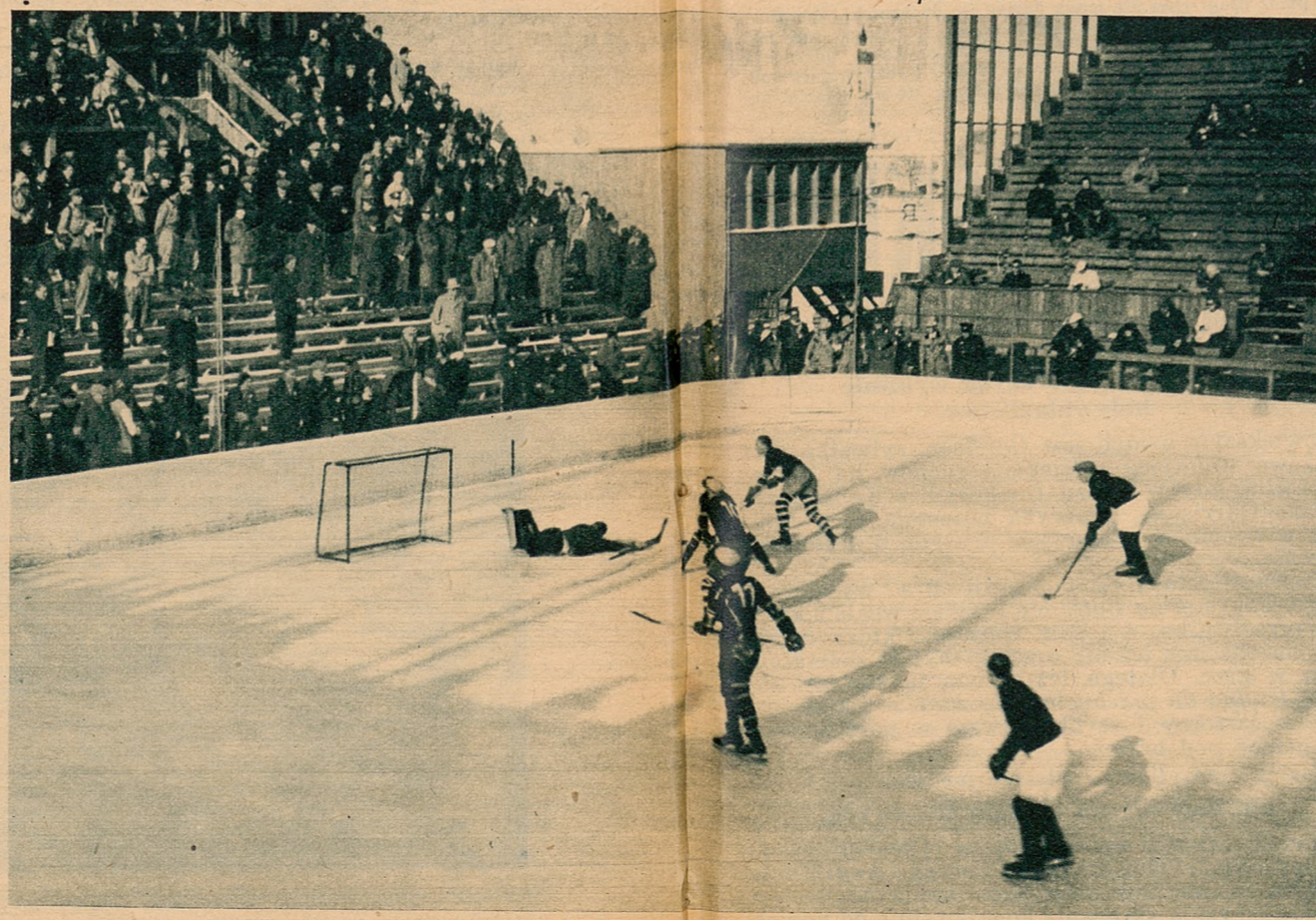
Efektowne zdjęcie z meczu Polska—Lotwa, zakończonego wysokim zwycięstwem Polaków 9:2.