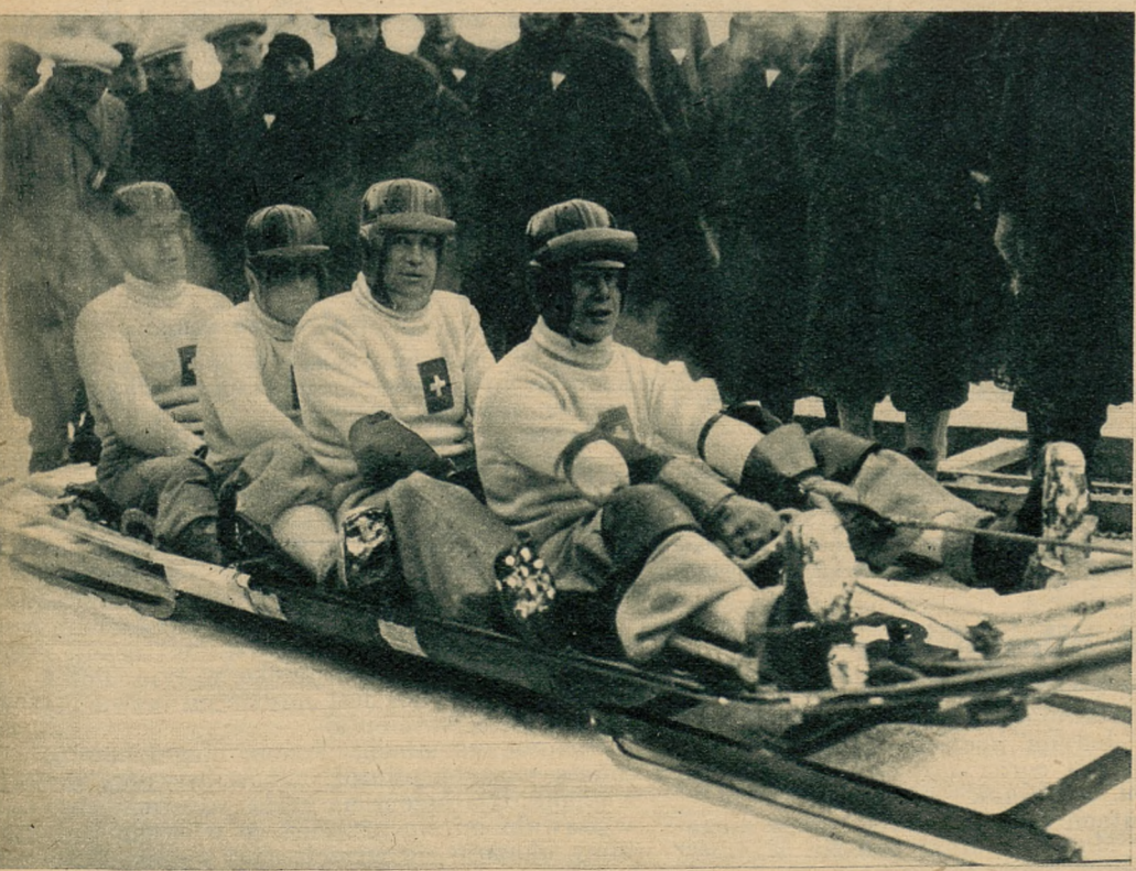
Zwycięska osada bobsleja, Szwajcaria II, która zdobyła pierwsze miejsce w wyścigu czwórek.