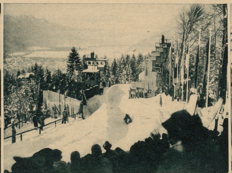
Wyścigi bobslejów, u nas mało popularne, są widowiskiem niezwykle atrakcyjnym i ściągają w Garmisch-Partenkirchen tłumy widzów.