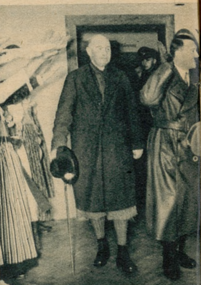
Kanceler: Hitler i prezydent Międzynarodowego Komitetu Olimpijskiego hr. Baillet-Latour przybywają do Partenkirchen.