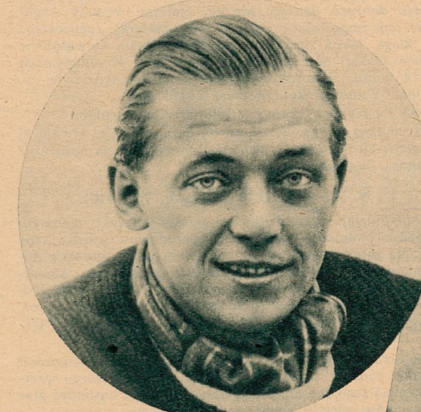
Najlepszy hokeista Niemiec, Gustav Jaenecke, podpora swej drużyny.

Na prawo: Zwycięska bramka Anglii w meczu z Kanadą. Na pierwszym planie uradowany widz, zwolennik Anglii.