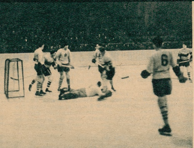
Nocne zdjęcie sensacyjnego meczu Kanada—Anglia, zakończonego zwycięstwem Anglii 2:1.