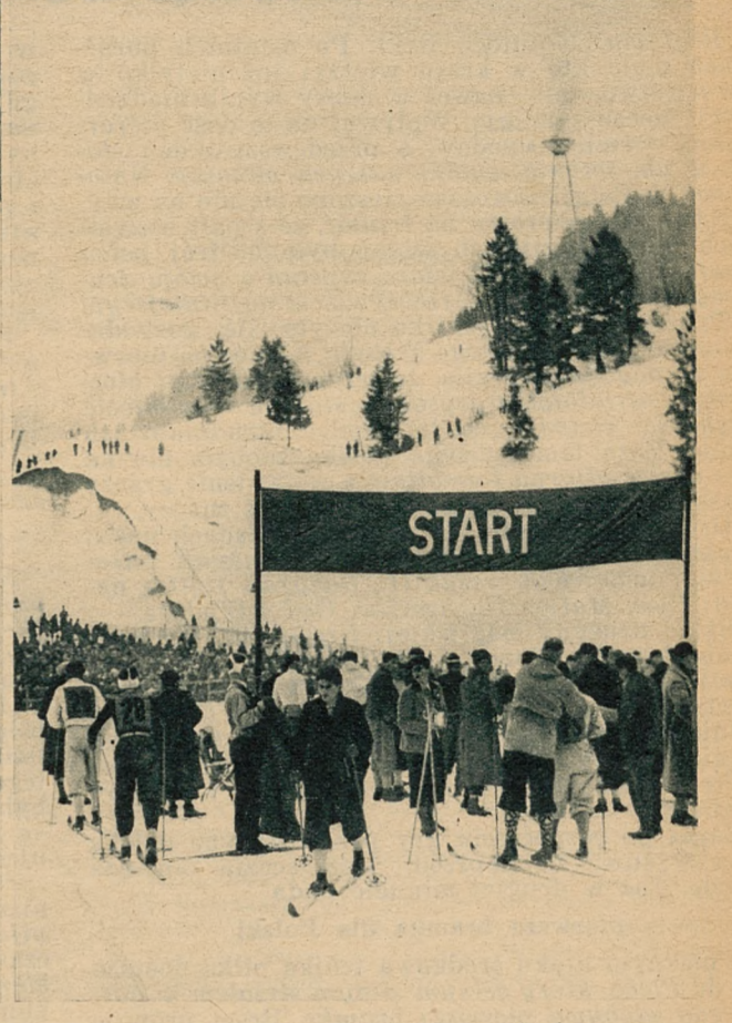
Na starcie biegu narciarskiego na 18 km.