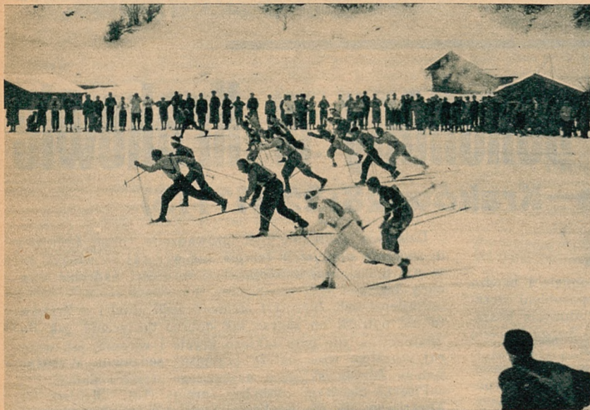
U stóp skoczni na Kochelbergu nastąpił start 16 państw, biorących udział w biegu 4x10 km.