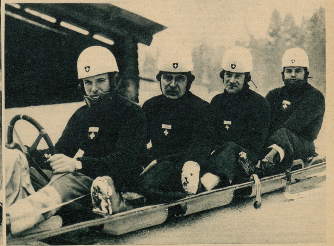
Bobslej Szwajcaria I, który zajął w wyścigu czwórek drugie miejsce, tak, że Szwajcaria zdobyła nie tylko złoty, ale i srebrny medal olimpijski.