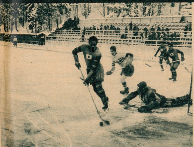
Ciekawy moment pod bramką japońską na meczu hokejowym Anglia—Japonia. Prózne trybuny wskazują, że spotkanie to nie cieszyło się zbyt wielkim zainteresowaniem publiczności.