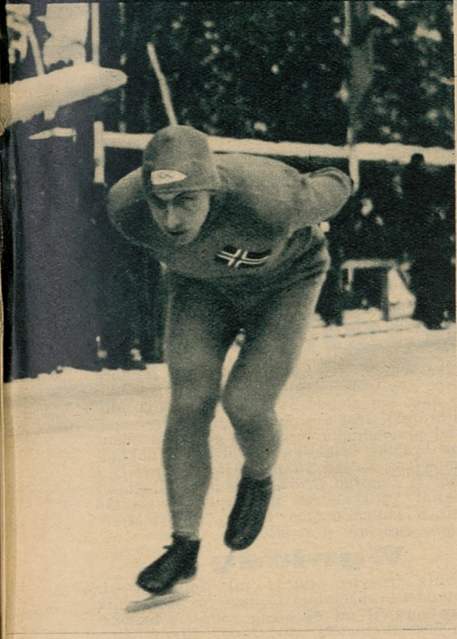
Ivar Ballangrud (Norwegja), zdobywca trzech złotych medali olimpijskich w jeździe szybkiej na łyżwach.