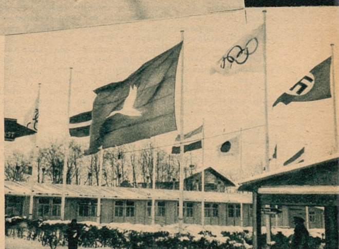
Nad budynkiem prasowym w Garmisch-Partenkirchen powiewa flaga z przystawioną „kaczką dziennikarską”. Na skutek doskonałej organizacji było jednak na szczęście tych „kaczek” bardzo mało.