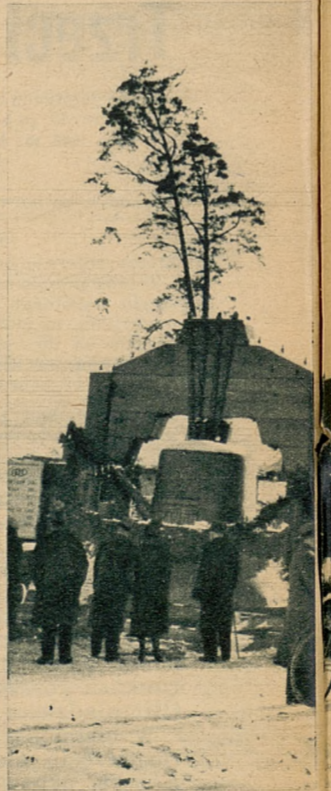
Olbrzymi dzwon olimpijski Garmisch-Partenkirchen, na której zawisł