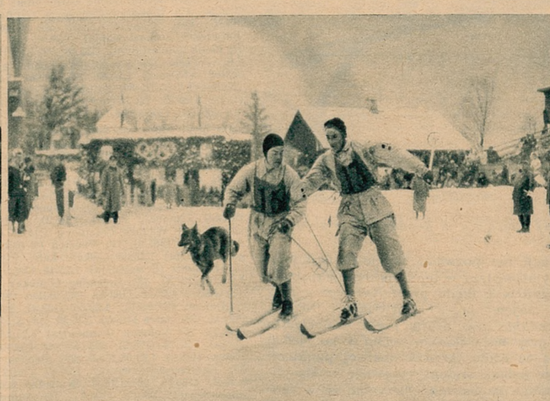
Zmiana sztafety norweskiej, której towarzyszył przez cały czas wierny pies, owczarek. Talizman tym razem jednak nie pomógł.