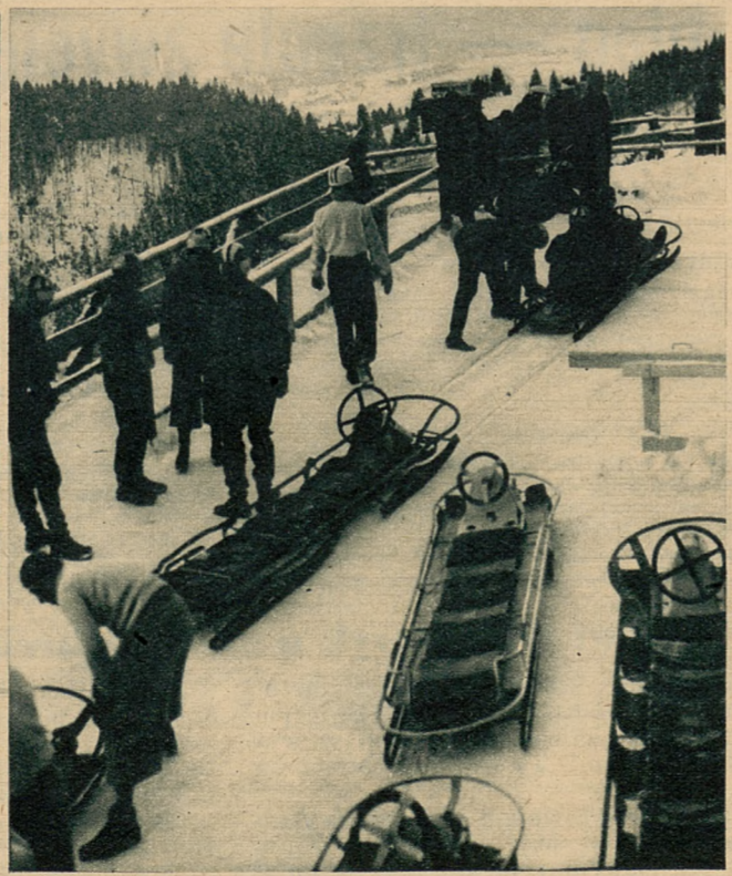
Na torze bobslejowym panował przed rozpoczęciem Igrzysk żywy ruch. Wszystkie drużyny trenowały bardzo pilnie.