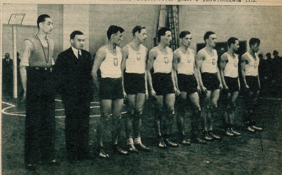
Reprezentacyjna drużyna koszykówki, która pokonała Łódź, w skład jej wchodzi przede wszystkim 5 graczy z KPW Poznań.