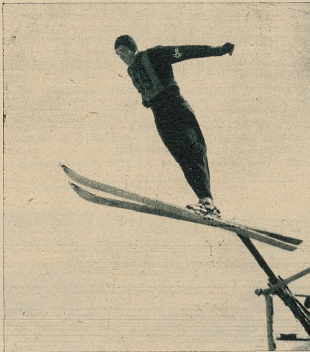
Hagen (Norwegia) zwycięzca w kombinacji w skoku.

Nietylko Larsson przysłużył się przy tej okazji, ale także i Matsbo , który wyszedł na czwarte miejsce, trzeci Szwed Hägglad ma miejsce 8, a ostatni Lindgreen 17. Norwegia musiała zadowolić się miejscami 2, 5, 6 i 9, a Finlandja : 3, 7, 12 i 15.