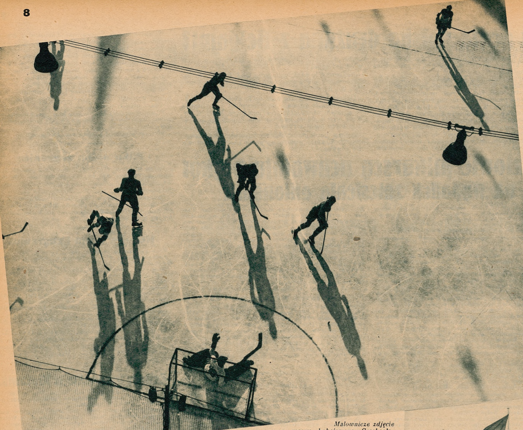
Malownicze zdjęcie z meczu hokejowego Czechosłowacja—Węgry, które demonstruje nam w całej pełni wszystkie walory pięknego, męskiego sportu: szybkość i zmienność sytuacji, ostrą, ale fair walkę.

Za późno dziś dyskutować, czy do półfinałów dostały się te drużyny, które faktycznie są najsilniejsze. Jasnym jest bowiem, że taka dyskusja niczego nie zmienia. Niewątpliwie Szwajcaria, Włochy, a nawet Polska są silniejsze od takich Węgrów, ale co poradzić, skoro los chciał inaczej? A bodaj i Austria czy Czechosłowacja nie są drużynami, które mogłyby się poszczycić bezwzględnie wyższą siłą nad Szwajcarią, czy Włochami. No, ale stało się już. W każdym razie mecze półfinałowe są już przysmakami, który może nawet bardzo zblazowanego entuzjastę sportu wprowadzić