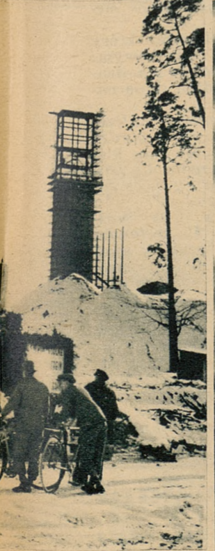
ski przy przywiezieniu do z tyłu widoczna wieża, dzwon olimpijski.