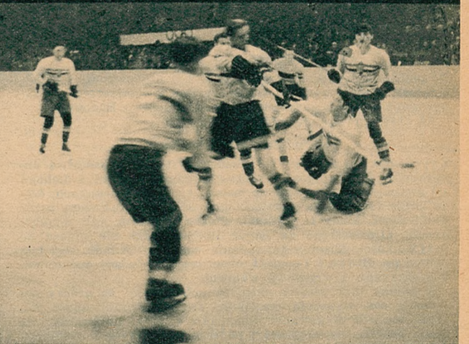
Walka w meczu Niemcy—Węgry (2:1) musiała być, sądząc po powyższym zdjęciu, niezwykle zażarta.