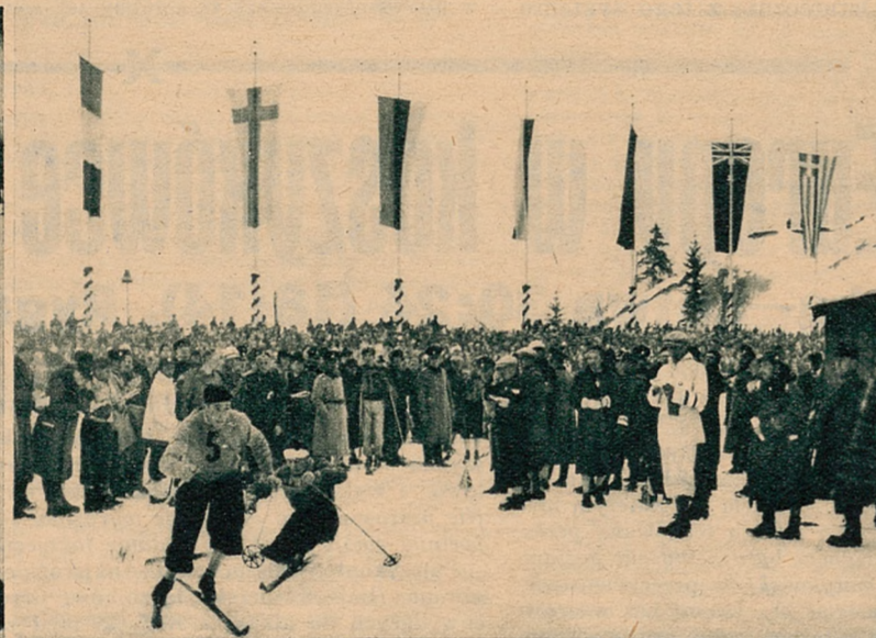
Zmiana sztafety włoskiej, która zajęła pierwsze miejsce po przedstawicielach państw skandynawskich. Przy pierwszej zmianie upadł jeden z zawodników włoskich.