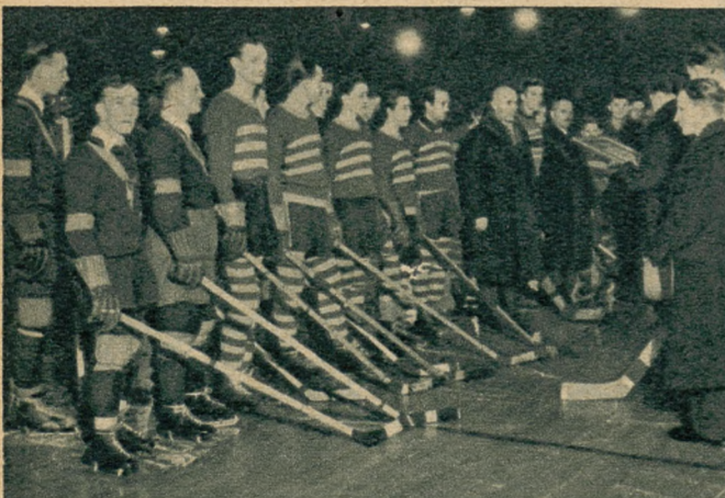
Fragm. z uroczystości jubileuszowych z okazji 5-lecia Śląskiego Klubu Hokejowego na sztucznej lodzie hali w Katowicach, od lewej drużyna Śląskiego Klubu Hokejowego.