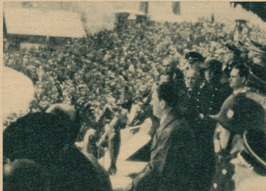
Kancelerz Hitler w czasie przemówienia przy otwarciu Igrzysk Olimpijskich.

Polska dostała się stosunkowo szczęśliwie do grupy pierwszej razem z Kanadą i Austrią oraz Lotwą. Do drugiej grupy weszły: Szwajcarka, Włochy, Niemcy i USA, do trzeciej Czechosłowacja, Węgry, Francja i Belgia, do czwartej wreszcie Anglia, Szwecja i Japonia. Z każdej