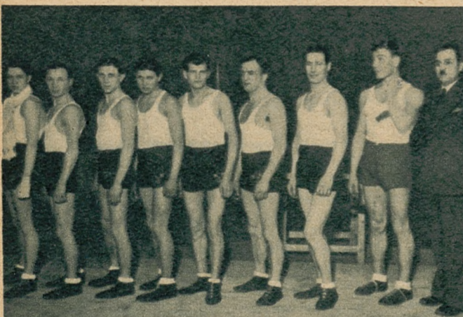
Członkowie zespołu Kaliska, Koszowski Klub Sportowy, który zwyciężył w Łodzi, ulegając Hakoahowi w stosunku 1:5.