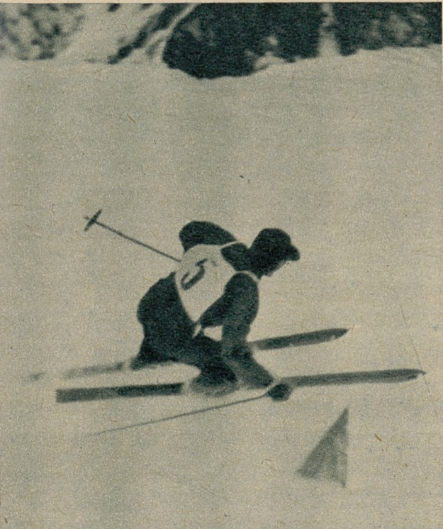
Zwycięzca w kombinacji alpejskiej Pfnür (Niemcy) przybywa do mety w biegu zjazdowym.

Oficjalne wyniki slalomu panów przedstawiają się nast.: 1) Franz Pfnür (Niemcy) w czasie