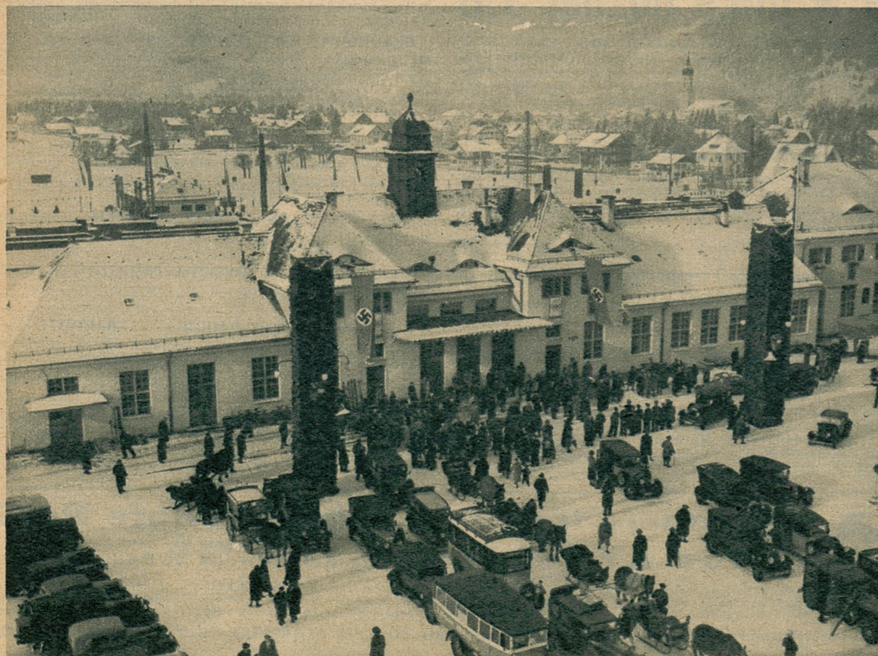
Widok na dworzec w Garmisch-Partenkirchen w dniu poprzedzającym otwarcie Igrzysk.