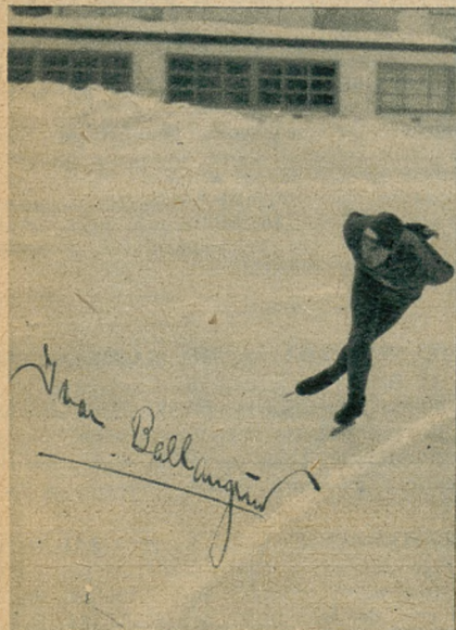
Inar Ballangrund (Norwegia) mistrz łyżwiarski świata.