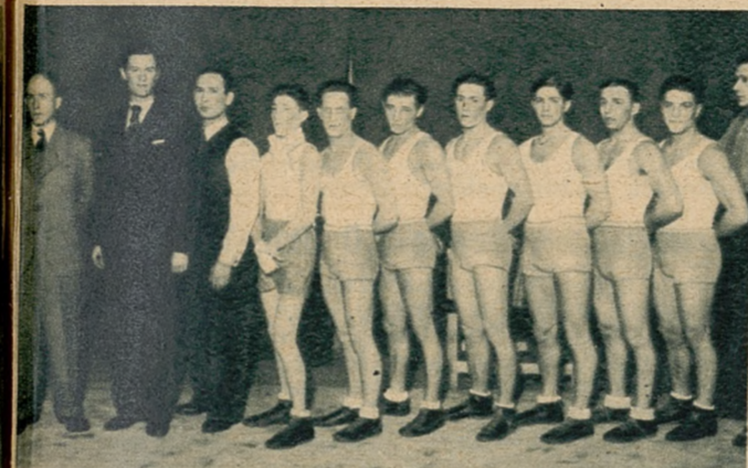
Wybierający się na czoło drużyn żydowskich bokerskich w Polsce zespół Hakoahu łódzkiego, który pokonał Kaliska Klub Sportowy w Łodzi.