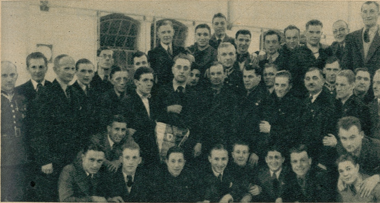
Reprezentacyjne drużyny bokserskie Torunia i Bukaresztu przed meczem zakończonym zwycięstwem Rumunów 10:6.