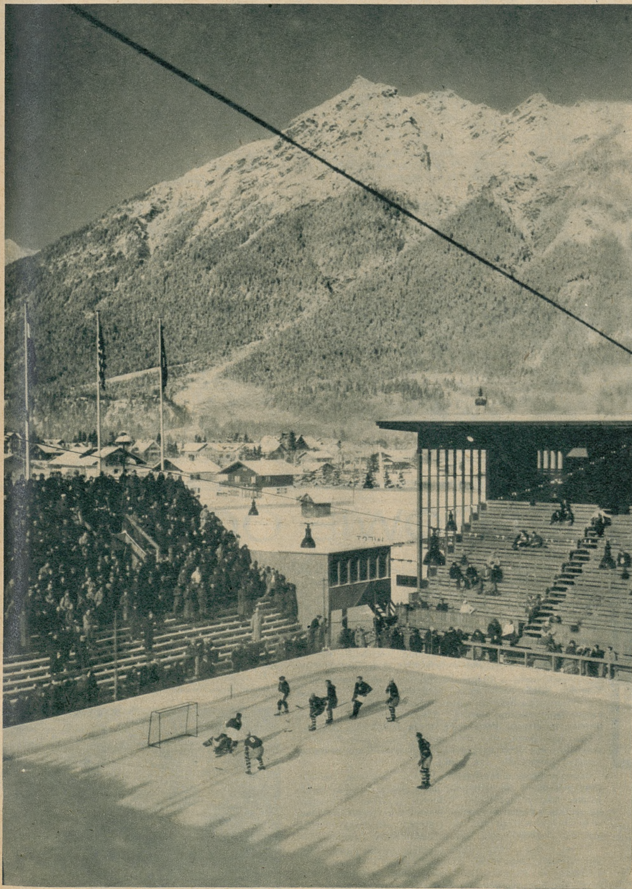
Fragment z meczu hokejowego Polska—Lotwa 9:2. Widok ogólny na stadion.

Polska, jak wiadomo, zakończyła swą rolę w turnieju. Ma być rozegrany turniej pocieszenia przy udziale tych drużyn, które odpadły, ale pertraktacje nie są jeszcze zakończone . Są propozycje, ażeby turniej ten rozegrać w Monachjum, gdzie napewno miałby większe powodzenie, niż w Garmisch-Partenkirchen. Tu bowiem, wobec rozgrywek finałowych i popisów lyżwiarskich, musiałby zostać rozegrany na Riessersee, gdzie niewątpliwie niktyby nie przyszedł. Gdyby pertraktacje te nie doszły do pomyślnego zakończenia, to nasza drużyna nie wyjedzie z Garmisch-Partenkirchen przed zakończeniem Igrzysk, ponieważ ma już z góry zapłacony pobyt do końca Olimpiady.