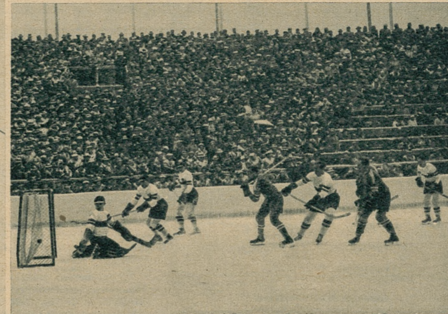
Fragment z meczu hokejowego Stany Zjednoczone—Niemcy 1:0, zdobycie jedynej bramki przez Amerykanów.

własny koszt, a przy wyjeździe na Olimpiadę nie muszą się kłopotać brakiem kilku złotych. Są przeważnie bardzo elegancko ubrane, posiadają doskonały ekwipunek, no i jadą na trening i zawody tak umalowane, jak na bal.