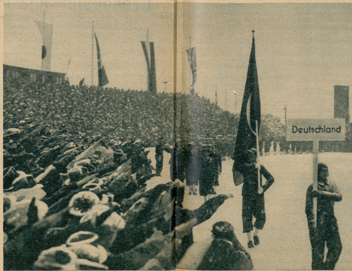
Fragment z defilady reprezentantów 28 państw, drużyna niemiecka przemaszerowuje przed widownią.