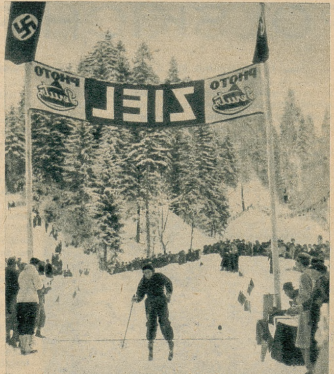
Christl Cranz przybywa do mety, jako zwyciężczyni w slalomie.

Do rozgrywek międzygrupowych zakwalifikowały się ostatecznie: Kanada, Austrja, Niemcy, Ameryka, Czechosłowacja, Węgry, Anglja i Szwecja .