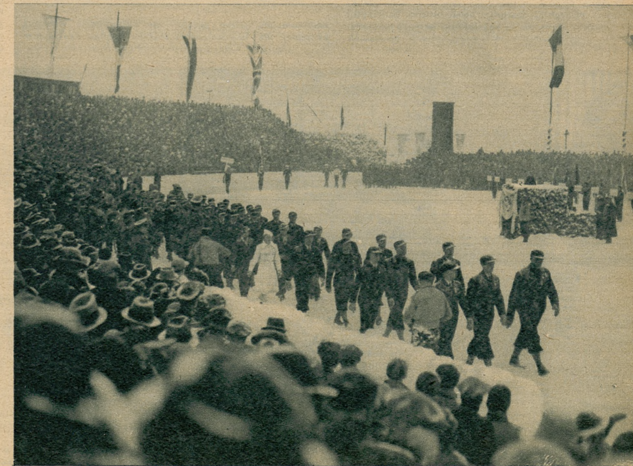
Widok drużyny norweskiej, wkraczającej na stadion w Garmisch-Partenkirchen, w białym kostiumie widoczna Sonja Henie.