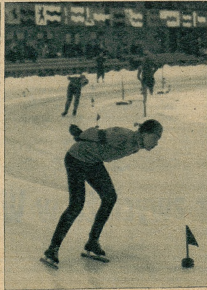
Wicemistrz świata w jeździe szybkiej na lodzie Wasenius (Finlandia).