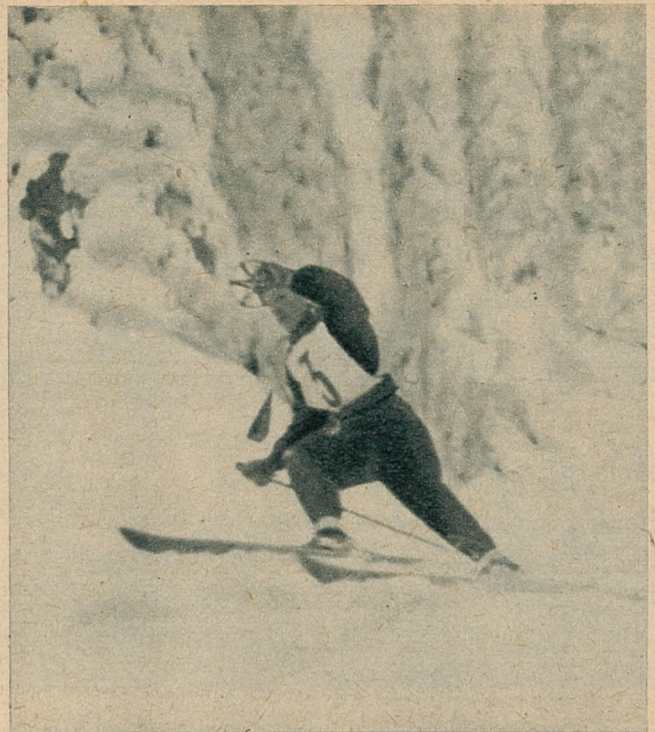
Zwycięzca biegu zjazdowego Norweg Birger Ruud na trasie.

Mecz rozegrano na Riessersee, przy bardzo nieznacznym udziale publiczności. Austriacy prze-