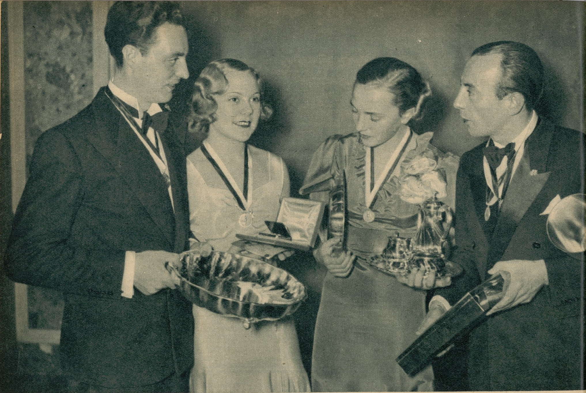
Powyżej: mistrzowie Europy w jeździe figurowej w chwili rozdania nagród. Od lewej: Karol Schäfer, Sonja Henie, Maxie Herber i Ernest Baier. — Poniżej: łyżwiarze podczas treningu na wielkim torze w Davos.