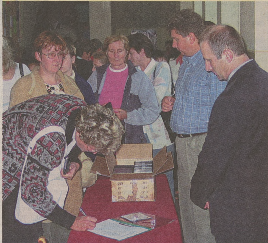
Rodzice to bardzo ważne ogniwo w systemie oświaty. Ci z Hażlach (na zdjęciu) od lat ściśle współpracują ze swoją szkołą.

Opinie na temat zmian w szkolnictwie systematycznie gromadzi na przykład po-