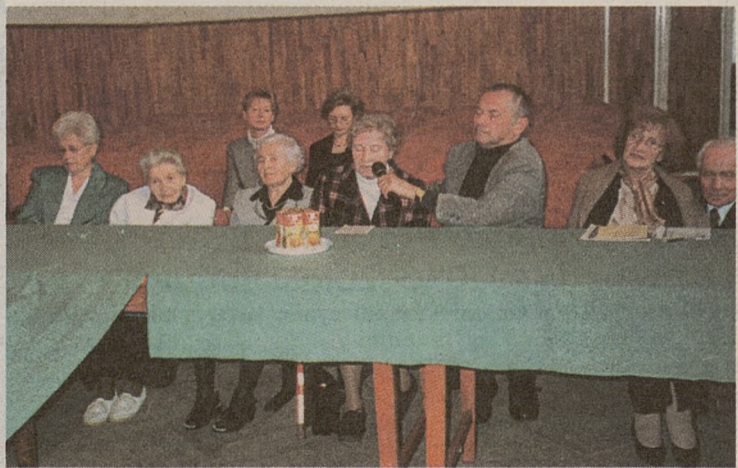
Spotkanie Nauczycieli Tajnego Nauczania tuż po uroczystości 65-lecia TON

Wróćmy pamięcią do tamtych lat. Organizatorem tajnego nauczania był Związek Nauczycielstwa Polskiego.