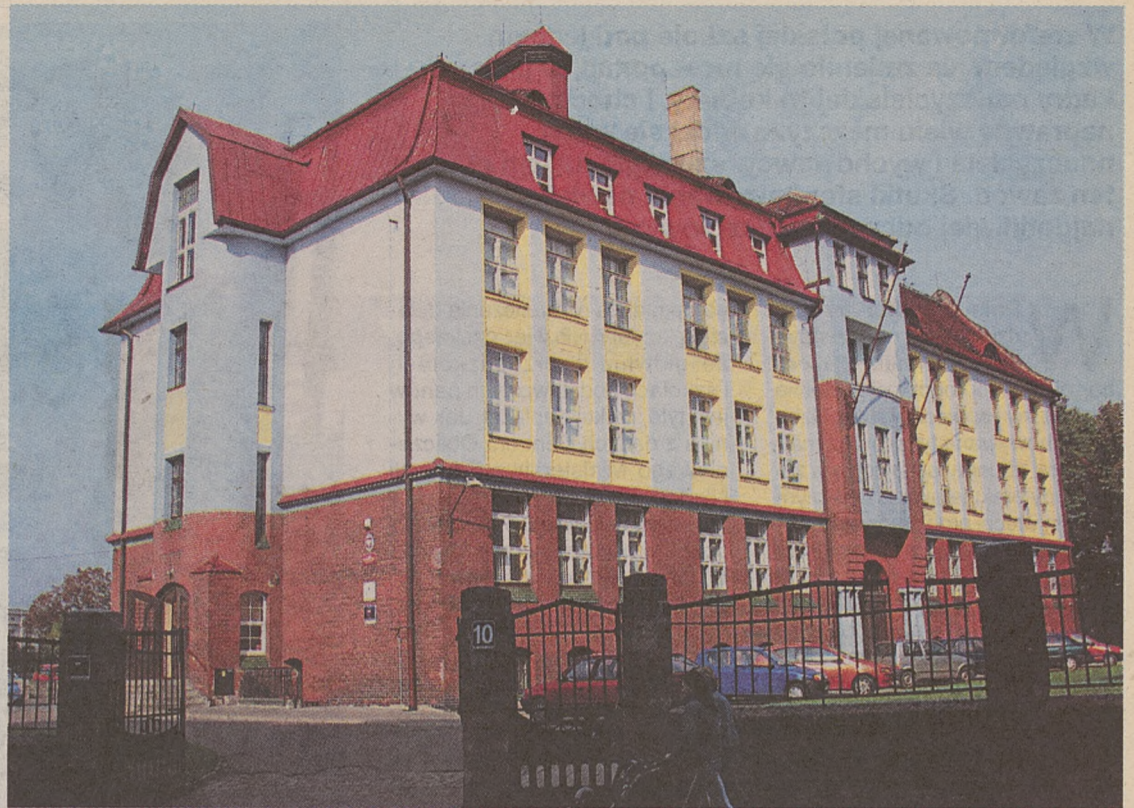
II LO w Grudziądzu. Co tak naprawdę działo się za jego murami przez ostatni rok?

– Wpadła w awanturę, że nie policzyłam jej godzin nadliczbowych