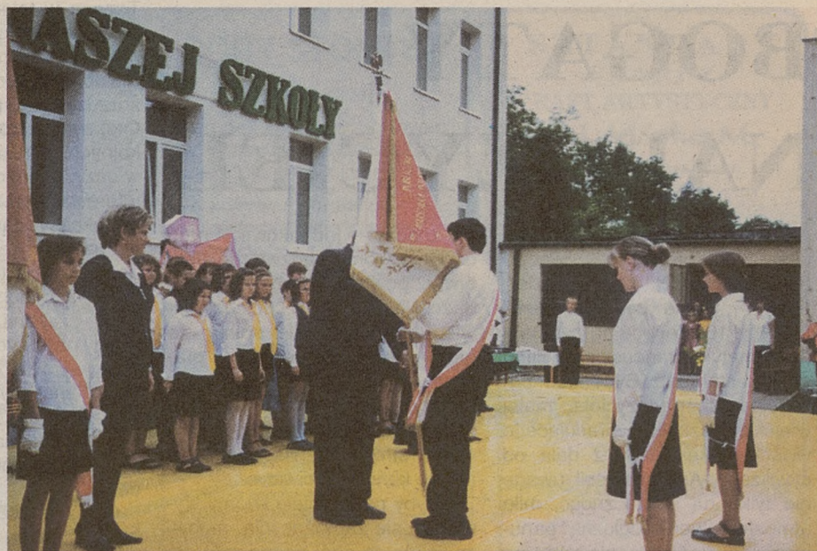
Dyrektor szkoły wręcza sztandar społeczności uczniowskiej

W celu rozpropagowania naszej uroczystości i historii szkoły zaproponowaliśmy innym placówkom z terenu gminy i powiatu udział w konkursach: „Jak nas widzą, tak nas piszą” i konkursie plastycznym prezentującym bohatera szkoły. Rozstrzygnięcie konkursu odbyło się na imprezie finałowej. Laureaci otrzymali cenne nagrody. Sen z powiek spędzał wszystkim problem finansowy — jednak i temu zaradziliśmy. Rada Rodziców wraz z Radą Pedagogiczną ruszyła na kwestę, docierając do każdego domu w obwodzie naszej szkoły. Pieniądze już były. Przyszedł czas na zamówienie sztandaru. Sztandar przedwojenny z emblematem Matki Boskiej Ostrobramskiej „jakimś cudem” zachował się do dzisiaj. Nikt nie zna jego dziejów, kto go przechował przez zawieruchę wojenną i późniejsze niedobre dla takich symboli czasy. Zapewne dzięki naszemu mądrym poprzednikom możemy go podziwiać, gdyż jest bardzo ładny i w dobrym stanie. Będzie nam towarzyszył tylko w najbardziej uroczystych chwilach. Nowy sztandar zajmie jego miejsce podczas uroczystości szkolnych. Udało się wykonać