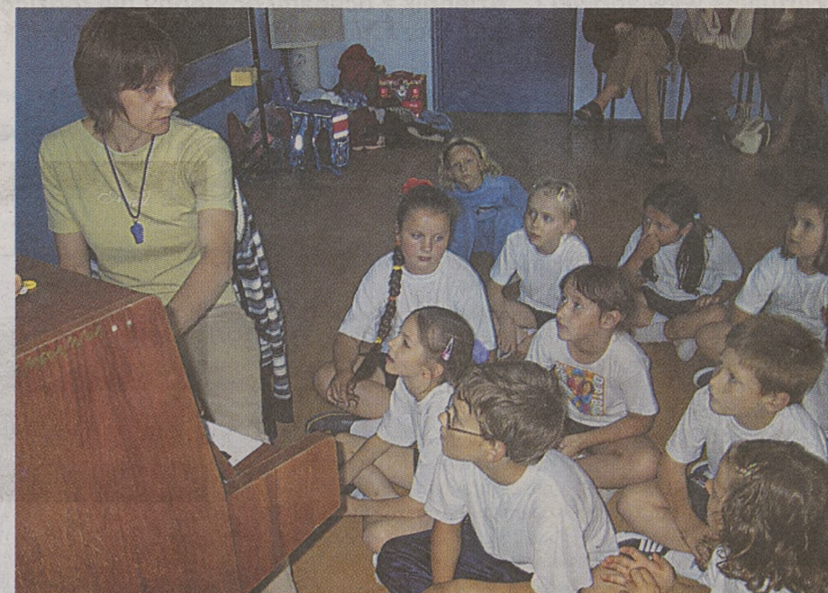
Lekcja rytmiki w Szkole Podstawowej nr 5 w Malborku

Za to wszystko uczniowie kochają „piątkę”, czują się tu świetnie. Zwłaszcza że z niedosłuchem i niedowidzeniem. – Ilekroć obserwuję, jak stukają brajlem na maszynach, ilekroć te niedosłyszające uśmiechają się, jestem szczęśliwa – mówi wzruszona dyrektorka. Dlatego realizuje program „Szkoła otwartych serc”. Bo nieważne, jakie dziecko ma IQ, ważne, czy będzie dobrym czło-