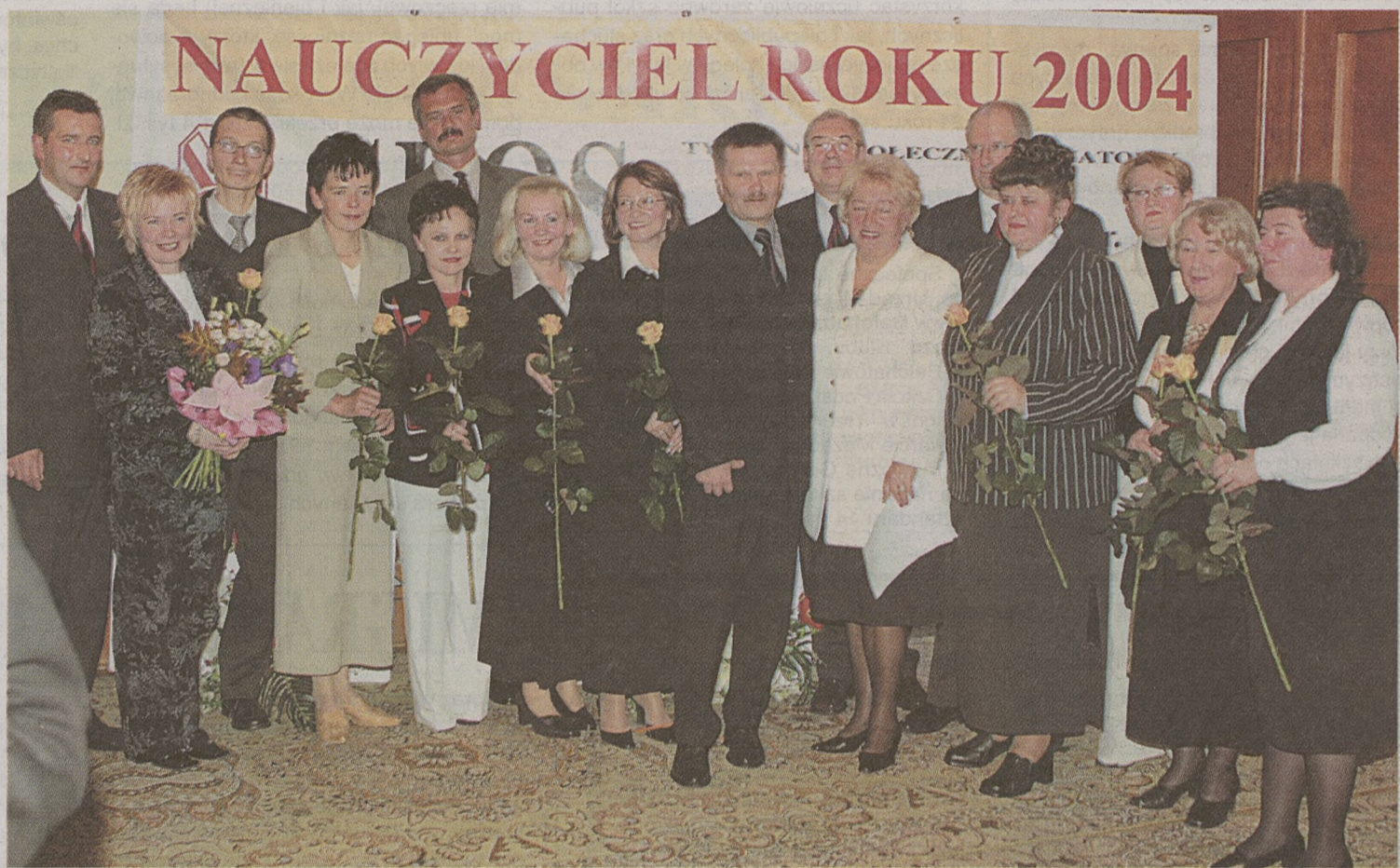
Najlepsi z najlepszych w trzeciej edycji konkursu „Głos Nauczycielski” i Ministerstwa Edukacji Narodowej i Sportu. A wraz z nimi laureaci dwóch poprzednich konkursów.