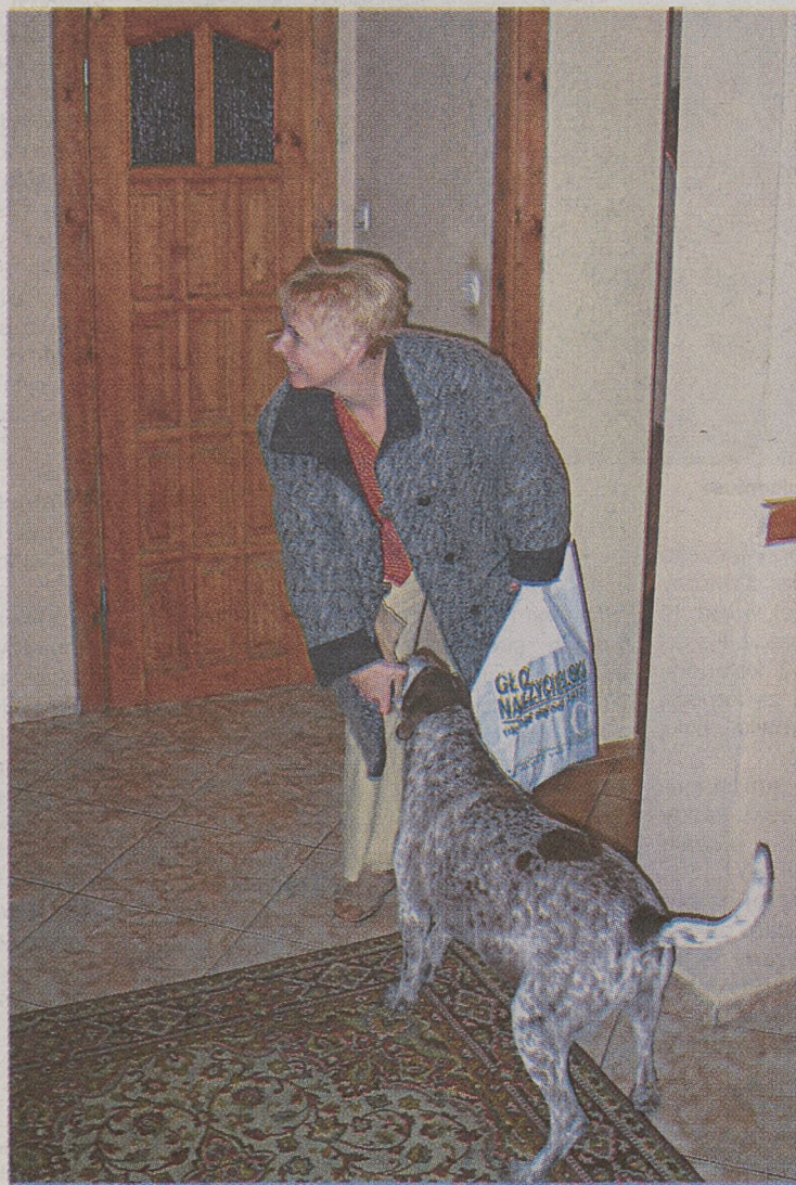
W młodości marzyła o pracy ze zwierzętami