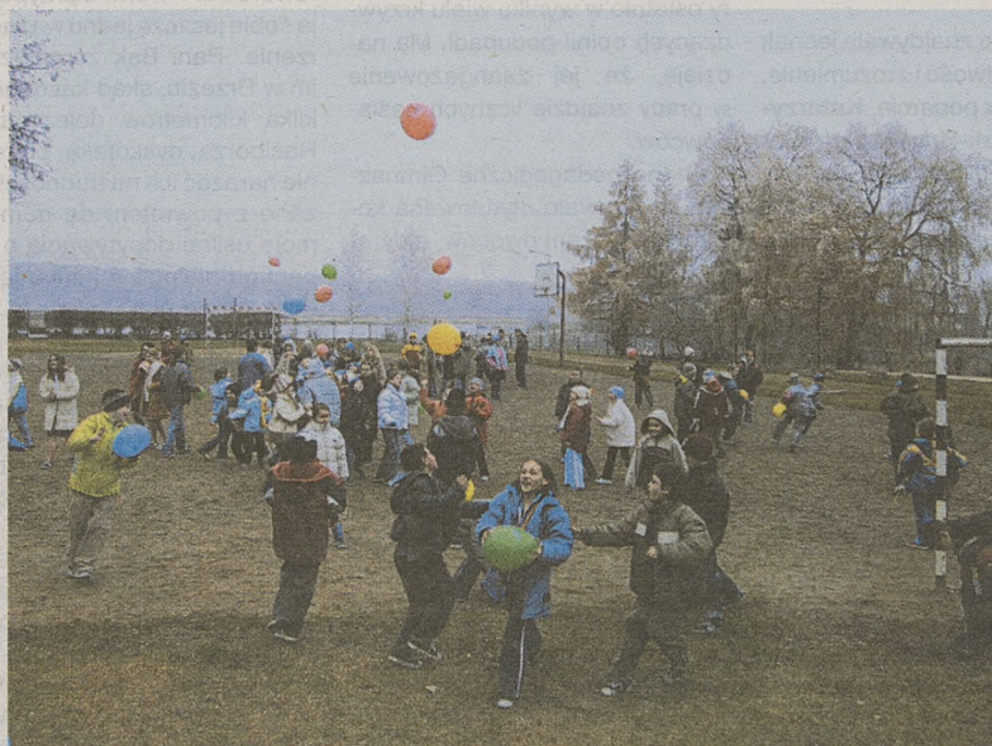
Święto balonów — w tygodniu Comeniusa