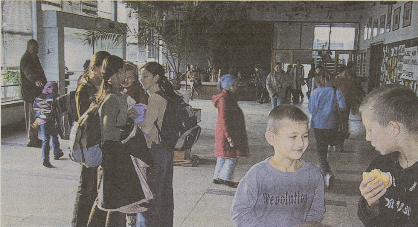
Przez kilka miesięcy nauczyciele cierpliwie czekali na uczniów