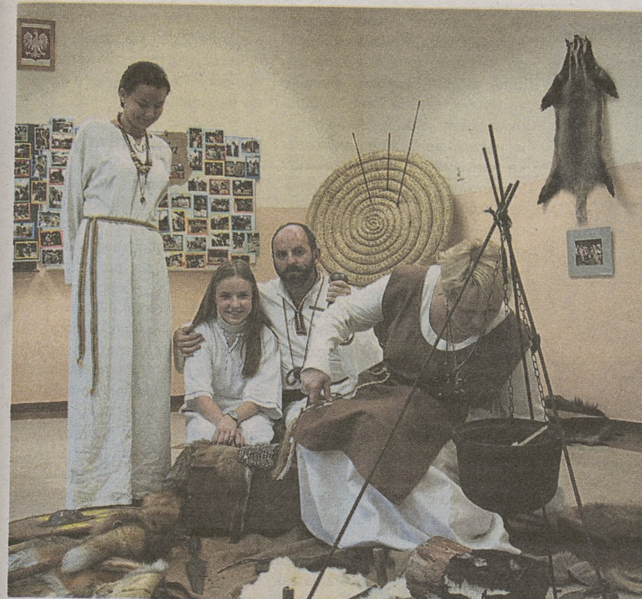
Grzybowianie w pełnej krasie