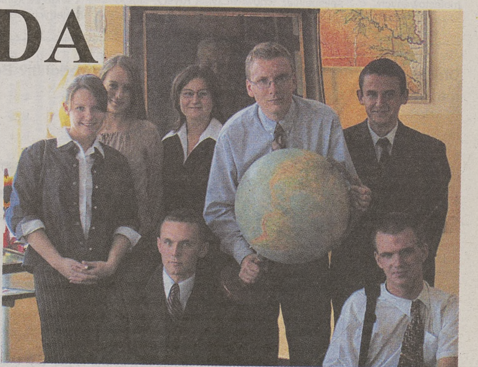
czek, nauczycielka historii i kronikarz dziejów placówki.

Czy młodszych klas nie łączy już taka więź jak ich starszych kolegów? Prawdę mówiąc, chodzi o co innego – przecież ci