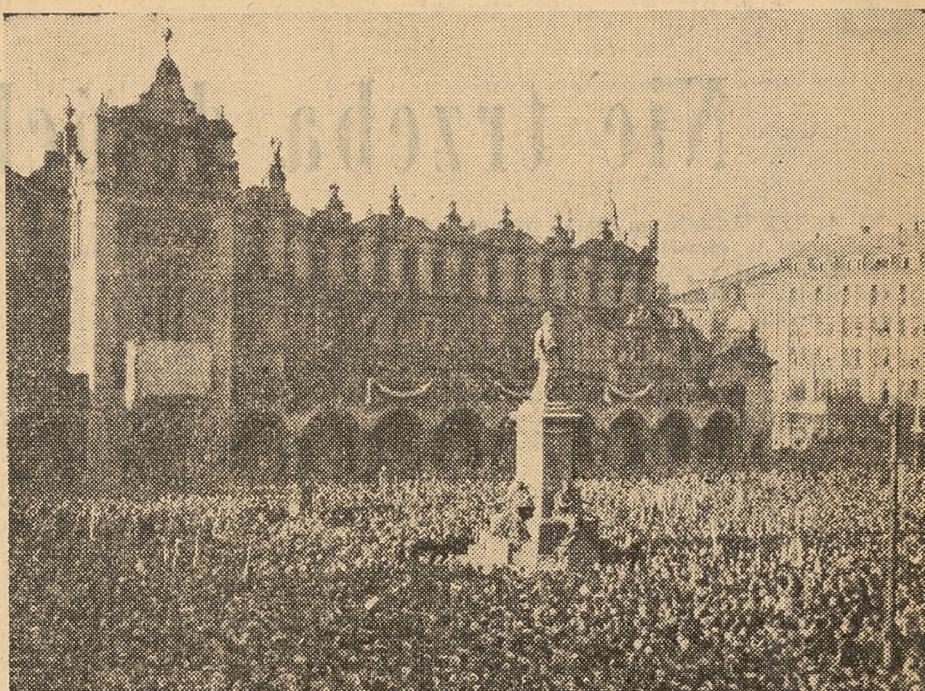
Odsłonięcie odbudowanego pomnika Adama Mickiewicza w Krakowie

Dużo żalów i pretensji wywoływały dotychczasowe ustawienie sprawy praktyki pedagogicznej, które doprowadziło do tego, co nazywano trafnie, choć paradoksalnie, „odpedagogizowaniem” liceum pedagogicznego. Cóż tu dużo mówić — staje przed nami cały ogrom spraw związanych z przebudową treści i metod nauczania w szkołach przygotowujących nauczycieli do klas I—IV. Jesteśmy przekonani, że czytelnicy nasi mają w tych sprawach naprawdę dużo, bardzo dużo do powiedzenia. Dlatego też podzeglaliśmy w tym artykule do dyskusji.