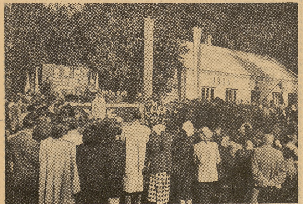
Materiały z obchodu 50-lecia Zjazdu w Pilaszowie zamieszczamy na stronie 2.