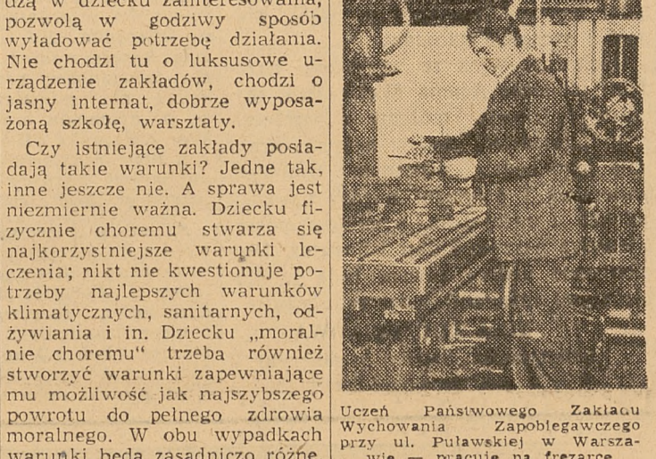
Uczeń Państwowego Zakładu Wychowania Zapobiegawczego przy ul. Puławskiej w Warszawie — pracuje na frezarko

C HCĘ zabrać głos w sprawie obchodzącej nie tylko nauczycieli, ale i nas, sędziów, oraz władze sądowe. Chcę mówić o małoletnich „przestępcach”.