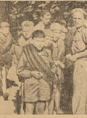
Dzieci z Państwowego Zakładu Wychowania Zapobiegawczego przy ul. Kryszyńskiej w Warszawie — dobrze czują się na niedzielnej wycieczce

Wnioski te w wyjątkowych tylko wypadkach są pozytywnie załatwiane, gdyż do zakładów wychowawczych w pierwszej kolejności kieruje się dzieci i młodzież na podstawie nakazów przyjętych wydawanych przez sądy dla nieletnich. Dla dzieci trudnych, na których wyrok sądu jeszcze nie ciąży, miejsce w zakładach wychowawczych zostaje niewiele. Szkoły więc doszły do wniosku, że skoro do tych zakładów są kierowane prawie wyłącznie dzieci posiadające, to widocznie są to właściwe zakłady dla dzieci z wyrokami sądowymi. W wyniku tego w początku nauczycieli i rodziców zwracają się z zawiadomieniami do sądu, żądając skierowania do zakładów wychowawczych i poprawczych, bo jedne i drugie zakłady przyjmują dzieci skierowane na mocy wyroków sądów dla nieletnich. Dlatego też szkoły ogólnokształcące, domy dziecka, komitety opiekuńcze, komitety blokowe, a nawet sami rodzice, nie widząc możliwości umieszczenia dziecka trudnego w zakładzie wychowawczym przez wydział oświaty, zwracają się w trudnych wypadkach o pomoc do MO lub do sądu dla nieletnich.