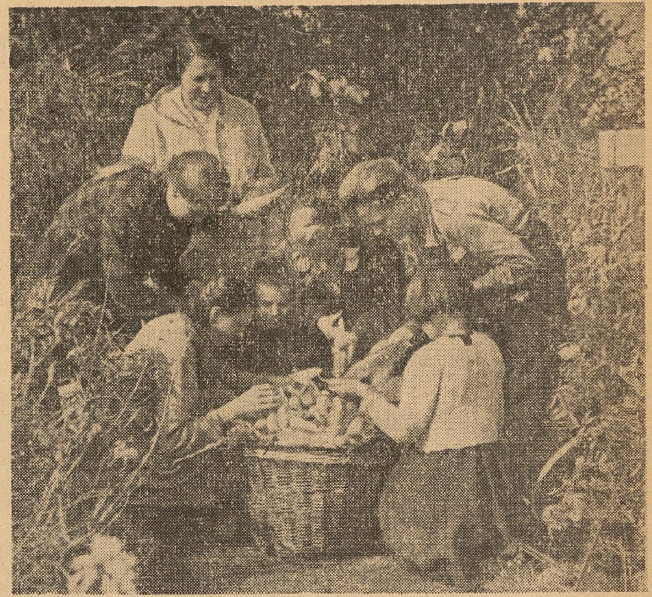
Zbiór kukurydzy w 7-mio klasowej Szkole Podstawowej w Czubinie, województwo warszawskie.