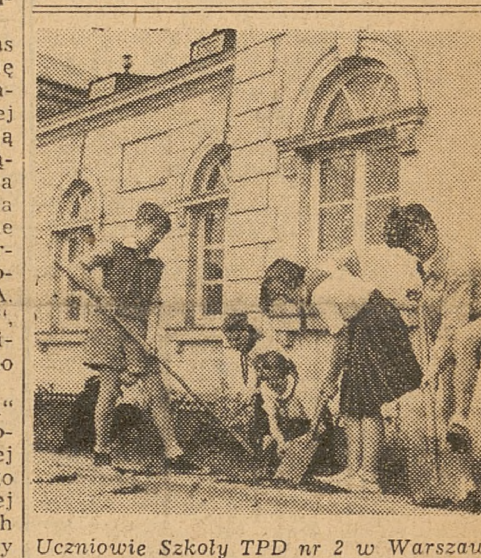
Uczniowie Szkoły TPD nr 2 w Warszawie porządkują teren przed gmachem szkolnym

Nas, wychowawców, najbardziej raduje to, że uczniom nieobca jest także myśl o konkretnej i żmudnej pracy przy odbudowie Warszawy. Oto powstał wśród nich projekt, aby ufundować cegły dla Warszawy — każdy po jednej cegle. Do dziś właściwie nie wiadomo, kto był autorem tego pomysłu. W każdym razie spodobał się on naszym aktywistom z organizacji młodzieżowych i ostatecznie postanowiono wystąpić z tym projektem podczas apelu poświęconego Warszawie.