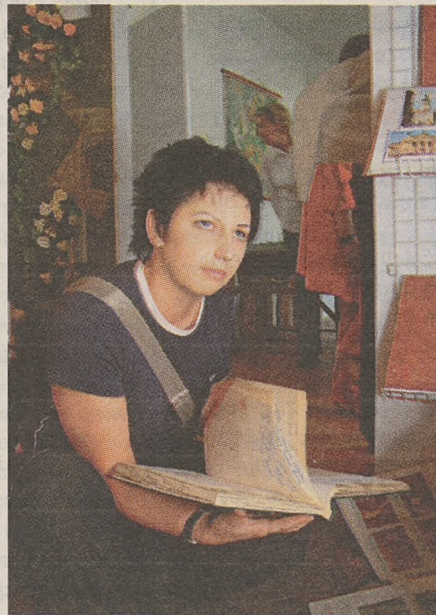
Dla młodych to czasy pradiadków