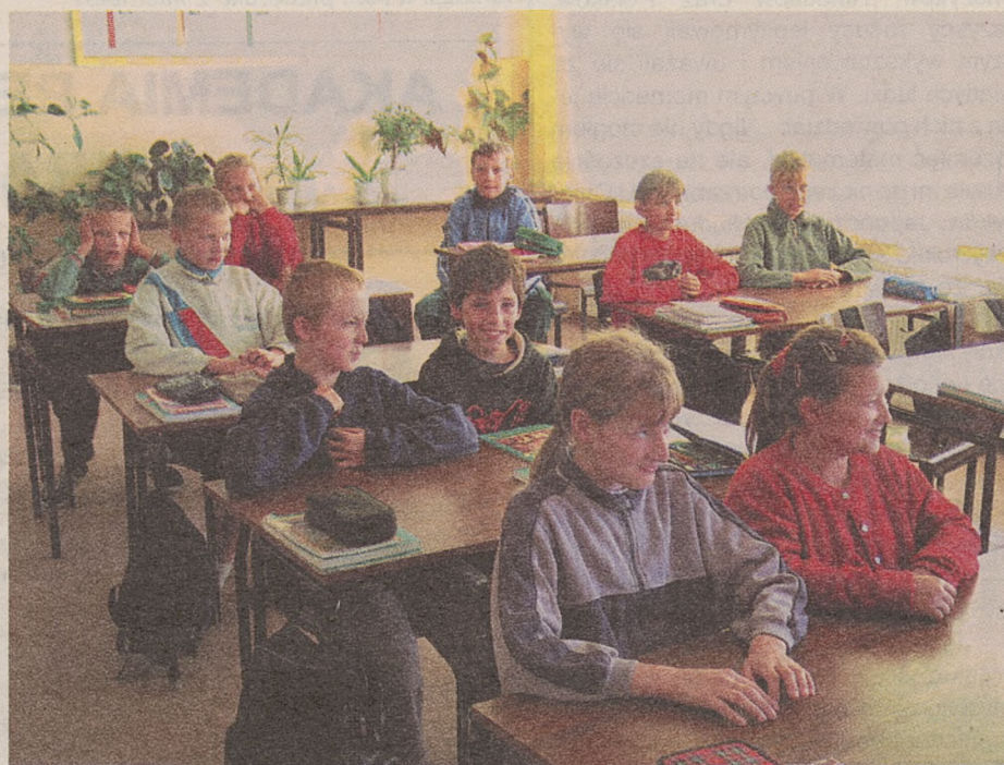
Dzieci z podstawówki w Długoleści poprawnej polszczyzny uczą się tylko w szkole