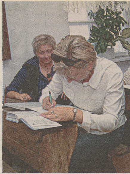
W ławkach z początku wieku