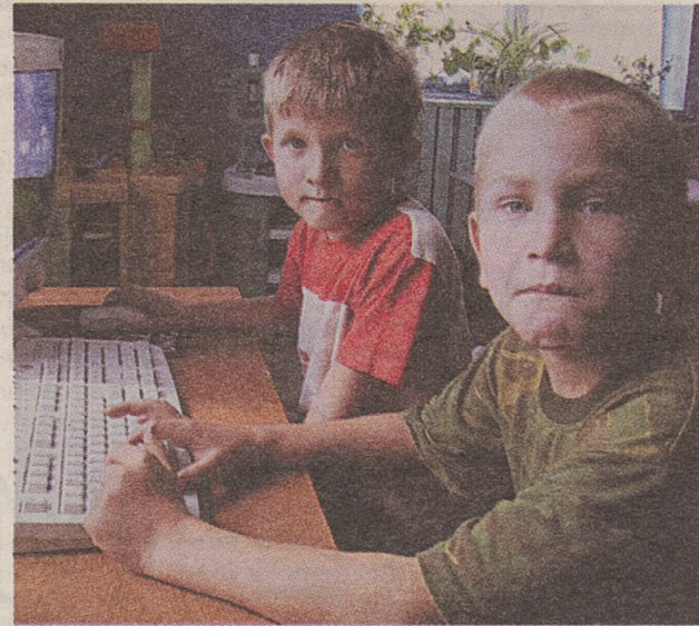
Edukacja informatyczna rozpoczyna się już w „zerówce”