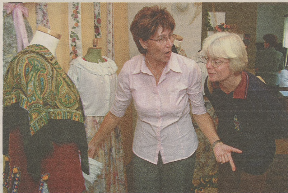
Stroje przyciągały i... wywoływały komentarze