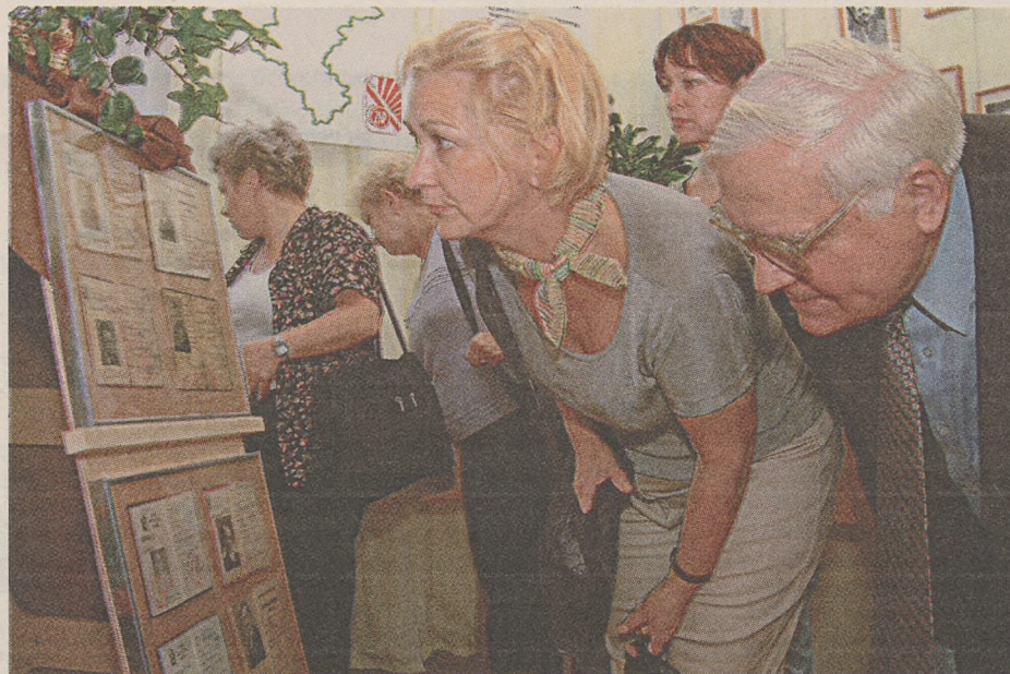
Na legitymacjach postacie, o których się tylko słyszało