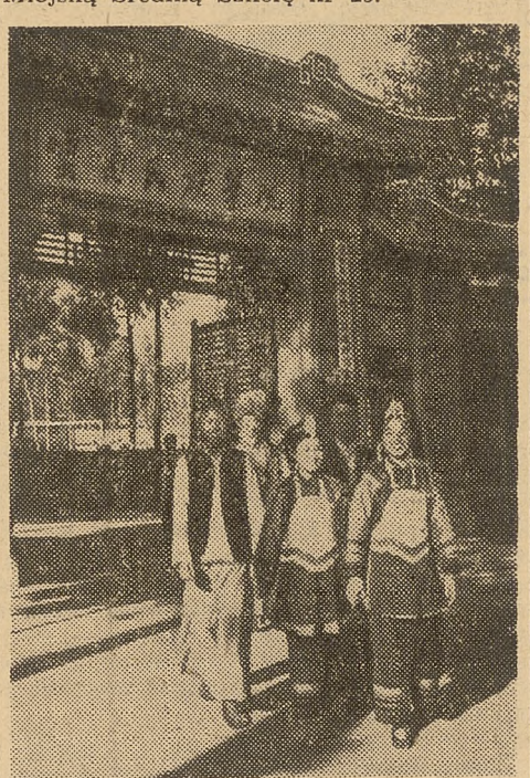
Młodzież różnych narodów zamieszkujących Chiny ma możliwość uczyć się w języku ojczystym

Ilość pomocy naukowych w laboratorium biologicznym w porównaniu z okresem przed wyzwoleniem zwiększyła się o połowę. Przy szkole wybudowano piastarnię i cieplarnię. W 1953 r. Wydział Oświaty przyjął pod swój zarząd średnią szkołę „Jujiń”, została ona przemianowana na Miejską Średnią Szkołę nr 25.