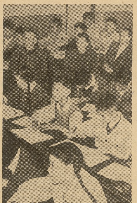
W Szanghajskim Instytucie Pedagogicznym

Przedtem dzieci robotników i chłopów nie mogły uczyć się w średniej szkole