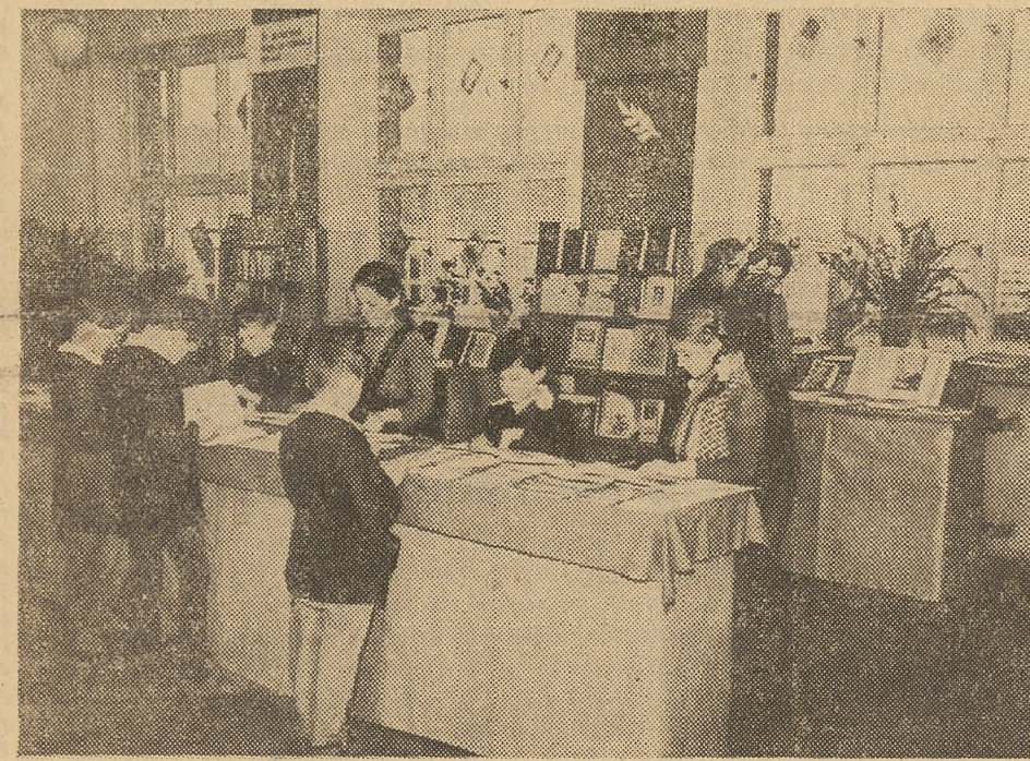
Zespół nauczycielski Szkoły Podstawowej nr 14 w Warszawie urządził w ub. r. wystawę książek radzieckich pod hasłem „Co czytają dzieci radzieckie”. Wystawę tę zwiedziło wiele warszawskich szkół. Na zdjęciu fragment wystawy