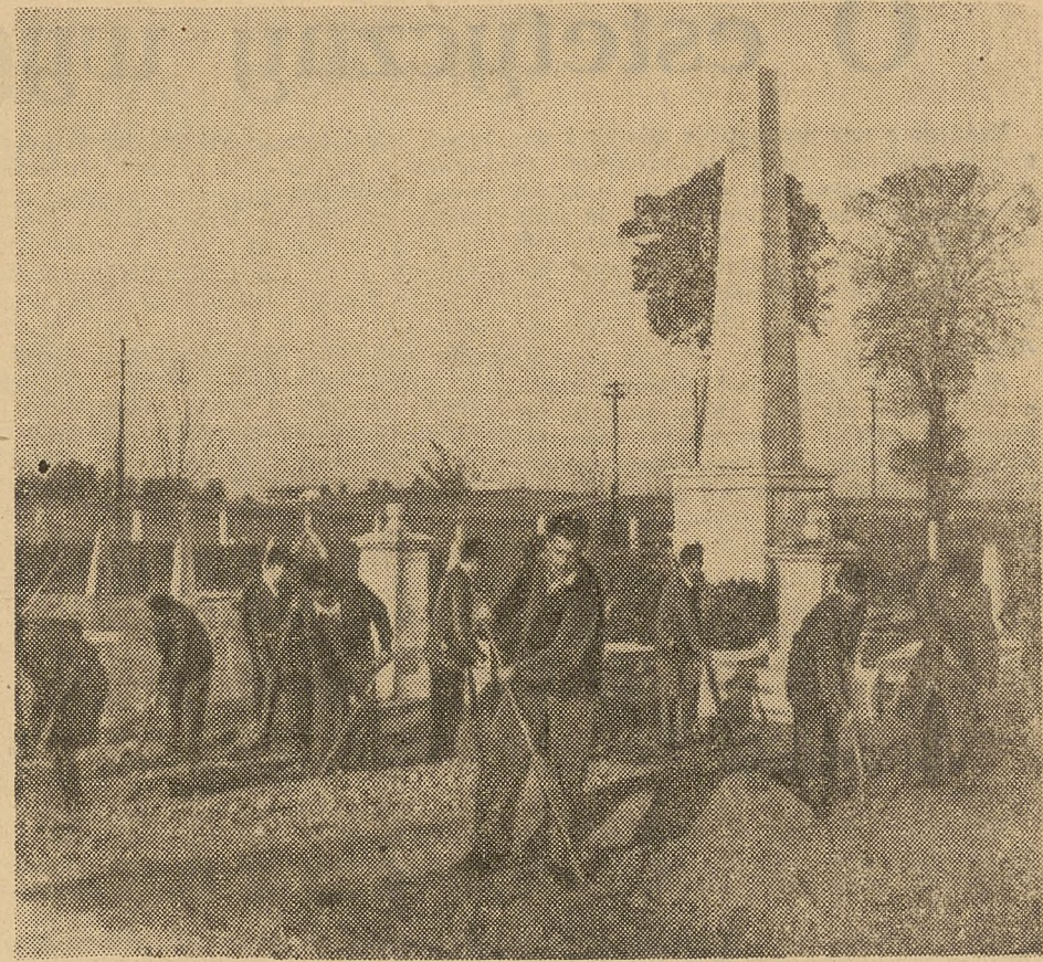
Patrz artykuł na str. 2