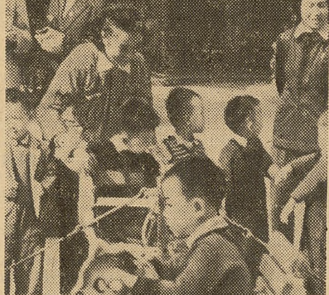
W chińskim przedszkolu

Chcę przekazać nagromadzoną wiedzę i doświadczenie moim uczniom, pomóc im opanować matematykę, która jest kluczem do zdobycia wiedzy.