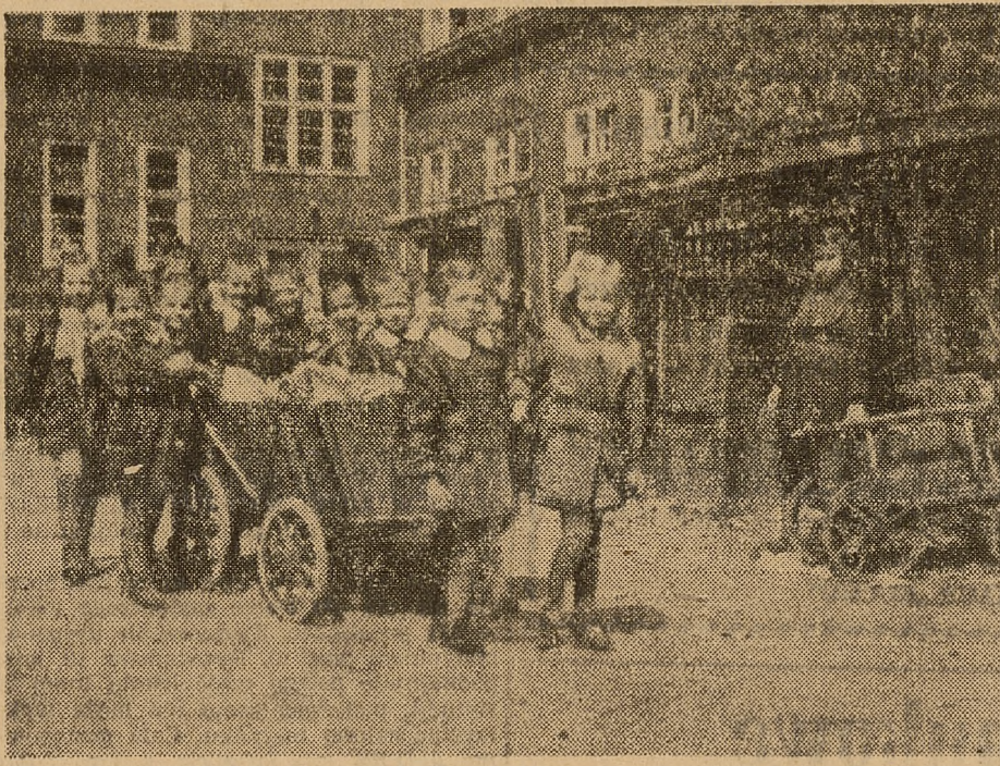
W szkole nr 4 w Opolu nawet drugoklasiści biorą udział w zbiorce złomu i makulatury na rzecz Odbudowy Warszawy...