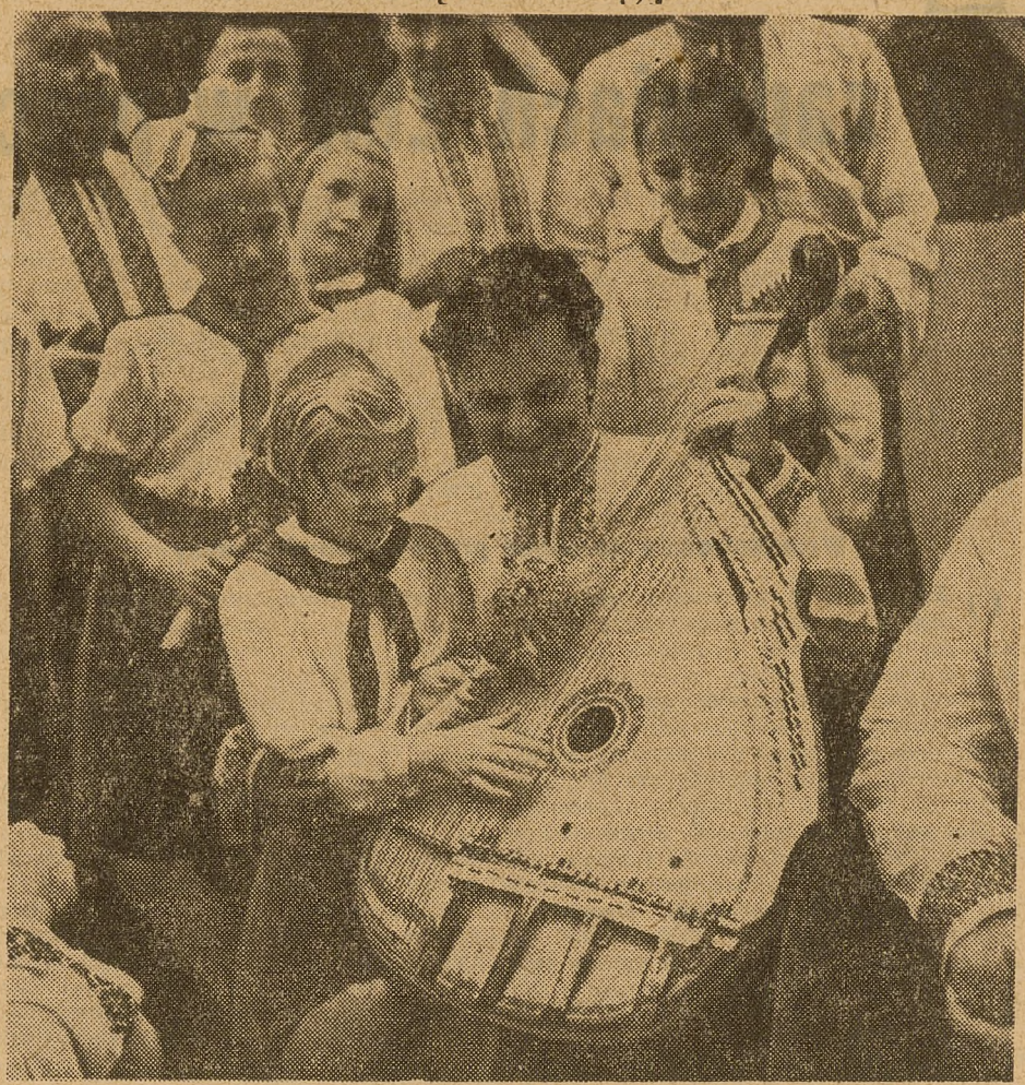
W Miesiącu Przyjaźni wiele radości harcerzom lubelskim sprawiła wizyta członków ukraińskiego zespołu muzycznego bandurzystów