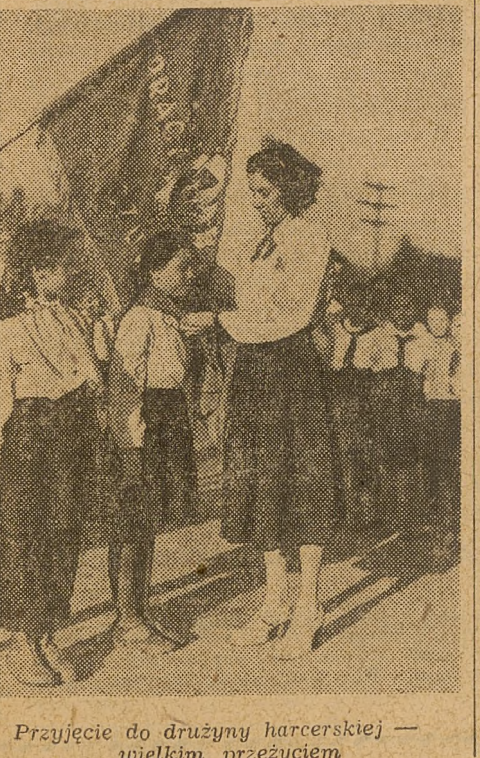
Przyjęcie do drużyny harcerskiej — wielkim przeżyciem

Wykonanie wszystkich zadań postawionych na Plenum będzie możliwe tylko wtedy, gdy współpraca między aparatem oświatowym a aktywnym ZMP zacznie się, gdy wszystkie instancje organizacji młodzieżowej zbliżą się do szkoły i do zagadnień związanych z wychowaniem dzieci, a nauczyciele zrozumieją specyfikę pracy organizacji harcerskiej.