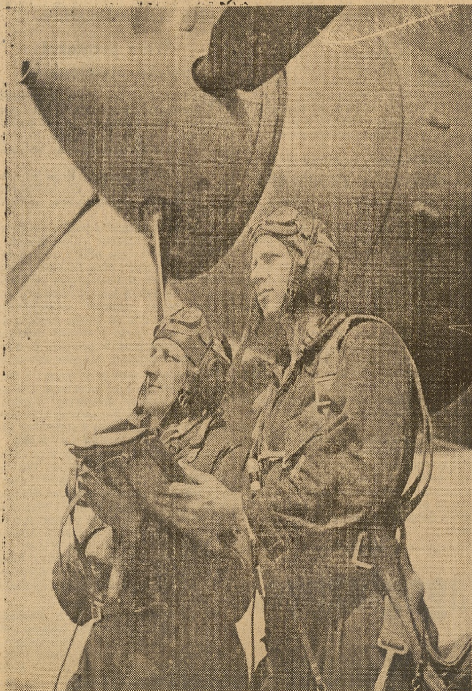
Z roku na rok rośnie siła naszego pokojowego lotnictwa, którego osiągnięcia stały się możliwe dzięki pomocy niezwykłego lotnictwa radzieckiego.

Na zdjęciu: w jednostce lotniczej — piloci przed odlotem