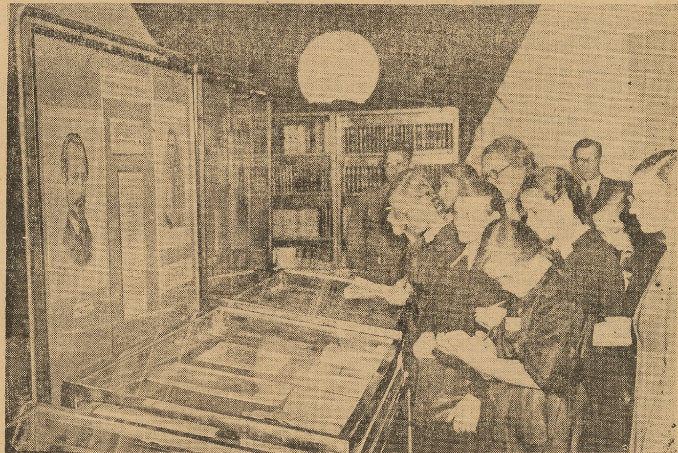
W ramach „Dni Oświaty, Książki i Prasy” Biblioteka Narodowa w Warszawie zorganizowała w lokalu gimnazjum przy ul. Klonowej 16 wystawę p. n. „Książka w walce o postęp, pokój i socjalizm”. Na zdjęciu: grupa młodzieży szkolnej zwiedza wystawę.