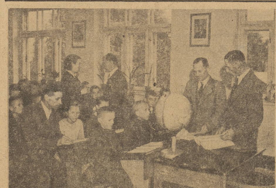
Tam gdzie nauczyciele biorą czynny udział w życiu wsi, tam też i władze gminne okazują więcej uwagi sprawom szkoły i warunkom pracy nauczycieli. Na zdjęciu: przewodniczący GRN we wsi Rebino, pow. sochaczewski, wraz z radnymi podczas odwiedzin w szkole podstawowej