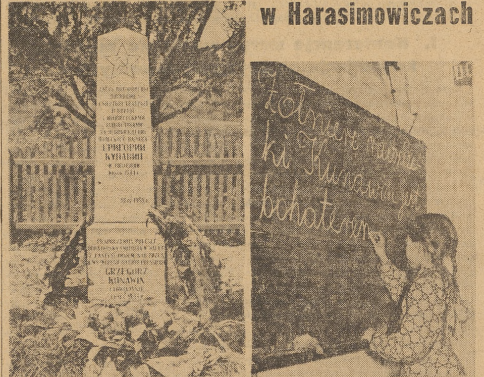
Artykuł o szkole im. Kunawina w Harasimowiczach, pow. Sokółka, zamieszczamy na str. 5. Na zdjęciach: 1) Pomnik na grobie Grzegorza Kunawina, 2) Uczennica kl. IV — Renia Baranowska przy tablicy na lekcji języka polskiego