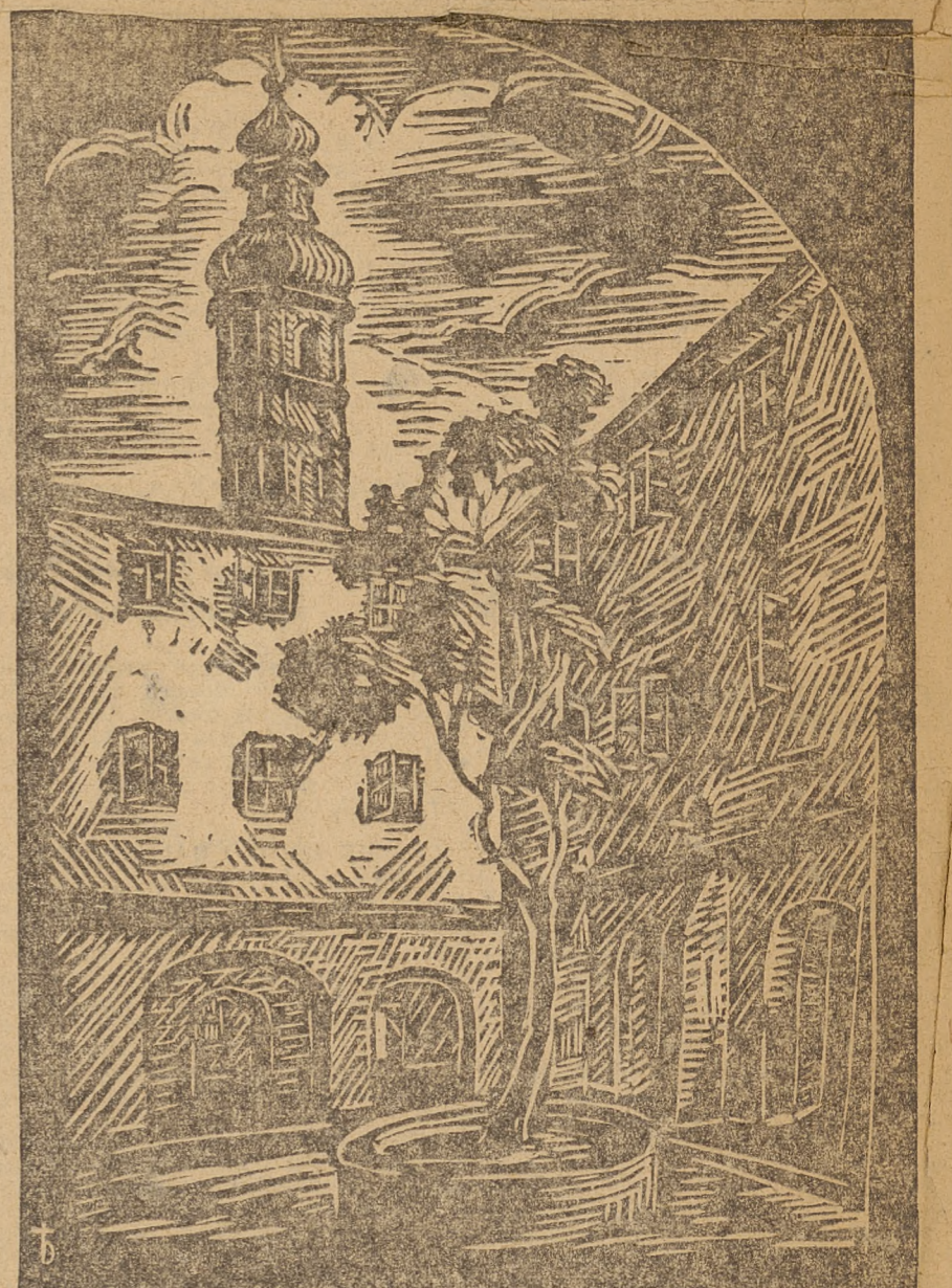
„Dzielniec przy ul. Piwnej” wykonany przez Bronisława Tomeckiego, nauczyciela (dinyt z teki „Warszawa dziś”, wydany przez Zasadniczej Szkoły Zawodowej w Warszawie)