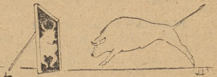
Fraszki i rysunek nadesłał JAN MICKUNAS naucz. Liceum w Sompólnie

Kto się obraża na karykaturę? Byk, bo to bydlę głupie i ponure.