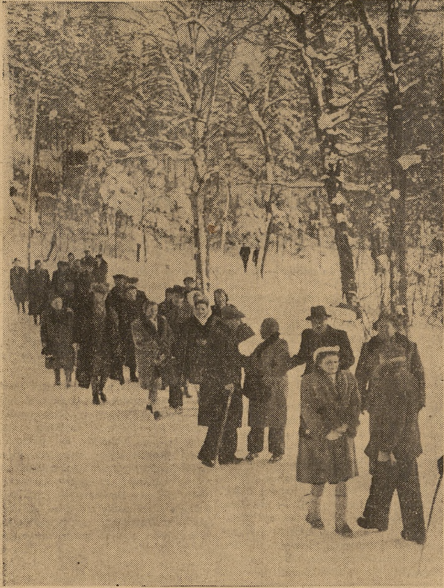
W okresie ferii świątecznych, nauczyciele wyjeżdżają do domów wypoczynkowych ZNP. Na zdjęciu koledzy w Szklarskiej Porębie

Rozległa sieć korespondentów centralnego organu Związku Nauczycielstwa Polskiego, ich szybkość i żywe reagowanie na wszelkie wydarzenia otaczającej ich rzeczywistości przyczyni się niewątpliwie w sposób istotny do usunięcia wielu niedomagań przeszkadzających nauczycielowi Polski Ludowej w wykonywaniu jego odpowiedzialnej pracy.