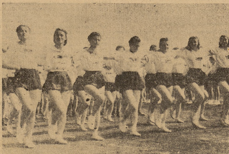
Musimy wychować zastępy zdrowych, mocnych i radosnych ludzi. (Patrz sprawozdanie z obrad Plenum Głównego Komitetu Kultury Fizycznej na str. 4)

Wszystkim Koleżankom i Kolegom — czytelnikom, korespondentom i współpracownikom, serdeczne życzenia świąteczne przesyła