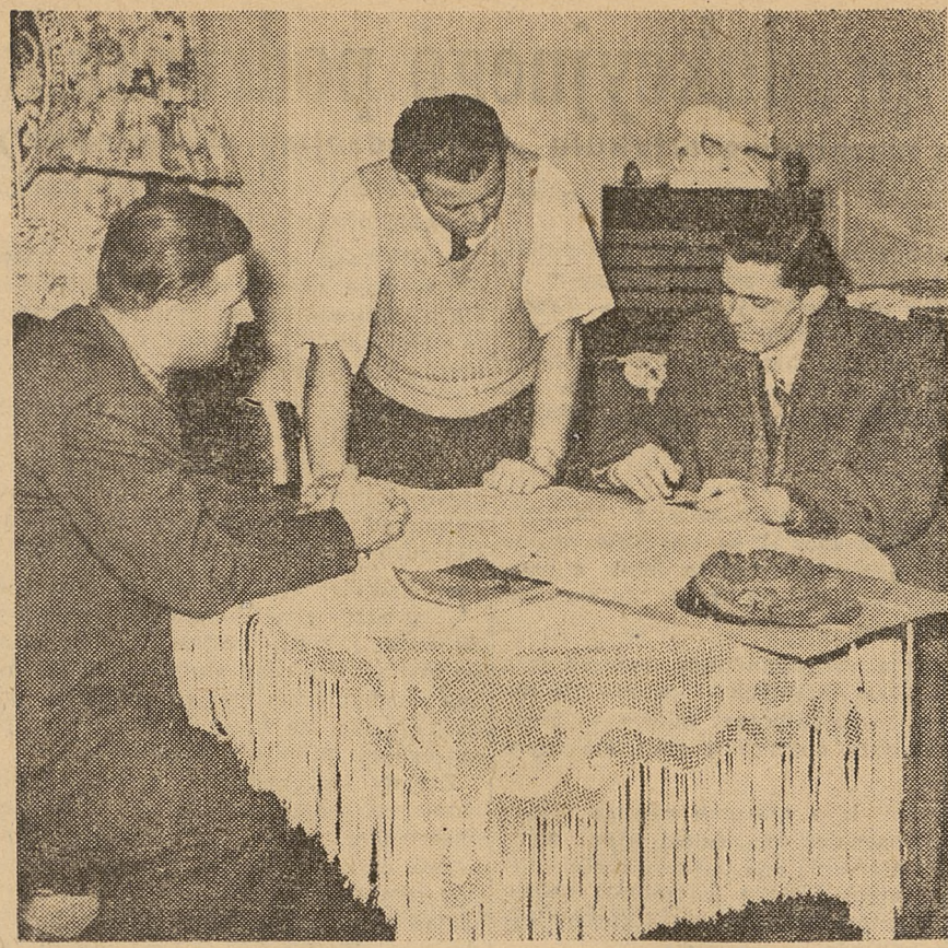
Wielka armia komisarzy spisowych rekrutujących się spośród nauczycieli, studentów i uczniów zdała egzamin obywatelski...