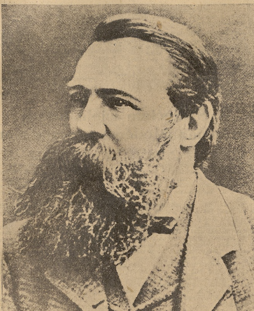
FRYDERYK ENGELS (w 130 rocznicę urodzin)

„Po swoim przyjacielu Karolu Marksie — był Engels najwybitniejszym w całym cywilizowanym świecie uczyńcem i nauczycielem współczesnego proletariatu.