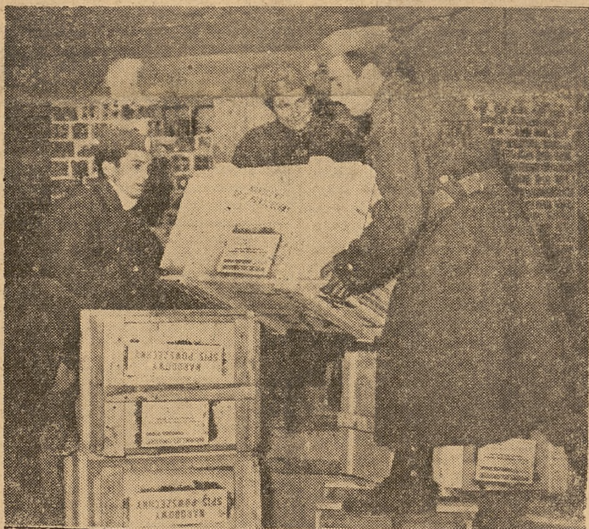
W Narodowym Spisie Powszechnym wzięły udział nauczyciele i młodzież.

Dlatego wzywamy cały ogół nauczycielstwa związkowego, by szczerze zarządzenie władz wykonało w całej rozciągłości i z pełnym zrozumieniem jego doniosłości.