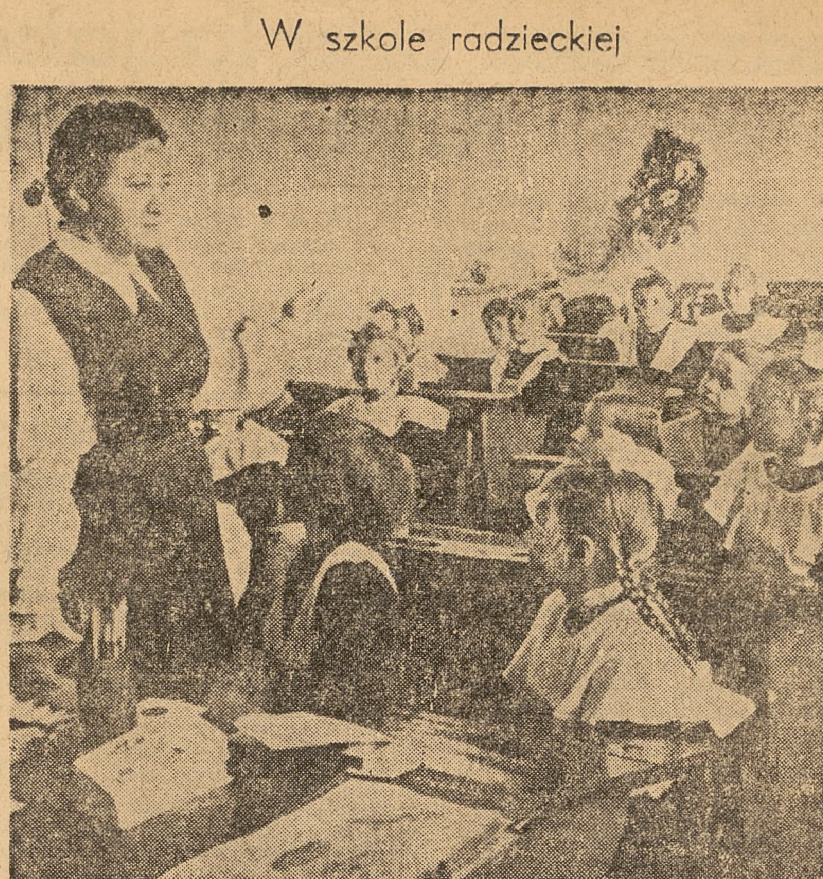
Pierusza lekcja w kl. I szkoły średniej Nr 635 w Moskwie