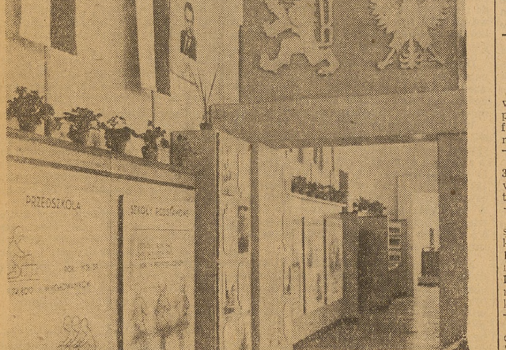
W Pradze Czeskiej staraniem Ministerstwa Oświaty urządzono wystawę ilustrującą dorobek szkolnictwa i oświaty w Polsce. Na zdjęciu: fragment wystawy.