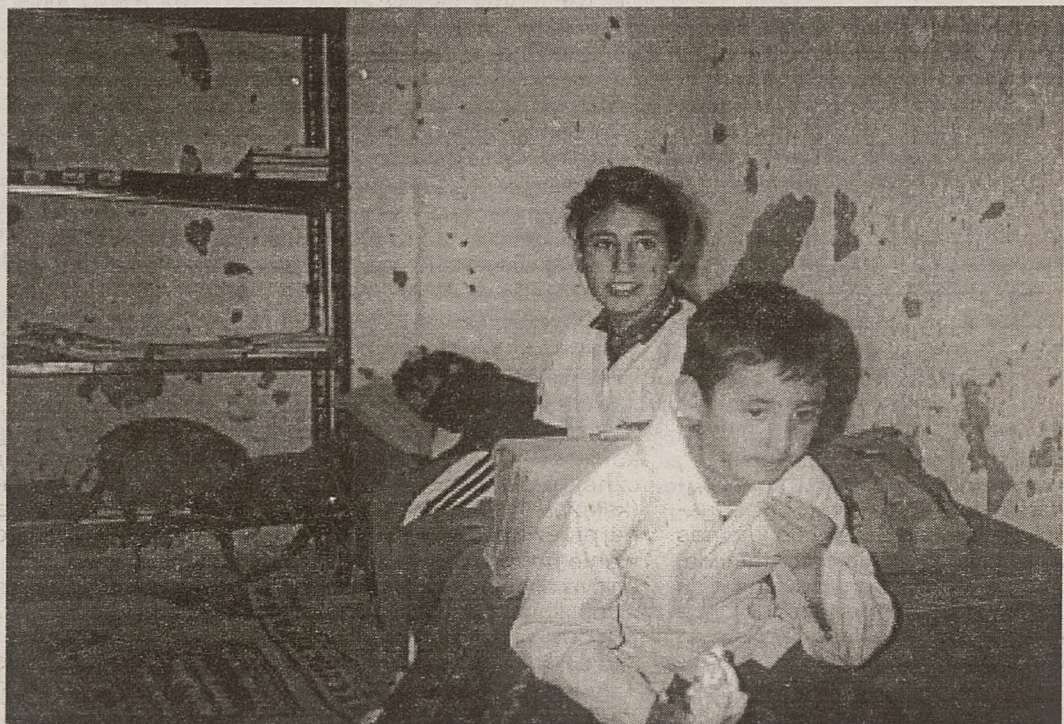
Dzieci z Matmaty po lekcjach w eleganckich szkołach wracają do swych pokoików w jaskiniach.