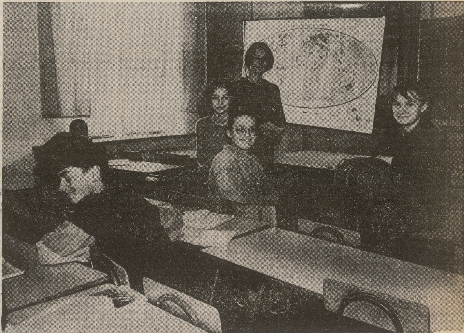
Radzyńska szkoła ma za sobą już bodaj wszystkie formy kształcenia nauczycieli.