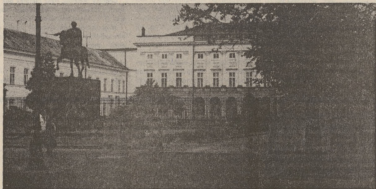
Krakowskie Przedmieście. Pałac Namiestnikowski. Obecna siedziba Prezydenta RP.

Krakowskie Przedmieście jest ulicą kościołów, pałaców i pomników. Tu mieszczą się także gmachy główne Uniwersytetu i Akademii Sztuk Pięknych. Na niewielkiej przecięż przestrzni wznoszą się czyste bryły czterech świątyń: Świętej Anny, Wizytek, Karmelitów Bosych i jeden z największych kościołów Warszawy — Świętego Krzyża.