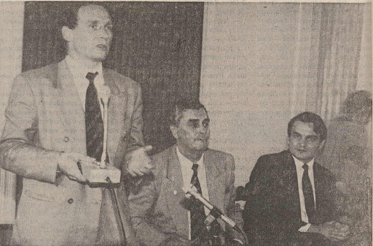
W przerwie parlamentarnej debaty oświatowej, na ad hoc zorganizowanym spotkaniu z nauczycielami.