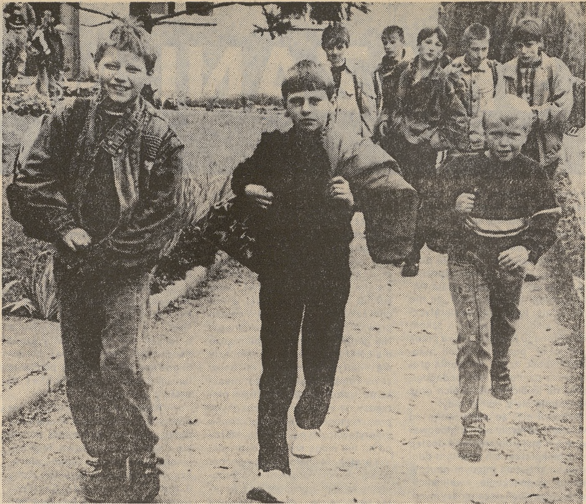
Czeka jeszcze kilka kilometrów drogi do domu.

— Nie śmiem prosić rodziców o pieniądze na remont szkoły. Pro-