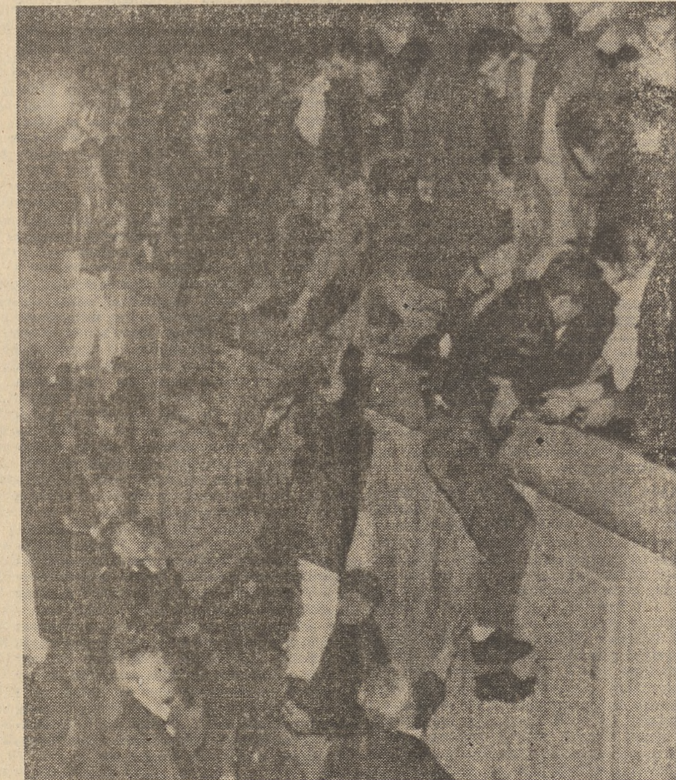
Pod murem doszło — jak dotychczas — do jednego incydentu, kiedy to z obu stron młodzi ludzie próbowali go „rozbić”. Policja jednak (po obu stronach muru) dość szybko opanowała sytuację.

— Pierwszy raz będziecie z tym murem? — pytam roześmianą parę, przytulając się do siebie.