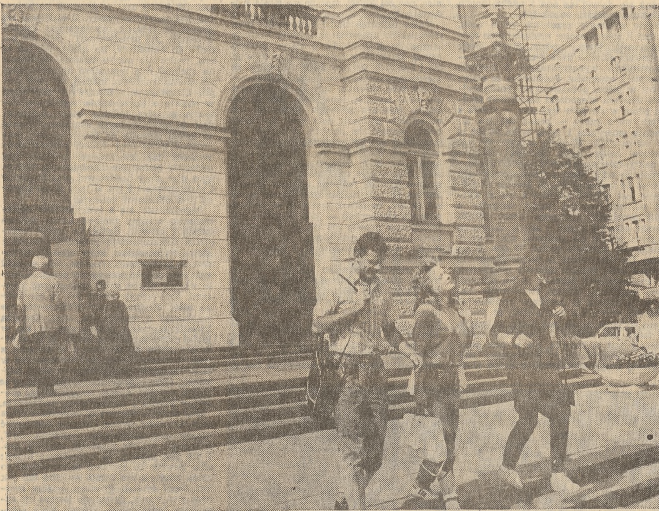
Politechnika Warszawska, największy w kraju zakład kształcący inteligencję techniczną. A jednocześnie bieda, aż piszczy...