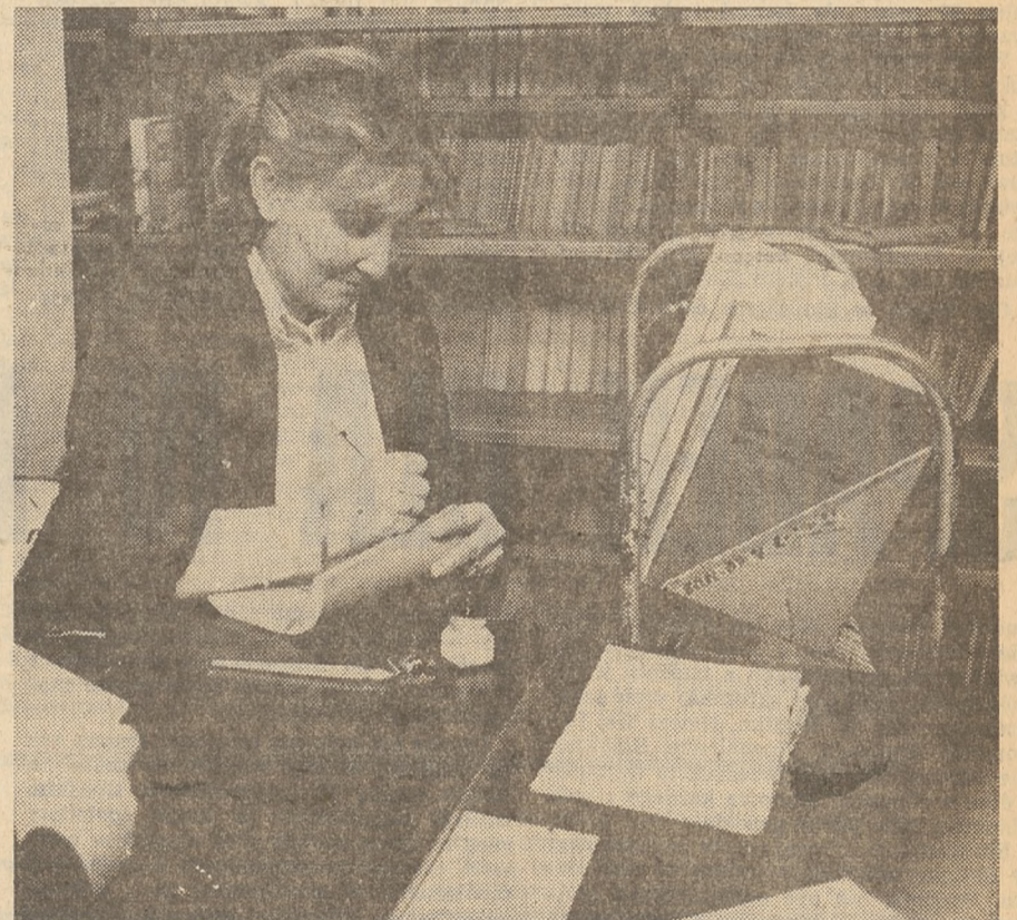
Do bibliotek trafi wkrótce nowa biblioteczka upowszechniająca postęp pedagogiczny.

Cieszy mnie jako organizatora Biblioteki Postępu Pedagogicznego, że otwiera ją właśnie dzieło profesora Szczepańskiego. Choć wydane w zbyt małym nakładzie, będzie ono nie tylko wybitną pozycją biblioteki, lecz także stanie się wydarzeniem w szerszym życiu oświatowo-kulturalnym naszego kraju.