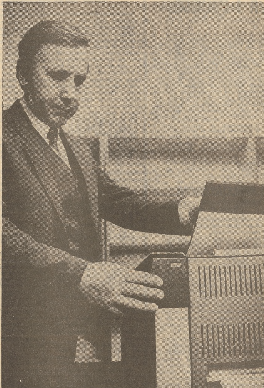
WBP w Olsztynie, dysponująca podstawowym dla tego typu placówek sprzętem — kserokopiarka, stanowi rzadki wyjątek. Nie tylko sytuacja ludzi, także wyposażenie w sprzęt wszystkich bibliotek wymaga szybkiej zmiany.

Sekcje zawodowe, w tym bibliotekarska, mogą jeszcze mniej niż Związek, gdyż ich regulamin nie pozwala im zwracać się bezpośrednio do władz wykonawczych czy ustawodawczych i często najpierw trzeba przekonać naszych kolegów, członków prezydium i plenum, że sprawa wymaga podjęcia i wniesienia na obrady lub wystąpienia do władz. A jak to łatwo, wie każdy nauczyciel-bibliotekarz mający na co dzień próbkę zrozumienia i oceny swej roli i zadań we własnym gronie i najbliższym otoczeniu. Zaryzykuję tu stwierdzenie, że świadomość funkcji bibliotek w systemie edukacji jaką posiada administracja najwyższego szczebla w wyniku kilkuletniej