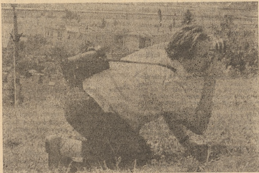
Ludwik Waclawczyk w akcji.