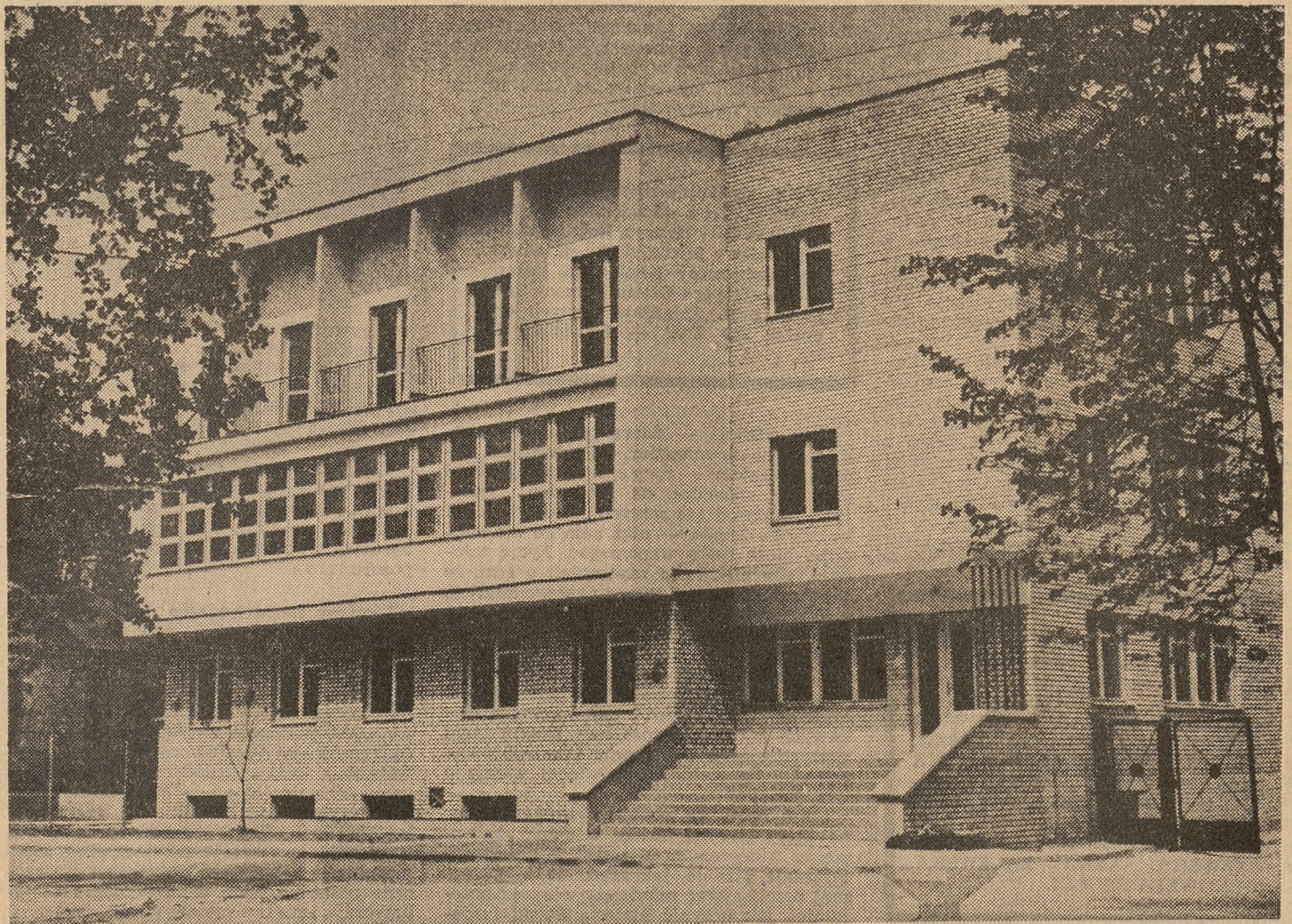
Dom Nauczyciela w Białej Podlaskiej

Apelujemy więc do wszystkich działaczy tego ruchu, do prezesów oddziałów i okręgów ZNP o nadsyłanie do nas lub do ZG ZNP informacji w dość szybkim terminie, bo do 10 listopada. Chcielibyśmy bowiem pod koniec listopada zorganizować w redakcji wspólne spotkanie wszystkich zainteresowanych stron, by wymienić doświadczenia, podzielić się wnioskami i przedyskutować organizacyjną stronę powołania Federacji. W spotkaniu wzięliby udział przedstawiciele ZG ZNP, zarządu Nauczycielskiej Spółdzielni Budownictwa Mieszkaniowego „Oświata” z Warszawy oraz działacze w terenie. Być może uda się w ten sposób choć w niewielkim stopniu przybliżyć ciągle jeszcze dla wielu utopijną perspektywę uzyskania własnego mieszkania. Czekamy na informacje z okręgów.