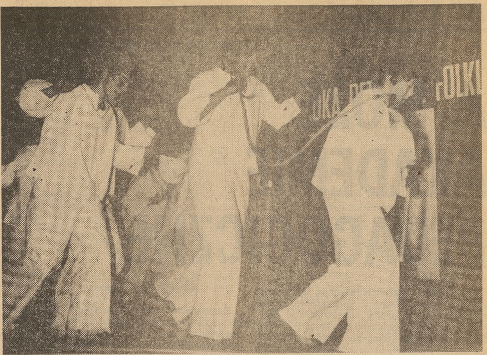
Czy słowacki folklor ułatwi powrót do „normalnego” życia?

Ba, ale żeby wziąć udział w tych imprezach i jeszcze zdobyć nagrodę (co