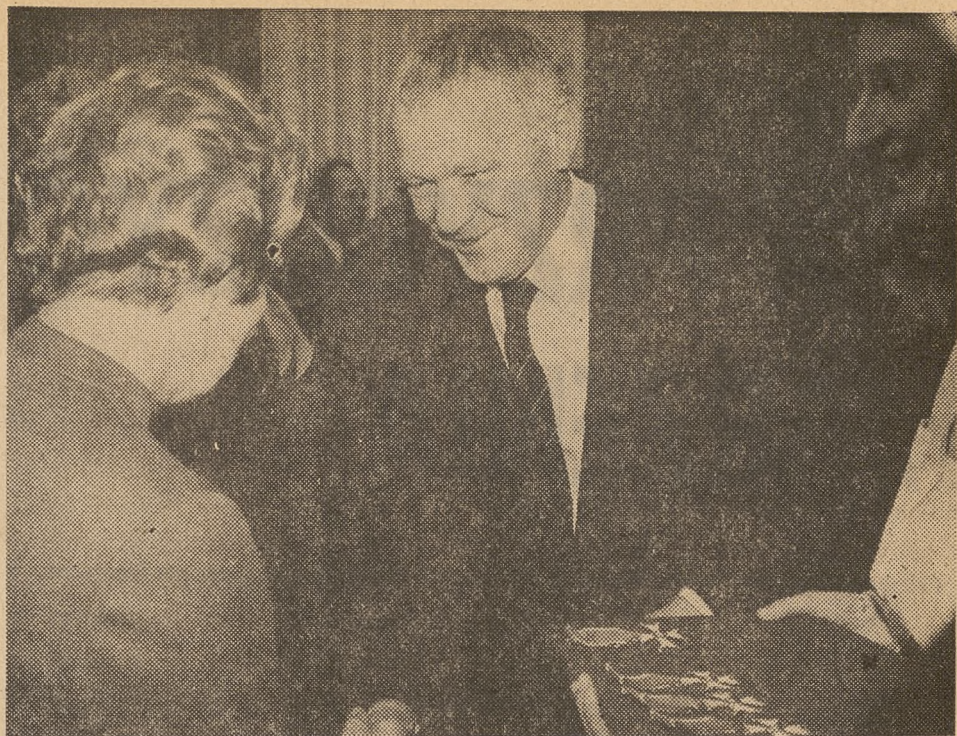
Serdeczne gratulacje od wicepremiera Rakowskiego tuż po dekoracji Krzyżem Kawalerskim Orderu Odrodzenia Polski.