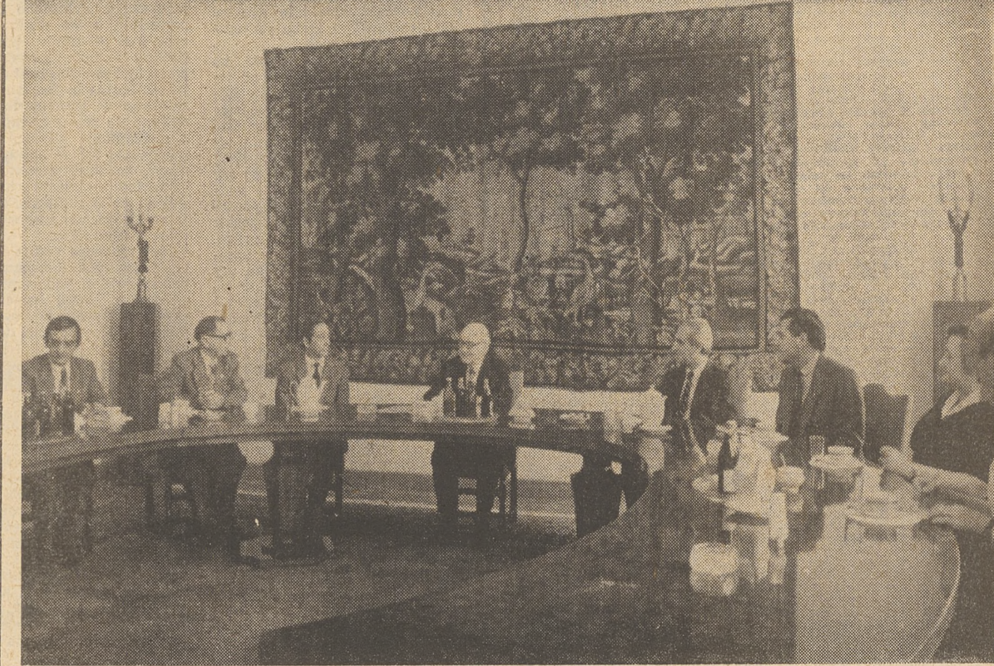
Fot. Marek Suchecki