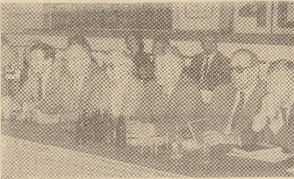
Fot. Adam Żyworonek

Projekt reformy stypendialnej rozpatrywany przez Komitet do Spraw Młodzieży przewiduje niezbędne, dodatkowe środki z budżetu państwa na ten cel. W skali roku wynoszą one 2500 mln zł. Uzupełniony w ten sposób fundusz stypendialny pozwoliłby na podniesienie maksymalnej stawki stypendialnej do wysokości miesięcznej opłaty za wyżywienie w internatach. Jak wynika z relacji przedstawionej przez dyrektora Wiesława Krauzego wiele nieprawidłowości występuje w trakcie przyznawania stypendiów przez dyrektorów. Panuje tu absolutna dowolność. Stypendia wypłacane są według własnych kryteriów dochodów, w różnych kwotach i w różnych terminach.