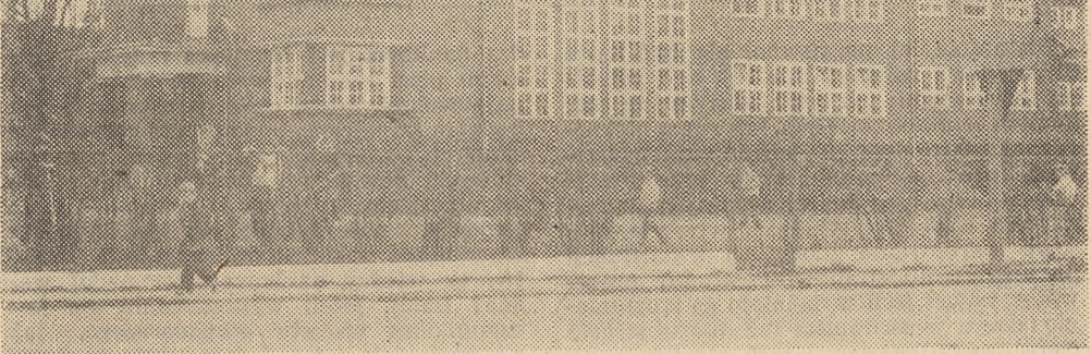
Zbiorcza Szkoła Gminna w Zalewie — otwarta na wszystko i dla wszystkich.