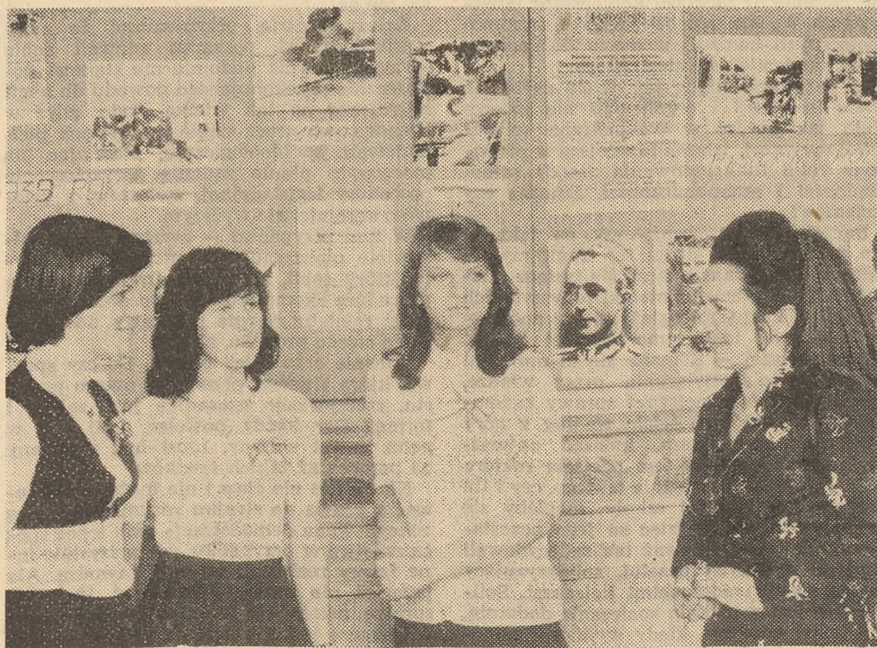
Fot. Cz. Górski