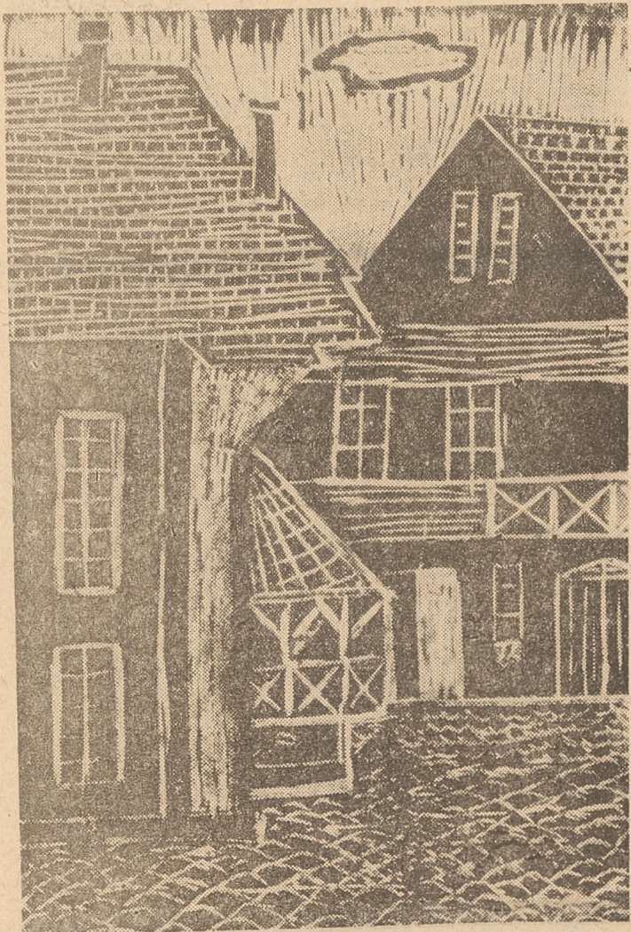
Zofia Suf: „Stare domy w Łodzi” (linoryt)