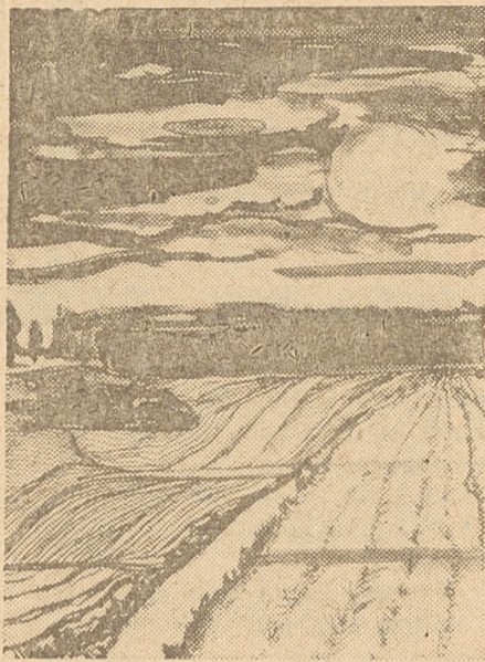
Alicja Szkułtarek: „Okolica” (rysunek)