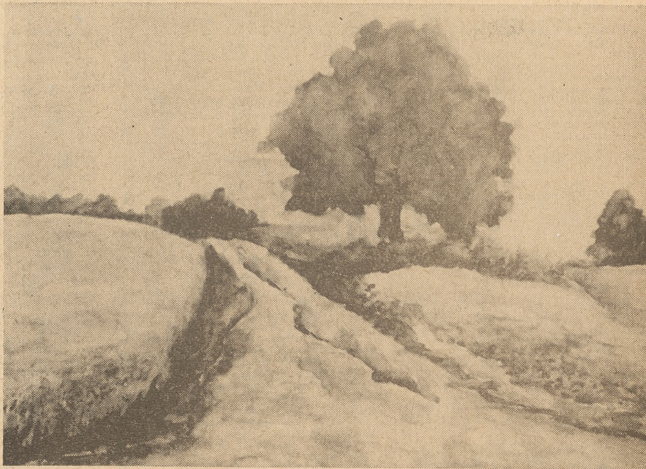
Józef Stejka: „Pejzaż” (akwarela)

Weszłam w twoje życie bez echa listu nie ma ciebie nie ma odwlekasz już leśzczyny rozbijały się w słońcu bez końca choć listonosz już z ironią na mnie patrzy jeszcze ciągle ci tłumaczę brakiem czasu jeszcze noszę twoją fotografię jeszcze pragnę byś nie odszedł nie zostawił przyszł do mnie