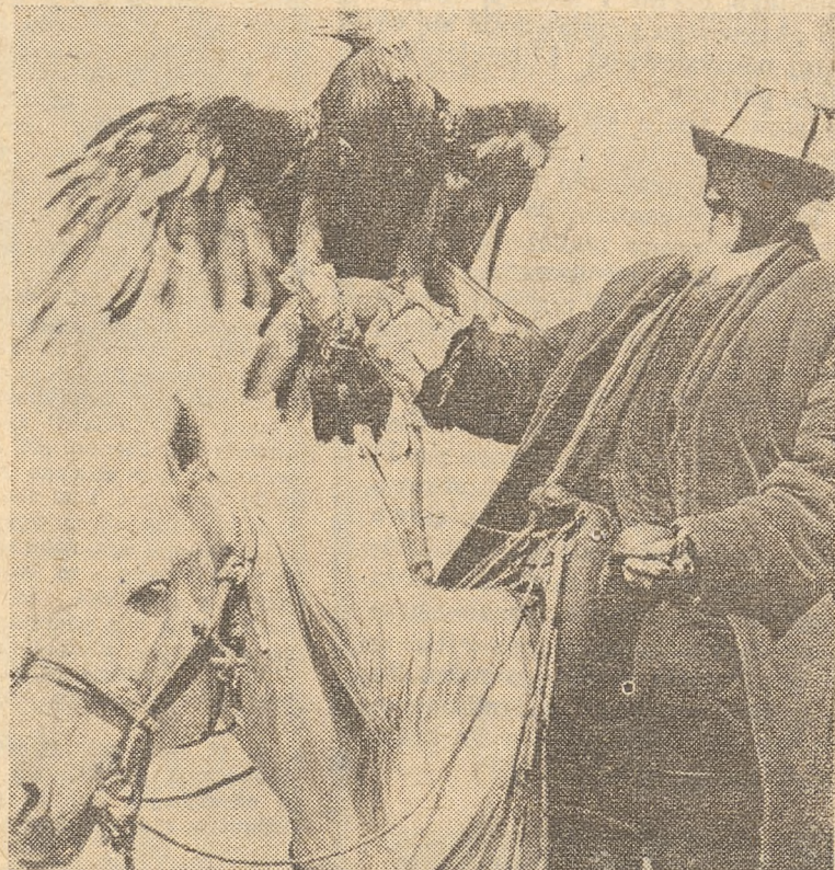
W. GAF - KRP