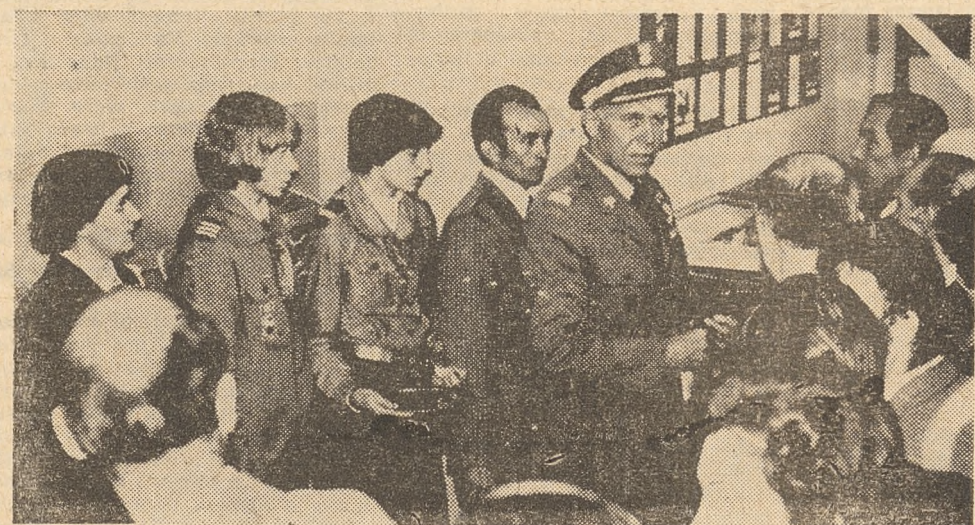
Otwarcie Izby Pamięci Narodowej