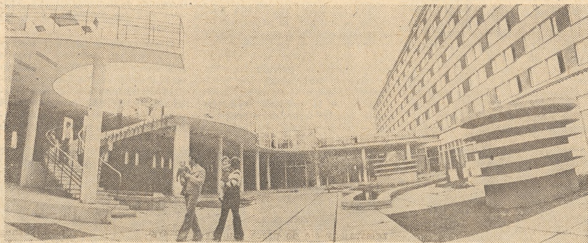
... oto imponujące rozwiązania urbanistyczne w stolicy republiki...