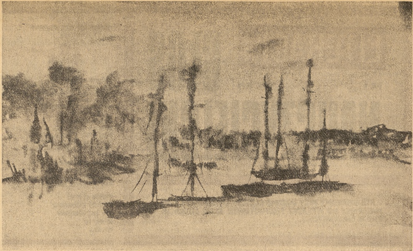
Eugeniusz Dawidziuk: „Zagłówki na jeziorze” (akwarela)