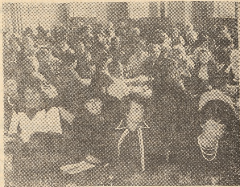
Na sali obrad i w czasie dekoracji...

W tej chwili sprawą pilną jest uregulowanie nieprawidłowości w usytuowaniu nauczycielek przedszkoli. Chodziłoby o niwelowanie występujących obecnie różnic w rozliczaniu godzin ponadwymiarowych między nauczycielkami przedszkoli i szkół podstawowych. Jest to tym bardziej krzywdzące, że nauczycielka przedszkola musi często pozostać z dzieckiem wiele godzin ponad przewidziany czas zajęć. Zdarzają się bowiem sytu-