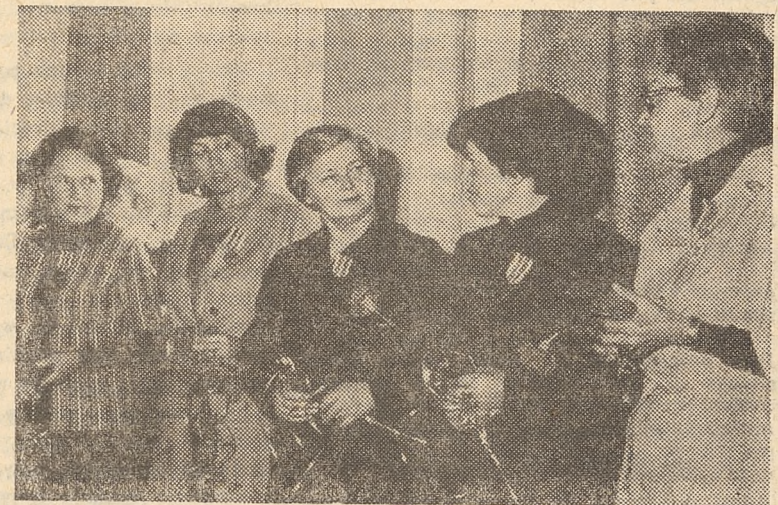
Edycja: Cz. Górski

acje, że rodzice spóźniają się, przypominają o swoich pociechach, no i wtedy ktoś musi czuwać.