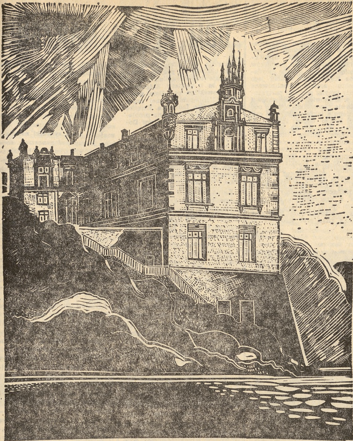
Z. Strzałkowski: „Teatr Lalki i Aktora w Lublinie” (linoryt).