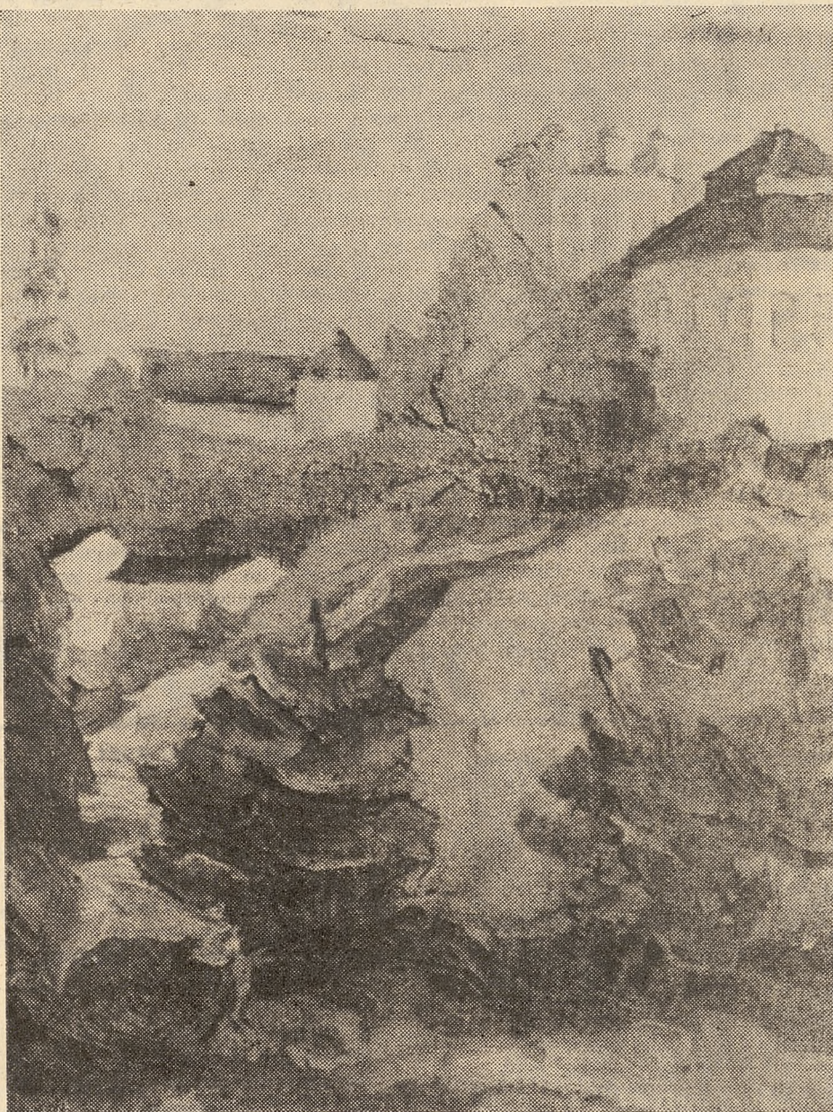
A. Drygallo: „Sandomierz” (olej)

REDAGOWANY PRZY WSPÓŁDZIAŁE KLUBÓW LITERACKICH ZNP. MATERIAŁY DO WKŁADKI PRZYGOTOWAŁ KLUB LITE- RACKI ZNP W LUBLINIE.