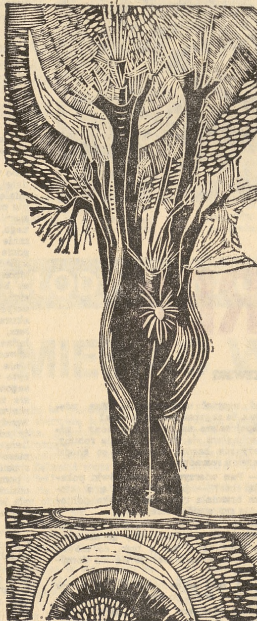
Z. Jóźwik: „Kompozycja” (linoryt)

trzeba mieć odwagę by przeciwstawić się prawom przemijania