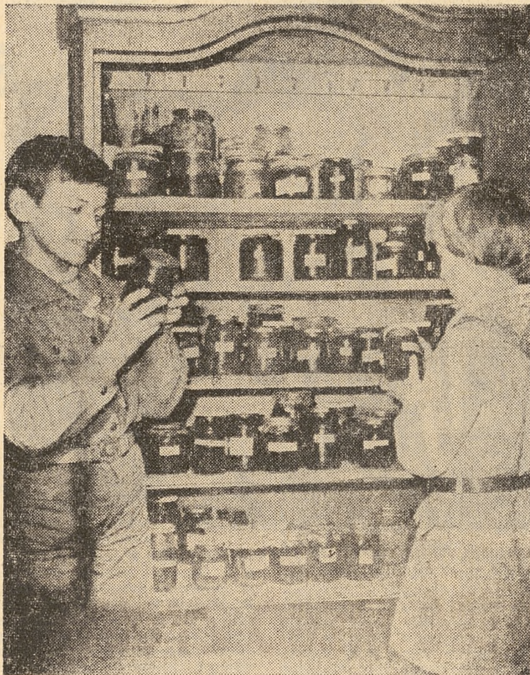
Te przetwory owocowe, to dzieło uczniów szkoły w Umistowie. O placówce tej, stawiającej — w oparciu o doświadczenia Celestyna Freineta — na daleko idącą samorządność młodzieży, pisaliśmy niedawno w artykule pt. „Jest taka szkoła” („Głos” nr 11 z 1979 roku).

stanowiono, by w przyszłym 1980 roku zamiast kolejnego kongresu zorganizować w 15 regionach Francji (każdy region to kilka departamentów czyli województw) zintensyfikowane staże pedagogiczne — zarówno dla nowych uczestników ruchu, jak i dla tych, którzy mają już spory zasób własnych doświadczeń. Staże będą dotyczyły wybranych problemów (np. poznawanie środowiska, ekspresja fizyczna dziecka, techniki Freineta na poziomie szkoły średniej).