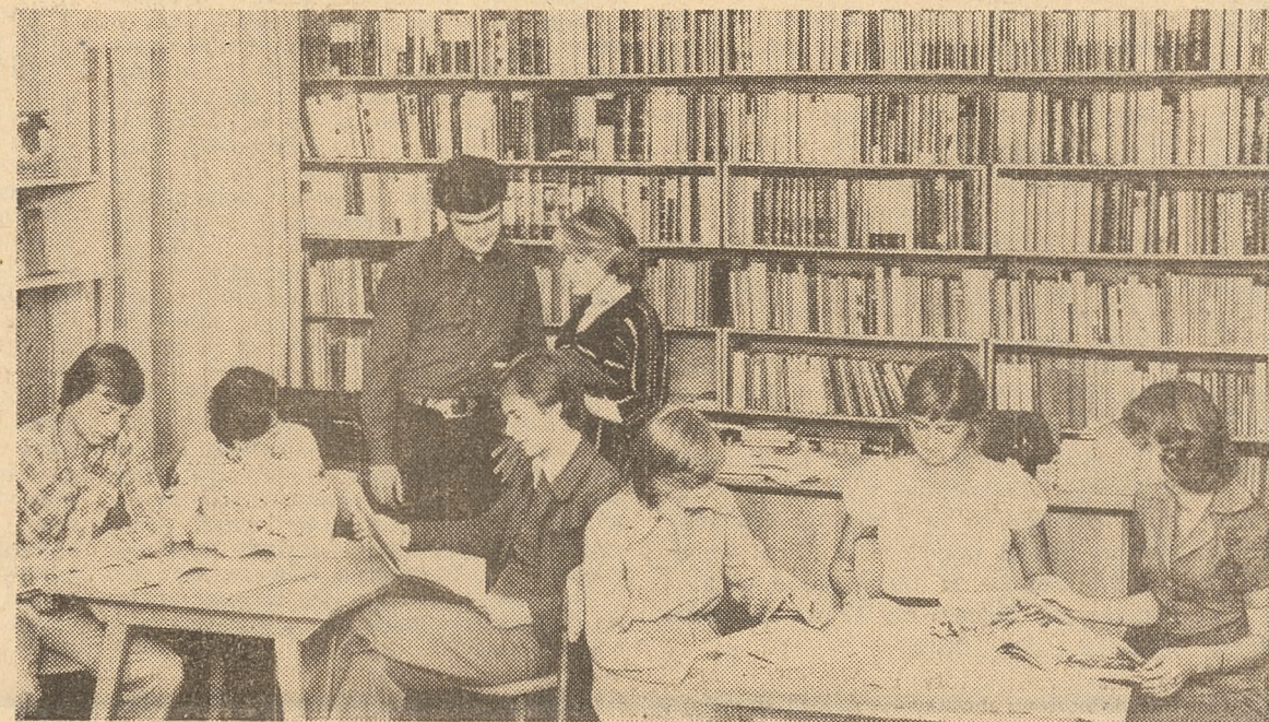
Klub Nauczycielski ZNP w Warszawie na Mokotowie dysponuje bogatą i dobrze wyposażoną czytelnią.

szczy pogląd na przeobrażenia dokonujące się w wielu dziedzinach życia naszego kraju. Wyrazem tego jest zwiedzanie między innymi kluczowych zakładów przemysłowych, budownictwa mieszkaniowego, obiektów kulturalnych, oświatowych, sportowych i innych. Systematyczną działalność turystyczną rozwijają nauczycielskie koła PTTK, których ZNP posiada obecnie 320. Wiele tych