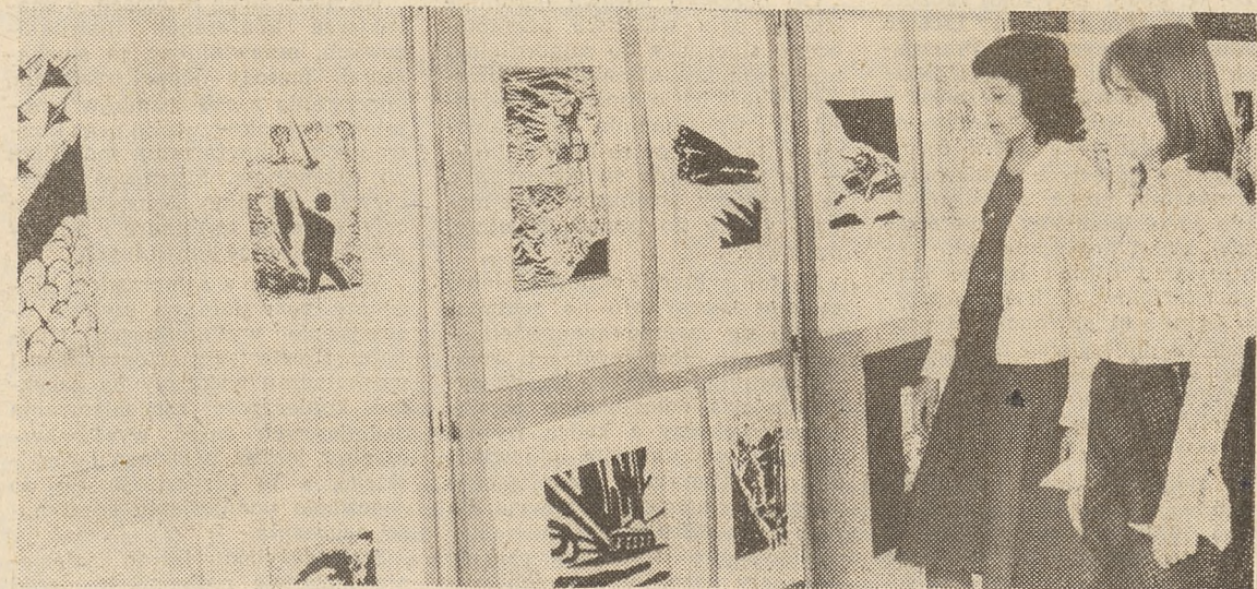
Chodzi przecież o rozmiłowane uczestnictwo młodych w kulturze...