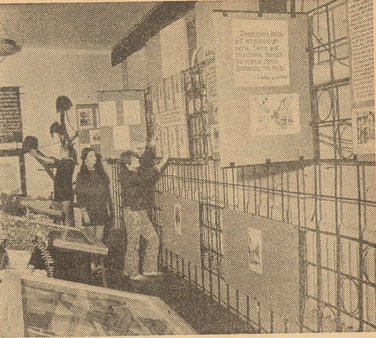
Izba Pamięci Narodowej w Szkole Podstawowej w Siemiatyczach.

● Zasada osobistego przykładu wychowawcy.