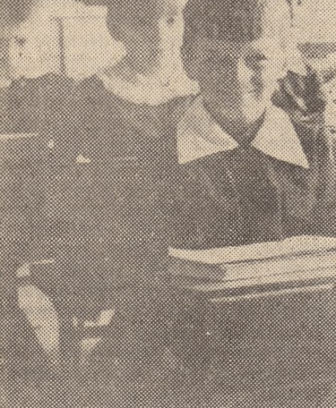
Nurtuje mnie problem wyrównania startu dziecka wiejskiego — mówi koleżanka Skowron.

— Przed wszystkim problem wyrównania poziomu startu dziecka wiejskiego. Powołałem w szkole trzy oddziały przedszkolne i trzy ogniska przedszkolne. Skupiają one 97 proc. sześciolatek. Pragniemy, aby w przyszłości z