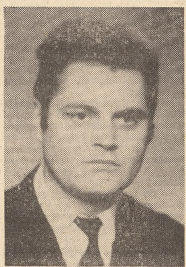
wiele zostało jeszcze do zrobienia to już dziś mamy być z czego dumni.

Dotyczy to zarówno wzajemnych stosunków między nauczycielami, jak i stosunków dyrektorów do nauczycieli oraz pracowników nadzoru pedagogicznego do podległego sobie personelu szkolnego.