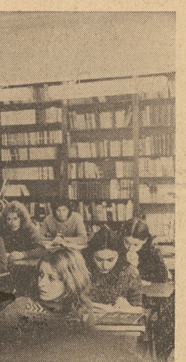
W czytelni głównej zielonogórskiej WSP