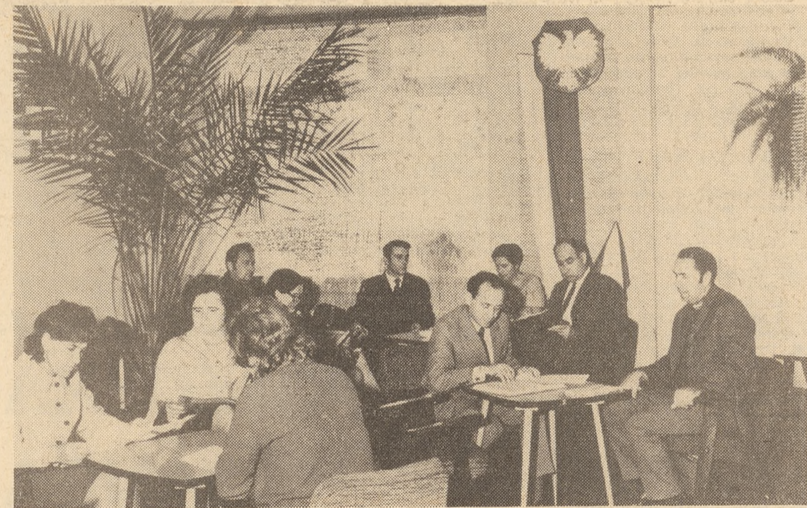
W Klubie Nauczycielskim ZNP Ciechanowie

Drugi problem — to kadra kierownicza. Wiadomo, że o poziomie pracy klubu decyduje przede wszystkim kierownik etatowy, posiadający znajomość potrzeb kulturalnych środowisk nauczycielskich i umiejętności organiza-