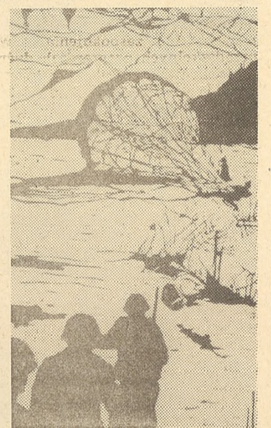
BRONISŁAW TOMECKI „Desant” (linoryt)

Ta trzecia, ostatnia część pracy, narzmiła szczególnie żywymi, nieraz bolesnymi problemami zarówno w przekształcającej się